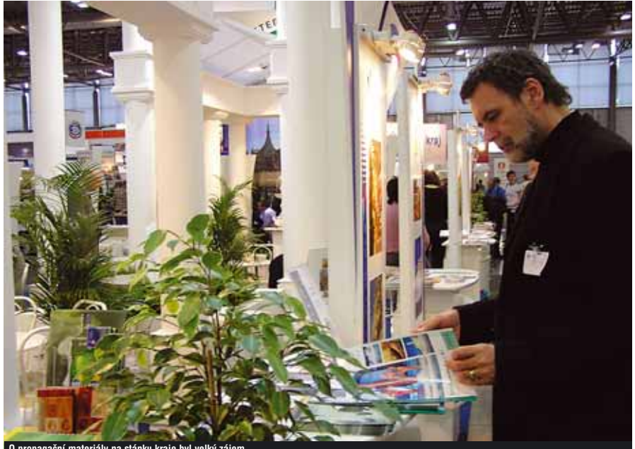
O propagační materiály na stánku kraje byl velký zájem.