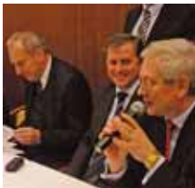
Zákona o veřejných ústavních zdravotnických zařízeních. Podle tohoto dokumentu by krajské

Hejtmáni krajů České republiky začátkem ledna v Brně v rámci 8. zasedání Rady Asociace krajů projednávali aktuální témata, mezi kterými nechyběla problematika krajského zdravotnictví. Zasedání rady se konalo den před schůzkou hejtmánů s premiérem Jiřím Paroubkem.