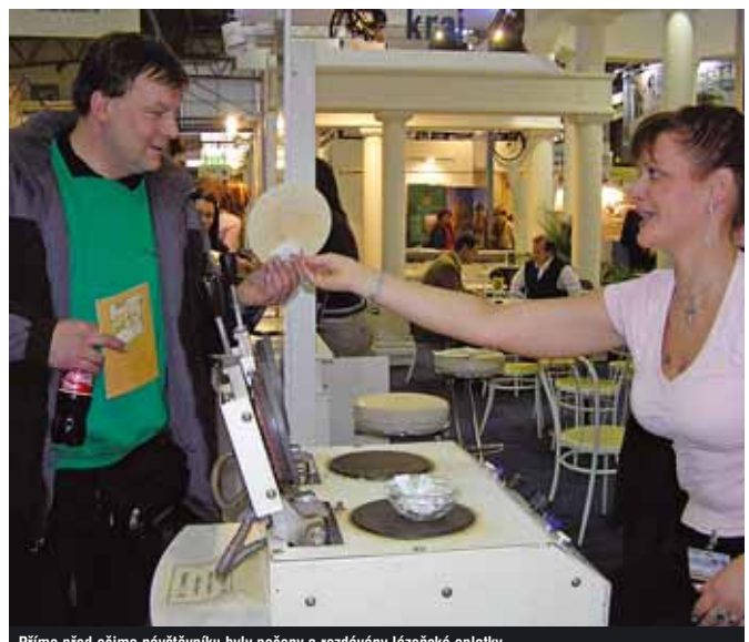
Přímo před očima návštěvníku byly pečeny a rozdávány lázeňské oplatky.