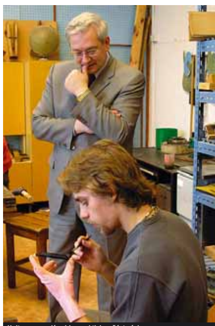
Hejtmán se zajímal i o praktickou část výuky.