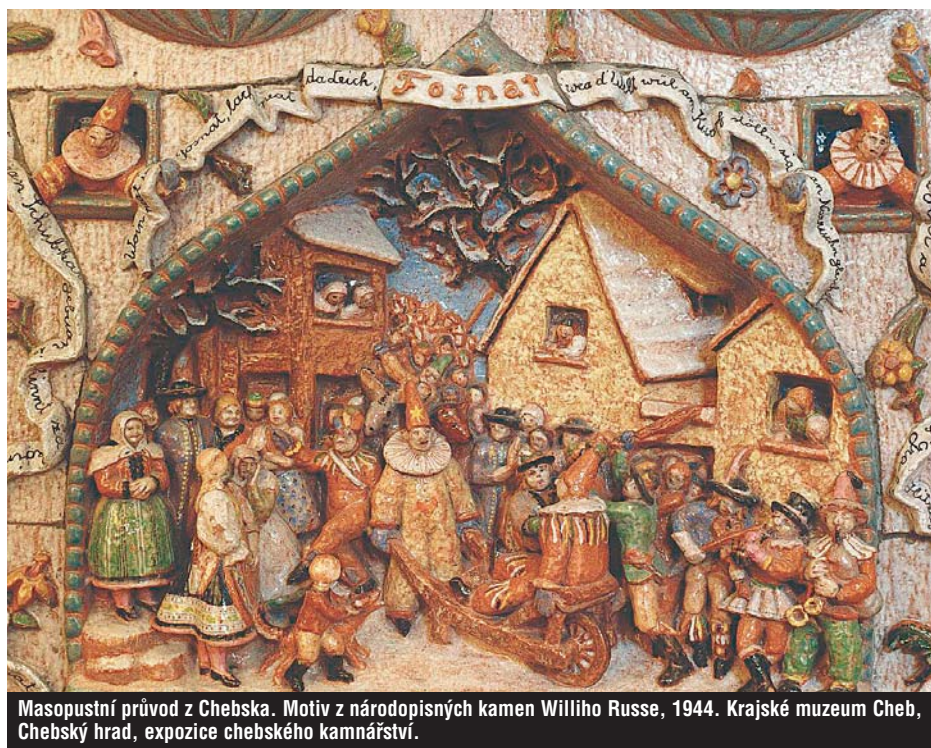
Masopustní průvod z Chebska. Motiv z národopisných kamen Williho Russe, 1944. Krajské muzeum Cheb, Chebský hrad, expozice chebského kamnářství.

Nezbedný masopustní průvod plný masek vyrazí v sobotu 12. února v 15 hodin od budovy Západočeského divadla v Chebu, proplete se uličkami starého města, aby zakončil svoji pouť v dolní části náměstí Krále Jiřího z Poděbrad před budovou muzea. Všechny masky masopustního reje si pak budou moci prohlédnout výstavu „Od masopustu k Velikonocům“, v nádvoří muzea a v muzejní kavárně na ně budou čekat lahůdky masopustních vepřových hodů, masopustní koblihy, koláče, nápoje všeho druhu a jiné laskominy, které připraví chebské firmy a soukromníci. Vyvrcholením veselého reje bude slavnostní pochování Masopusta, ke kterému dojde na