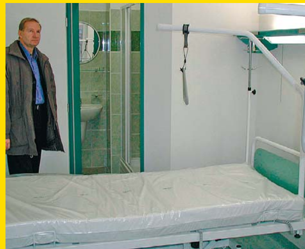
Rekonstruovaná oddělení dostala stovku nových elektricky polohovatelných lůžek se speciálními matracemi.