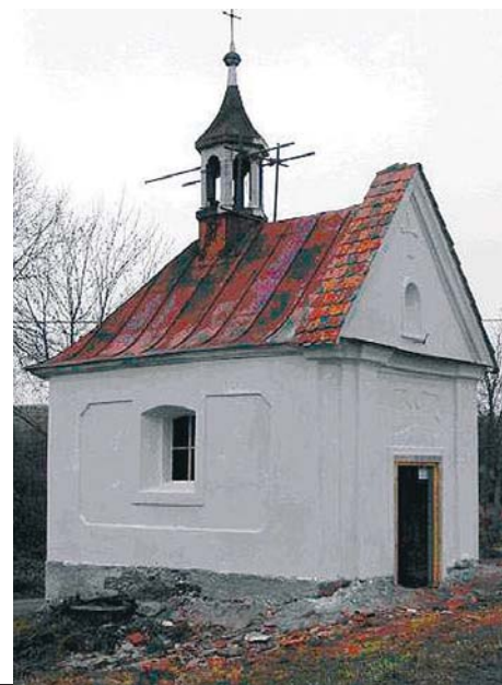
I díky podpoře Karlovarského kraje bylo možné obnovit fasádu kapličky ve Stoutově.