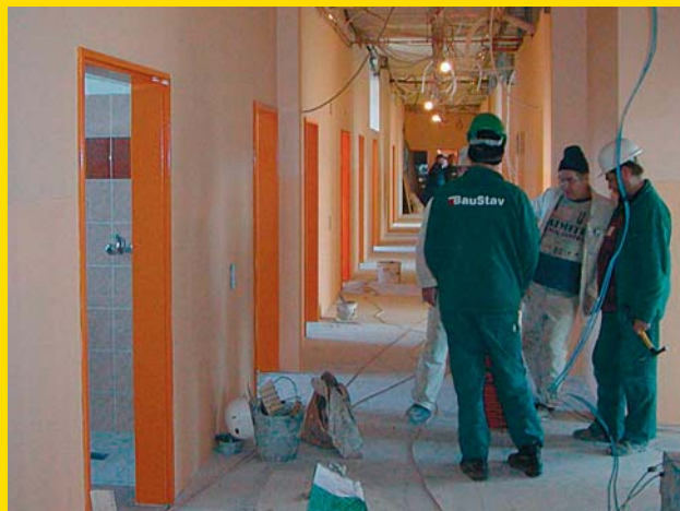
Jednotlivá podlaží dostala zcela nová dispoziční řešení celých oddělení, interiér každého patra má vlastní barevné ladění.