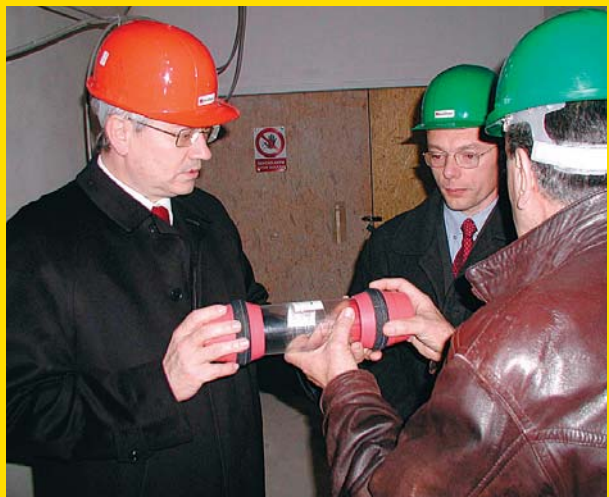
Rekonstrukce inženýrských sítí se dotkla také potrubiční pošty, kterou zdravotníci využívají k posílání dokumentace i krevních konzerv.