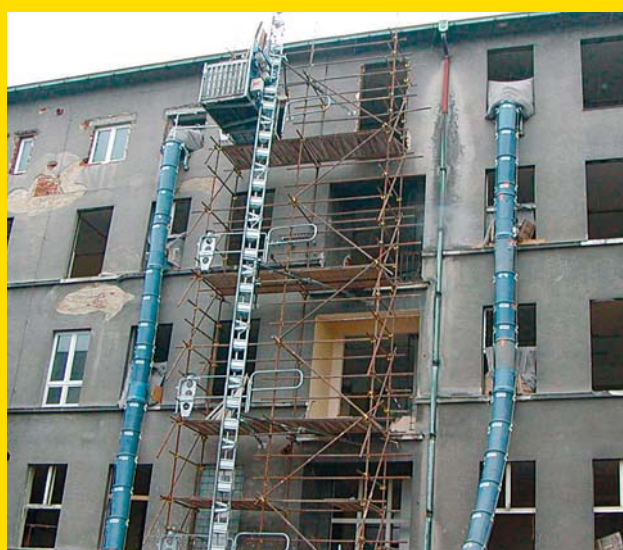
Bylo nutné posílit statiku budovy.