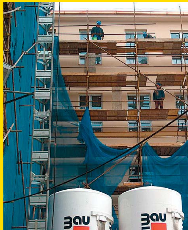
K rekonstrukci budovy samozřejmě patřilo i zateplení fasády.