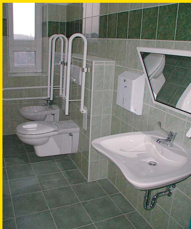
Sociální zařízení už nejsou společná pro celé patro, ale jsou na jednotlivých pokojích.