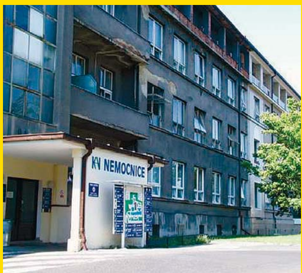
Pavilon č. 4 před zahájením rekonstrukce (červen 2004).