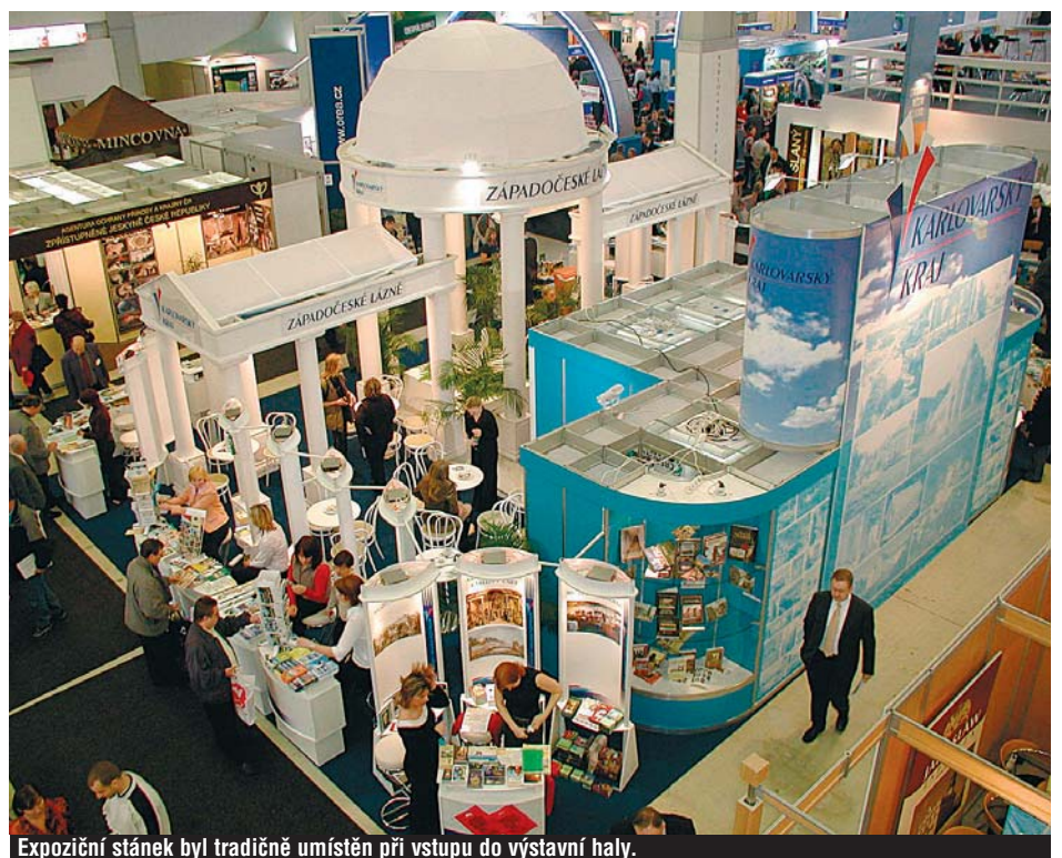
Expozici stánek byl tradičně umístěn při vstupu do výstavní haly.