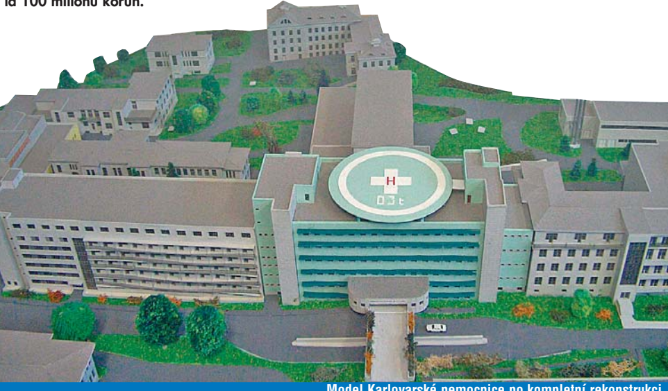
Model Karlovarské nemocnice po kompletní rekonstrukci

Slavnostní otevření kompletně zrekonstruovaného pavilonu č. 4 Nemocnice Karlovy Vary se uskuteční 28. ledna. Standard nemocniční poskytované péče tak stoupne na úroveň renomovaných zdravotnických zařízení. Karlovarský kraj do rekonstrukce karlovarské nemocnice investoval z vlastních prostředků bezmála 100 milionů korun.