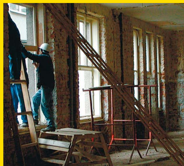
Objekt dostal nové rozvody a nová okna.