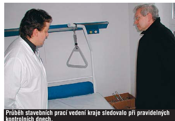
Průběh stavebních prací vedení kraje sledovalo při pravidelných kontrolních dnech.

Kompletní rekonstrukci a dostavbu Nemocnice Karlovy Vary nastartovala na přelomu milénia I. etapa vybudováním Hospodářského pavilonu (nová žlutá budova, kde sídlí stravovací provoz, lékárna, centrální laboratoře a patologie). Na celkové investici ve výši přibližně 380 milionů korun se částkou zhruba 50 milionů korun podílelo město Karlovy Vary.