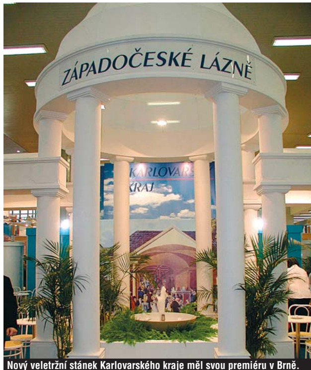
Nový veletržní stánek Karlovarského kraje měl svou premiéru v Brně.

Ve dnech 13. až 16. ledna proběhl na brněnském výstavišti již 14. ročník Mezinárodního veletrhu turistických možností v regionech REGIONTOUR 2005. Veletrhu se zúčastnil s vlastní expozicí také Karlovarský kraj, který v Brně zařadil všechny prezentace subjektů z našeho regionu. Karlovarský stánek zaznamenal mimořádný zájem návštěvníků.