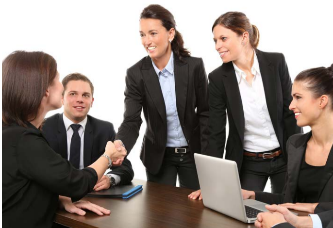
Projekt Outplacement Okolo 4 tisíc zaměstnanců ve výpovědi dostane možnost získat novou práci.

Projekt je financován z prostředků Evropského sociálního fondu a státního rozpočtu ČR prostřednictvím Operačního programu Zaměstnanost a probíhá od 1. června 2020. Pokračovat by měl do 30. června 2022. (KÚ)