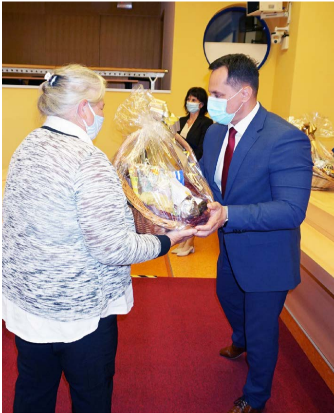
Věk pro nás není překážkou Ceny v podobě dárkových košů a publikací o regionu převzalo z rukou hejtmana Petra Kubise devět účastníků 7. ročníku soutěže.