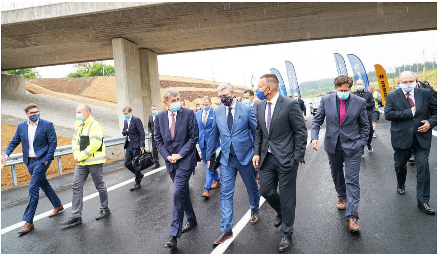
Vládní návštěva První zastávkou delegace byla společnost Sokolovská uhelná. Premiér se zúčastnil také slavnostního otevření obchvatu Trstěnice-Drmoul. Při této příležitosti Andrej Babiš připomněl, že se letos otevře ještě více než 20 kilometrů nových dálnic.