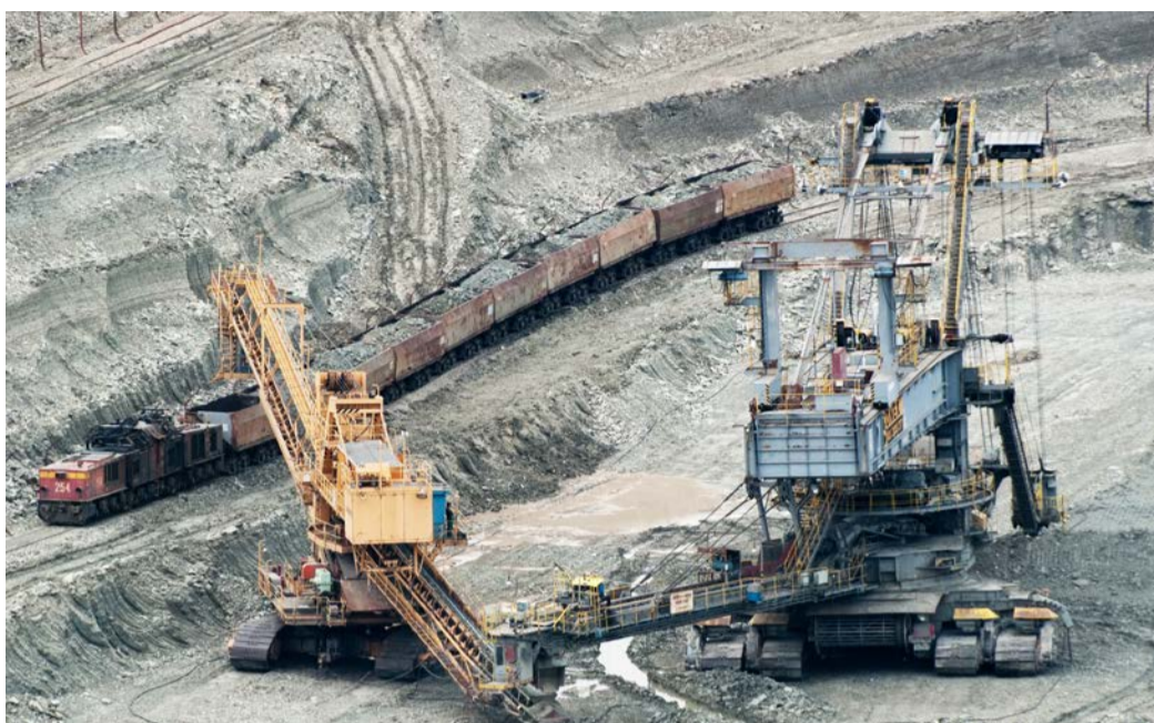
Těžba uhlí Důl Jiří leží severně od Sokolova, dobývací prostor Alberov nese jméno dnes už neexistující vesnice uprostřed dnešního dolu.