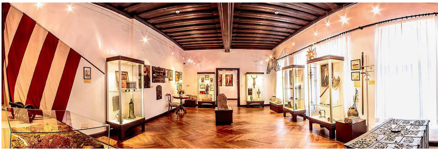
Po rekonstrukci Muzejní expozice v Chebu byla pro veřejnost více než rok uzavřena. Rekonstrukce se týkala obou budov muzea, expozice v Pachelbelově domě a ředitelství v Müllerově domě.

„Pro návštěvníky i pro pracovníky našich krajských kulturních institucí je to samozřejmě dobrá zpráva, protože sezóna už začala a prázdné prostory bez lidí žádnému muzeu ani galerii nesvědčí. První instituce otevřeme od 12. května, ostatní pak postupně do konce května. Věřím, že všichni budou respektovat potřebná ochranná opatření, v kulturní instituci může být v jednu chvíli maximálně 100 osob, které by měly dodržovat rozestupy 2 metry. U vstupu také budou mít lidé k dispozici dezinfekci na ruce a dezinfikovat se budou i prostory budov,“ upřesnil náměstek hejtmána Martin Hurajčík.