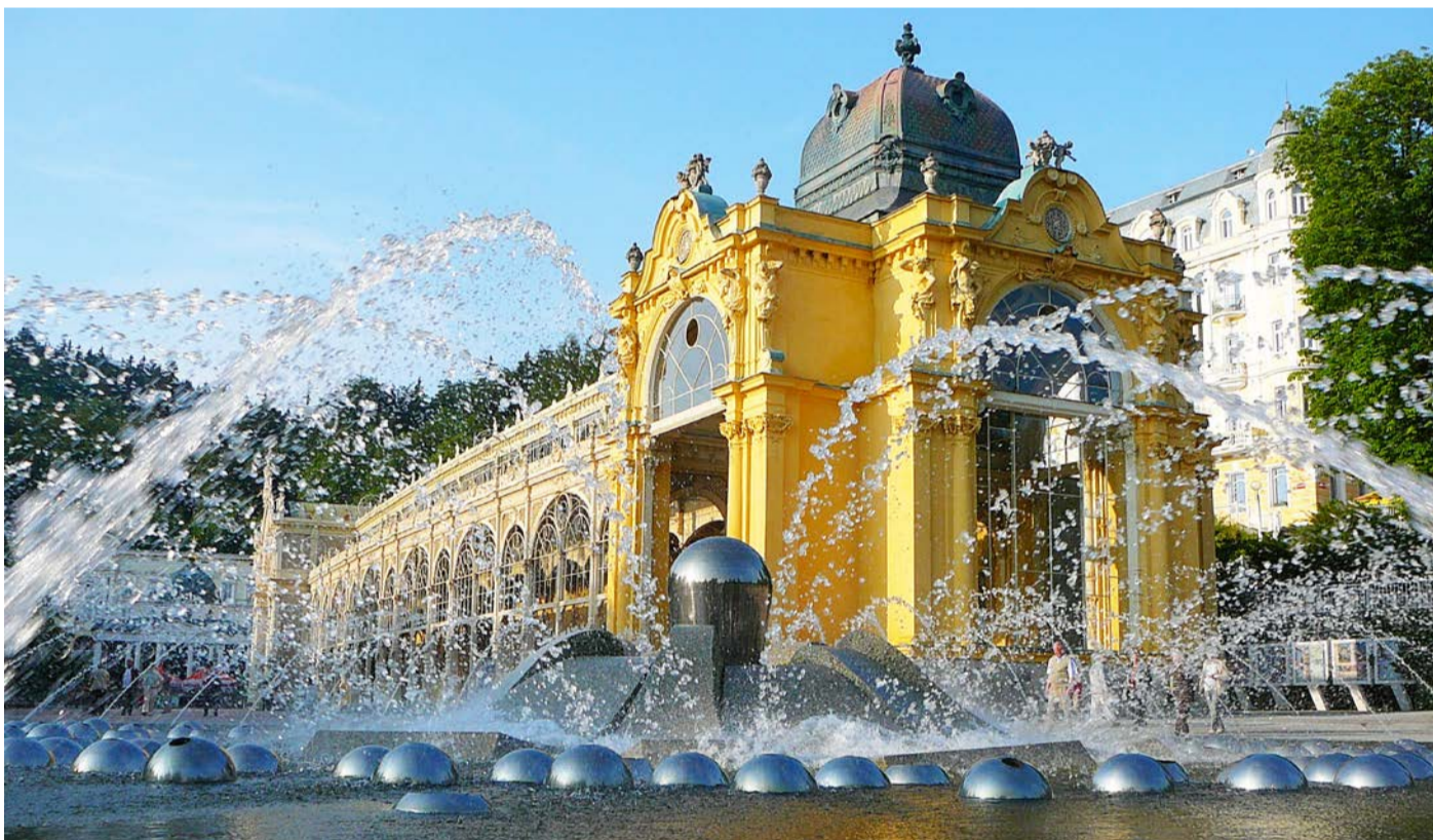
Zpívající fontána patří mezi dominanty Mariánských Lázní, významného bodu zdejšího lázeňského trojúhelníku. O svém vztahu k městu vypráví v anketě na straně 5 řada osobnosti společenského života.

státu i Evropské unie. Připravujeme společnou diskusi prostřednictvím videokonference s premiérem, ministrem zdravotnictví a ministryni pro místní rozvoj. Hrajeme o čas a potřebné kroky je nutné provést rychle, to všichni víme,“ dodal hejtman. O výsledcích všech jednání a o plánu na oživení regionu bude kraj průběžně informovat. (KÚ)