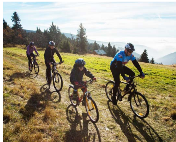
Nyklistické trasy a cyklostezky Klub českých turistů v regionu spravuje přes 2 tisíce kilometrů.

V současné době spravuje Klub českých turistů v regionu přes 2 tisíce kilometrů cyklistických tras a cyklostezek. Všechny úpravy jsou prováděny tak, aby byla naplnována dlouhodobá koncepce údržby a rozvoje sítě cyklotras na území celého Karlovarského kraje. O tom, že svoji práci odvádí jeho členové skutečně dobře, svědčí nejenom pozitivní zpětná vazba od cyklistů či turistů z nejrůznějších koutů naší země, ale také to, že značení Karlovarského kraje je v posledních letech pravidelně vyzdvihováno na konferencích, workshopech či setkáních týkajících se cyklistiky. (KÚ)