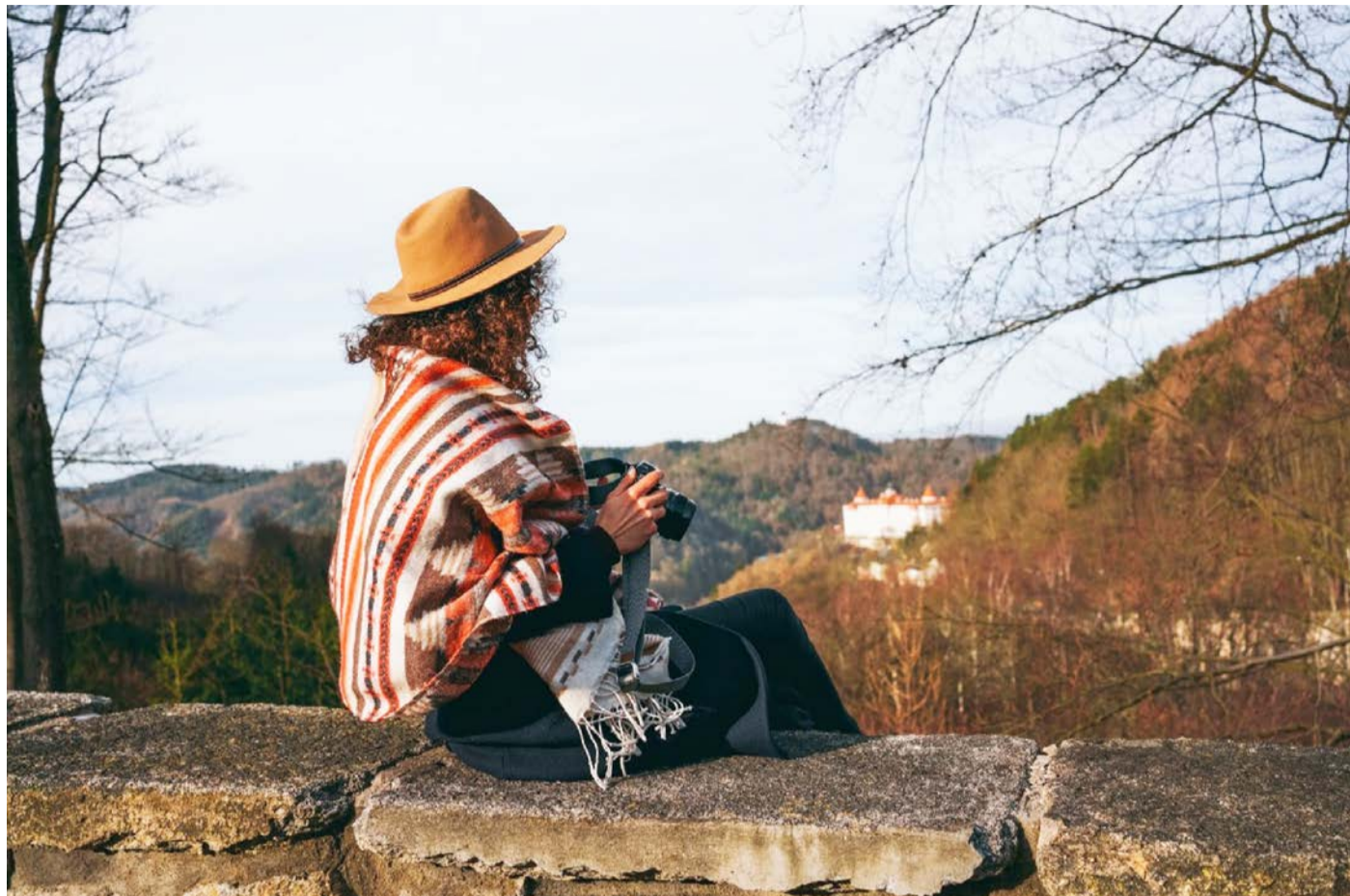
Karlovarský kraj - Dovolená doma Kampaň cílí na aktivní návštěvníky a rodiny s dětmi. Spojuje lázeňskou relaxaci s výlety a volnočasovými aktivitami.

KARLOVARSKÝ KRAJ Dovolená doma. Název online kampaně krajské destinační agentury Živý kraj odkazuje na své letošní zaměření: posílení domácího cestovního ruchu. Kampaň odstartovala již 1. dubna 2020 a cílí na aktivní návštěvníky a rodiny s dětmi z celé ČR. Nabízí spojení lázeňské relaxace posilující zdraví a imunitu s širokou nabídkou výletních cílů a volnočasových aktivit.