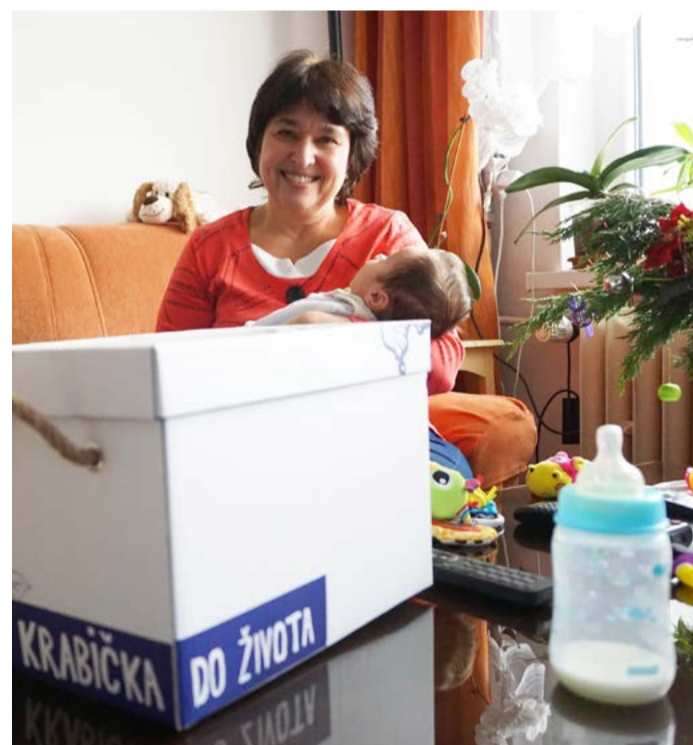
Krabička do života Fotokniha pro pořízení snímků miminek a další praktické drobnosti pomohou dětem uchovat vzpomínky na rané dětství.

náhradní rodinné péče (pěstounská péče nebo osvojení). Krajský úřad má pro dlouhodobou náhradní rodinnou péči aktuálně v evidenci 267 dětí. (KÚ)