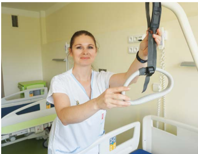
Náborové příspěvky Pro nově nastupující zdravotníky vyčlenil kraj ve svém rozpočtu 5 milionů korun.

Kraj na příspěvky vyčlenil v rozpočtu 5 milionů korun. „Díky náborovým příspěvkům se nám daří stabilizovat počet zdravotníků v našich nemocnicích, proto jsme se rozhodli je vyplácet i v roce 2020. Příspěvky budeme rozdělovat mezi nové lékaře a zdravotníky těch oddělení nemocnic, která bychom potřebovali personálně posílit. V karlovarské nemocnici je to kardiologie, plicní a interna, v nemocnici v Chebu interna a chirurgie, v Sokolově interna, pediatrie a radiologie