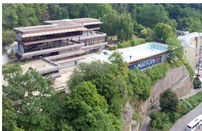
Hotel Thermal Kompletní rekonstrukce hotelové, kongresové a bazénové části by měla být hotová do 1. června 2021.

KARLOVARSKÝ KRAJ V závěru srpna přijel do Karlovarského kraje předseda vlády Andrej Babiš spolu s některými ministry. Cílem jejich cesty se stal hotel Thermal, kde se plánuje velká rekonstrukce hotelové části a chátrajícího bazénového centra, ale navštívili také obce Josefov, Lomnice a Rotava. Na své cestě do regionu se vládní činitelé zastavili na rozestavěné dálnici D6 u Krušovic a u karlovarského Doubského mostu, jehož oprava by měla být hotova začátkem prosince. Společně s nimi přijela na prohlídku rozestavěného úseku D6 u Krušovic i hejtmanka Jana Mračková Vildumetzová. Ta před časem premiéra i ministra požádala, aby změnili stanovisko ministerstva dopravy, které chtělo na části budoucí D6 mezi Bošovem a Karlovými Vary zúžit silnici z 25,5 metru na 21,5 metru, řidiči by navíc museli jezdit rychlostí 110 km/h. Jako důvod ministerstvo dopravy uvedlo, že úsek není intenzivně dopravně vytižen. Kraj to razantně odmítl s tím, že chce v celém úseku od Karlových Varů do Prahy plnohodnotnou dálnici. Premiér Babiš podpořil kraj v tom, že D6 musí mít veškeré parametry dálnice, a na základě toho vyzval ministra dopravy Vladimíra Kremlíka, aby ihned stanovisko změnil a řešil to s Ředitelstvím sil-