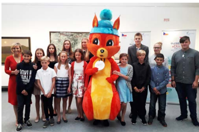
Veverka Čiperka Úspěšní sportovci si zapožovali také s maskotem příští Olympiády dětí a mládeže, která se bude konat v Karlovarském kraji.