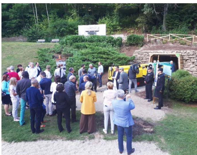
Výprava za krásami UNESCO představení expozice důlní techniky

„Skupinový zápis je obrovský úspěch, ale i výzva nezůstat pozadu za aktivitami saské strany, protože návštěvník bude srovnávat. Naše snaha představit hornickou minulost návštěvníkům i aktivity s tím spojené ale zápisu našetřít předcházela. Jako provozovatel posledního aktivního dolu jsme cítili potřebu jej zpřístupnit alespoň virtuálně. Otevření saunového dolu bylo vlastně jen náhodou načasování úplně ideálně. Stal se tak symbolickým darem a nám se nyní postupně daří dokončovat i ostatní dlouho připravované projekty z této oblasti – venkovní expozici nebo filmovou exkurzi do Svornosti. Většinu z nich realizujeme jen s omezeným privátním rozpočtem na nekomerční bázi