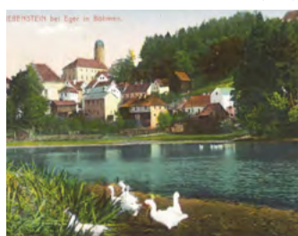
Obnova památek Příspěvek od Karlovarského kraje obdržel třeba raně gotický Hrad a zámek Libá na Chebsku. Oblíbené výletní místo se bude moci pochlubit novými okny a dveřmi.