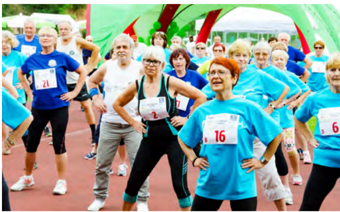
Sportovní hry seniorů hostí letos volnočasový areál Bohemia v Sokolově.

Cílem projektu, který založil v roce 2007 fitness trenér a bývalý mistr