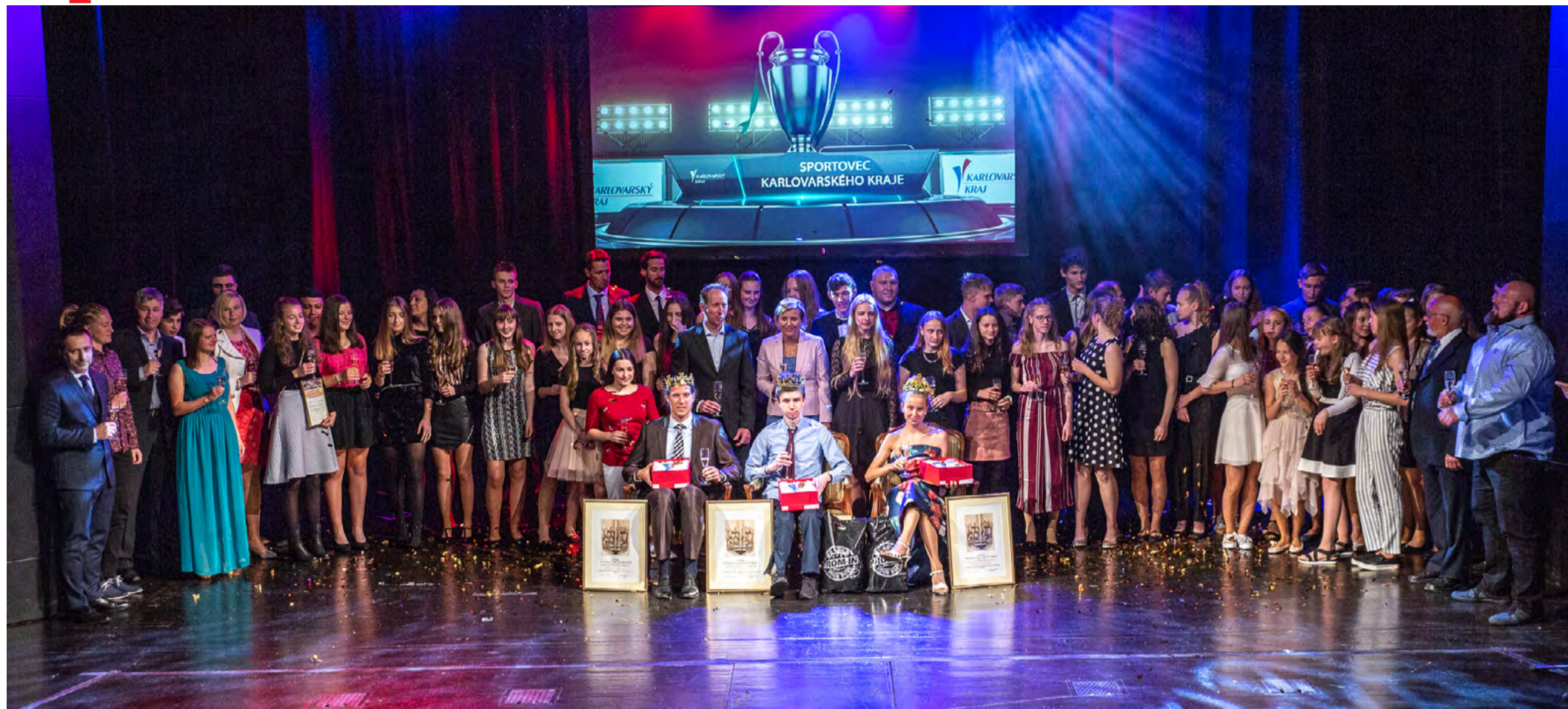
Sportovci roku 2018 Sportovci, trenéři a sportovní legendy, kteří dosáhli výjimečných úspěchů či se zasloužili o rozvoj sportu v regionu, byli slavnostně oceněni v prostorách Karlovarského městského divadla.