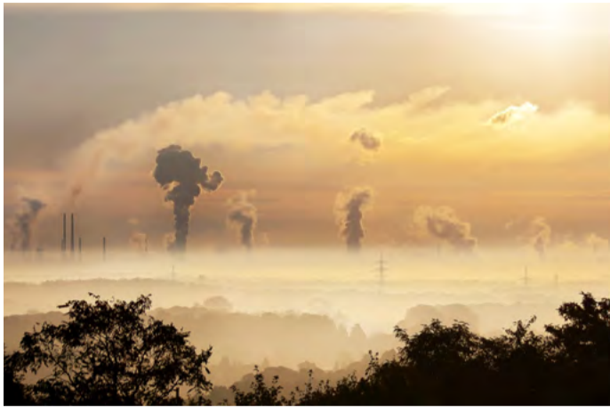
Emisní povolenky V příštích čtyřech letech odejde do státního rozpočtu více než 8 miliard korun.