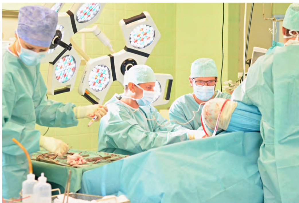
Šest nových operačních sálů. Podoba čtvrtého nadzemního podlaží pavilonu nemocnice v Sokolově se už brzy zásadně změní.

„Je pro nás samozřejmé, že nejen pacienti v Karlovarské krajské nemocnici, jejímž jediným akcionářem je Karlovarský kraj, ale i občané v pronajaté sokolovské nemocnici si zaslouží zdravotní péči na vysoké úrovni. Proto chceme postupně pokračovat v obnově budov a zařízení sokolovské nemocnice, stejně jako nemocnic v Karlových Varech a v Chebu. V Sokolově vznikne 6 nových operačních sálů, což zásadně změní podobu celého 4. nadzemního podlaží pavilonu, kde se vybuduje i střešní nástavba nové strojovny vzduchotechniky,“ uvedla hejtmanka Jana Mračková Vildumetzová. Zároveň zdůraznila, že se díky novým sálům podstatně zkrátí čekací doba na operace. Stavební akce provede v období od konce února 2019 do května 2020 akciová společnost Geosan Group, která zvládla i zadávacím řízením. Zároveň s budováním sálů se změní technické řešení prostor tak, aby měly parametry požadované pro