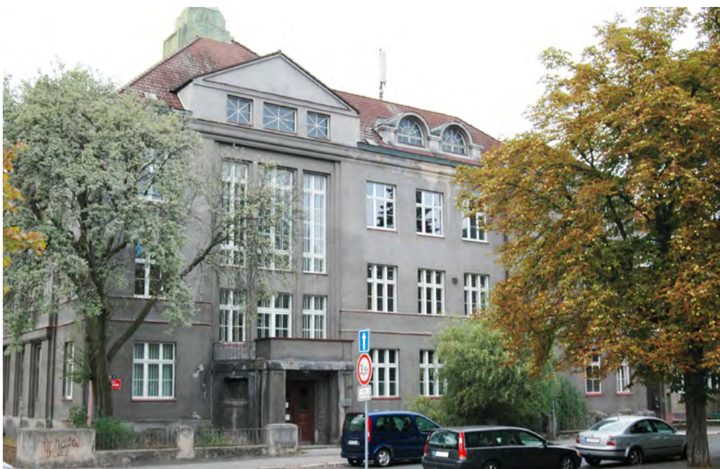
Střední uměleckoprůmyslová škola Karlovy Vary Statika budovy je narušená, potřebuje kompletní rekonstrukci.

Dalším projektem je zlepšení kvality bydlení, opravy stávajících a výstavba nových bytů ve městech a obcích regionu. „Svolali jsme starosty 15 největších měst v kra-