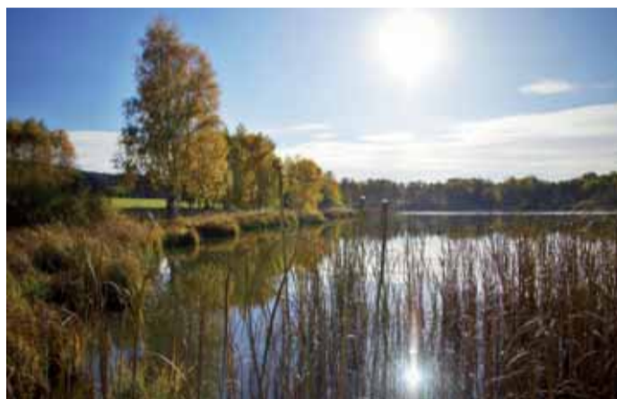
Blažejský rybník u Nežichova. Jedna ze čtyř nových přírodních památek v Karlovarském kraji.

Začleňování nových území do soustavy Natura 2000 postupně pokračuje a kromě řady evropsky významných lokalit, které jsou již nyní formálně chráněny institutem základní ochrany, je i řada s vyšším statutem. Mimo působnost Správy CHKO Slavkovský les jsou to například přírodní rezervace Vysoký kámen, U sedmi rybníků, Ostrovské rybníky a další. Jak doplnil krajský radní Václav Jakubík, v současnosti se v regionu, mimo území CHKO Slavkovský les, nachází bezmála čtyřicet přírodních památek a rezervací.