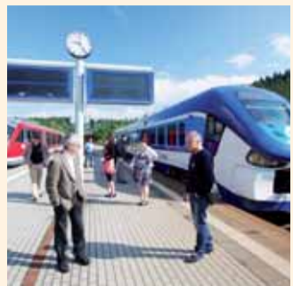
Účastníci konference IMPA 2014 na nádraží v německém Johanngeorgenstadtu, kam je v rámci praktické ukázky dovezl moderní vlak RegioShark.