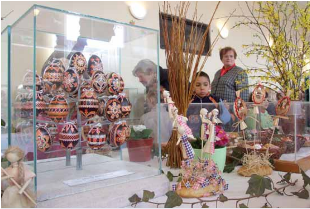
Letošní výstava kraslic v Kraslicích představila stovky zdobených vajec z celé republiky.