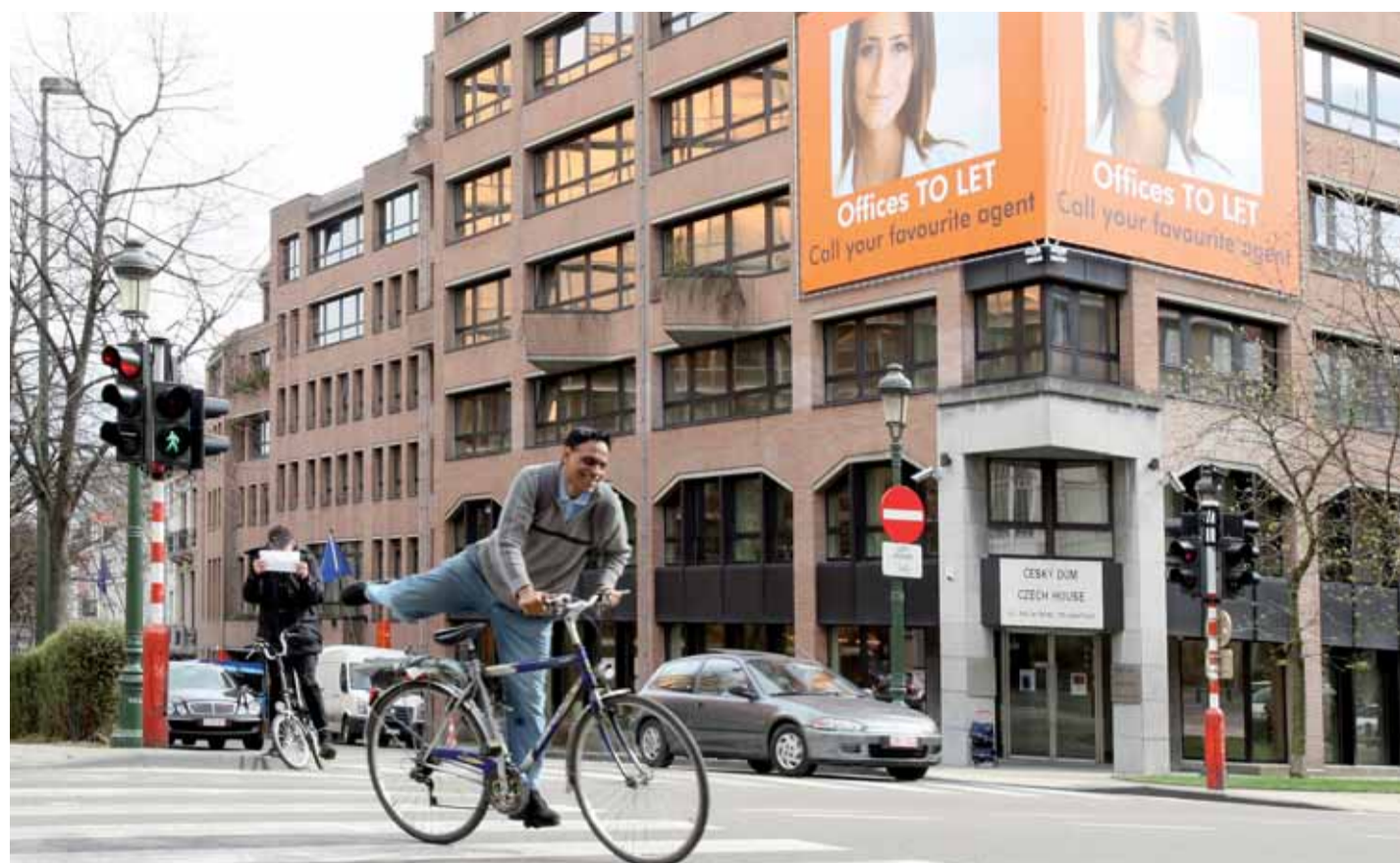
Budova Českého domu v Bruselu, kde sídlí zástoupení Karlovarského kraje.