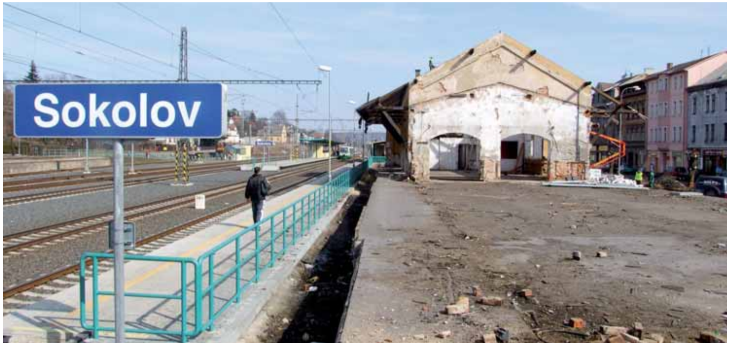
Sokolovské nádraží prochází radikální změnou. Místo roky chátrajících nevzhledných budov starých skladů zde vyrostou moderní dopravní terminál s autobusovým nádražím, napojením na MHD i cyklostezky.