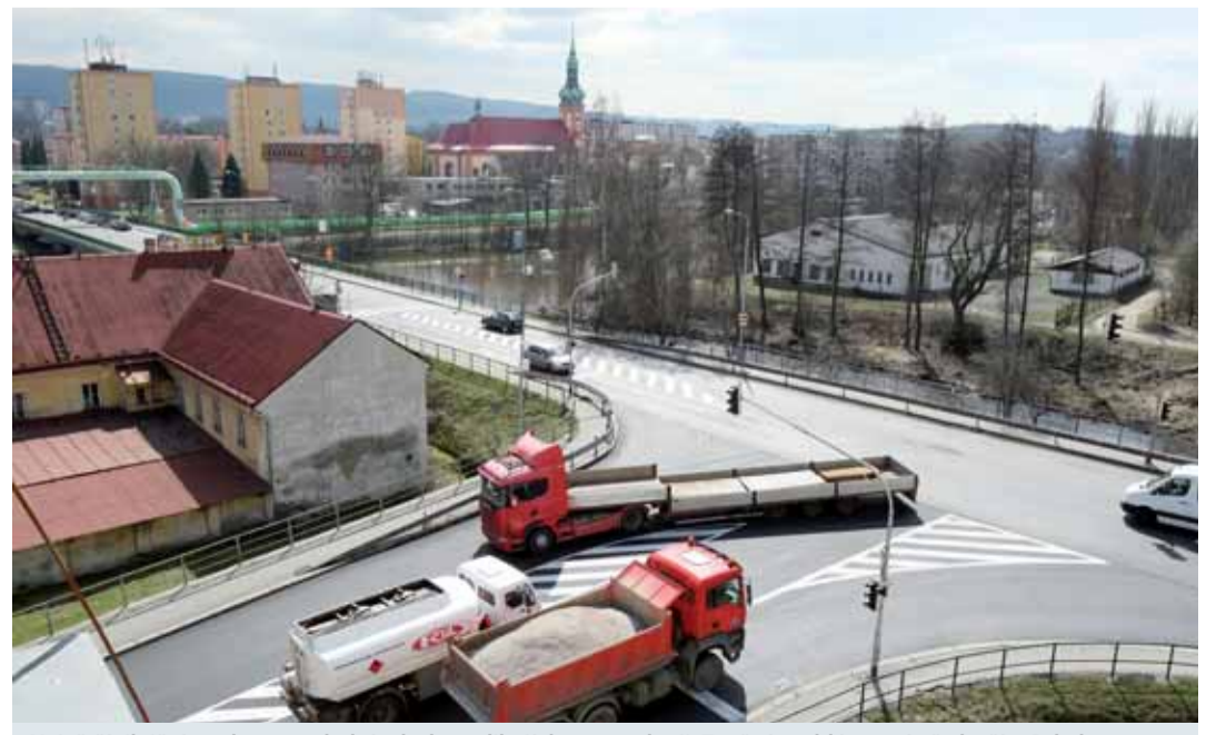
Největší silniční stavby za poslední roky komplikují dopravu v kraji. Značné problémy má především Sokolov.