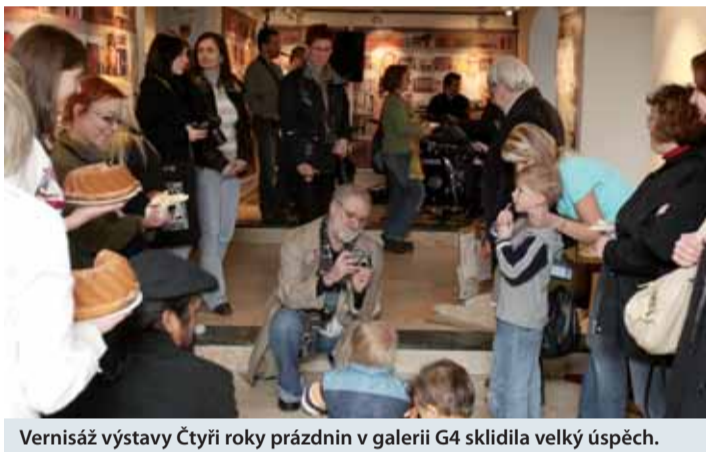
Vernisáž výstavy Čtyři roky prázdnin v galerii G4 sklidila velký úspěch.

Neobvyklou výstavu fotografií nazvanou Čtyři roky prázdnin hostí v těchto dnech chebská galerie G4. Ta shrnuje výsledky práce pěti žen, které obrazem mapovaly své mateřské dovolené. A jak z často výrazně naturalistických snímků vyplývá, více než dovolenou ty roky připomínaly jízdu na kolotoči.