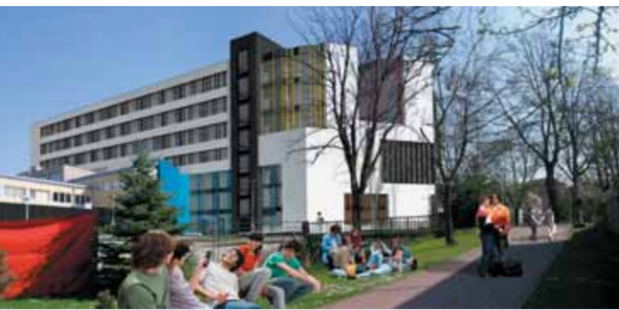
Nová budova ISŠTE ve vizualizaci z projektové dokumentace

Nová sedmipatrová budova nabídne 13 prostorových učeben pro 32 žáků a 14 učeben pro 16 žáků. Samozřejmostí je laborator fyziky a chemie. Dvě nové učebny výpočetní techniky