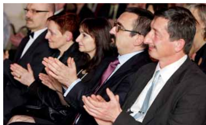
Aplaus diváků v sále si zaloužily výkony všech oceněných.