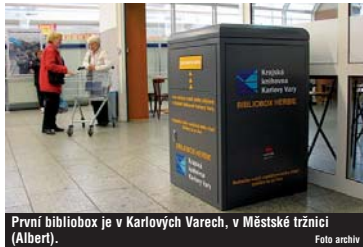
První bibliobox je v Karlových Varech, v Městské tržnici (Albert).

Victanou novinku hned ve dvou exemplářích dostali v října čtenáři Krajské knihovny. Mohou využívat dva biblioboxy Herbie.