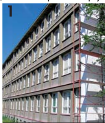
První české gymnázium v Karlových Varech před rekonstrukcí (1) a po 1. etapě rekonstrukce (2).

a naším záměrem bylo a je vytvořit jim důstojné zázemí a co nejlepší podmínky pro studium,“ uvedl hejtan Josef Pavel s tím, že prodejem a převody nadbytečných školských objektů navíc získal kraj prostředky k dalšímu reinvestování do školství. V současnosti je v kraji realizována řada stavebních akcí, jejichž cílem je zmodernizovat a vybavit školy tak, aby odpovídaly vzdělávacím potřebám doby, která klade vysoké nároky na jazykové a odborné vybavené absolventy. V létě byla dokončena 1. etapa rekonstrukce Prvního českého gymnázia v Karlových Varech, přičemž do zateplení fasády, výměny oken a úpravy sociálních zařízení kraj investoval cca 21 milionů korun a celkově by náklady včetně úpravy okolí a vybudování nového sportoviště měly dosáhnout 100 milionů korun. Během října 2007 byla dokončena rekonstrukce školní jídelny ISŠTE Sokolov v nákladu ve výši 7 milionů a počítá se s další modernizací školy. „Kdyby kraj nepřistoupil k optimalizaci, jen těžko by mohl výrazným způsobem investovat do potřebných rekonstrukcí a úprav školských