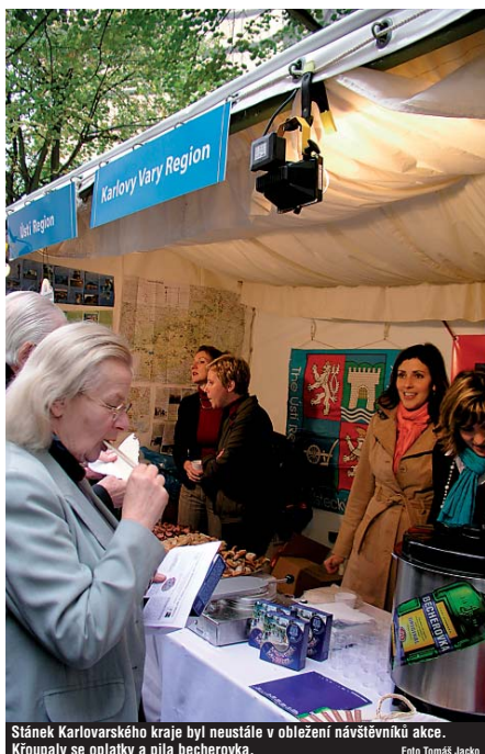
Stánek Karlovarského kraje byl neustále v obležení návštěvníků akce. Křoupaly se oplatky a pila becherovka.