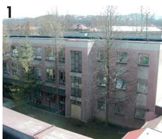
Studie modernizace ISŠT (foto 1 – původní stav, foto 2 – vizualizace).