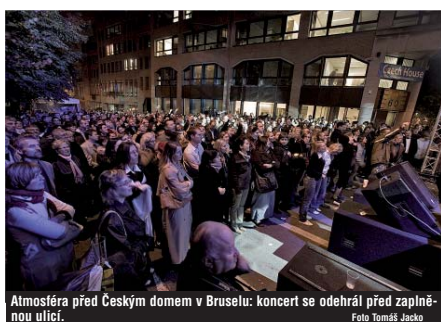
Atmosfera před Českým domem v Bruselu: koncert se odehrál před zaplněnou ulicí.