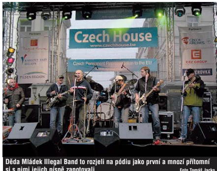
Děda Mládek Illegal Band to rozjeli na pódiu jako první a mnozí přítomní si s nimi jejich písně zanotovali.