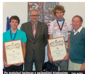
Po gratulaci hejman s nejlepšími triatlonisty.