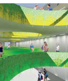
Autor: Roman Koucký, architektonická kancelář, s.r.o.