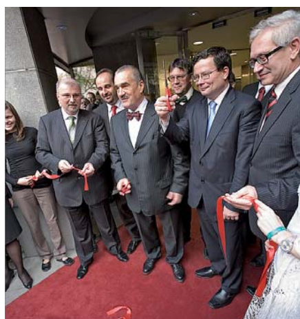
Nejvýznamnější hosté nad červeným koberecem rukou společnou slavnostně přestříhali pásku u vstupu do Českého domu, a zahájili tak oficiálně jeho činnost.