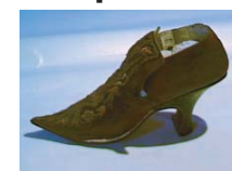
Jedním z předmětů, které se na čas přestěhovaly z Chebu do Prahy, je sřevíček Valdštejnovy manželky Izabely Kateřiny z Harrachu. Unikátní je také Valdštejnov kord. Rovněž zapůjčen z Chebu.

valdštejnské sbírky nebyly mimo Cheb dosud prezentovány. Zájem o ně přitom už projevila i muzea ze zahraničí. Pražská výstava bude vyvrcholením Roku Albrechta z Valdštejna. O Valdštejna však nebudou ochuzeni ani návštěvníci z Karlovarského kraje. Krajské muzeum připravuje v Chebu vlastní výstavní projekt Al-