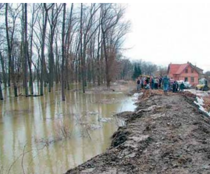
vodovod Tachovská huť ve rekonstrukce přiváděče vod v Třebčích Sekerách na Chebsku či v Trstěnicích. (HAD)

„Za přispění Karlovarského kraje se tak může zrealizovat kanalizace a čistírna odpadních vod v Šabině na Sokolovsku,