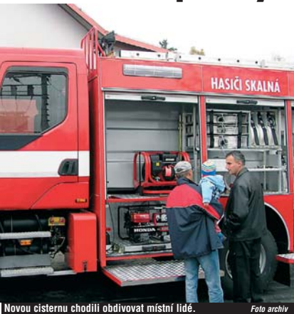
Novou cisternu chodili obdivovat místní lidé.

Nové zásahové vozidlo získal sbor dobrovolných hasičů ve Skalné. Profesionální cisterna bude sloužit na území Františkolázeňska. Proto se obě města rovným dílem podílela na financování nákupu cisterny. Jak Skalná, tak Františkovy Lázně do nového vozidla investovaly po dvou milionech korun. Jedním milionem příspěv Karlovarský kraj, další dva získala Skalná od ministerstva vnitra jako dotaci na obnovu