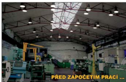
PŘED ZAPOČETÍM PRACÍ ...