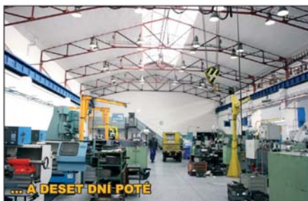
... A DESET DŇÍ POTĚ

• Pracujeme ve výškách až do 30m • Naše plošiny projedou i 90cm dveřmi a snadno se pohybují ve stísněných prostorách mezi výrobními stroji, technologiemi a materiálem • Pracovní plošiny mají pohon na baterie, takže nezatěžují okolí výfukovými plyny