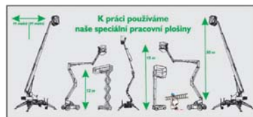
K práci používáme naše speciální pracovní plošiny

• Pracujeme ve výškách až do 30m • Naše plošiny projedou i 90cm dveřmi a snadno se pohybují ve stísněných prostorách mezi výrobními stroji, technologiemi a materiálem • Pracovní plošiny mají pohon na baterie, takže nezatěžují okolí výfukovými plyny