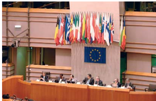
a ministerstvo uzavřít v prvním čtvrtletí kanceláří pro kraje se předpokládá na příštího roku. Zprovoznění bruselských podzim 2007. (LAM)

Smlouvu o Projektu podpory prosazování regionálních zájmů ČR v EU, ze které pak vyplyne konkrétní výše zvýhodněného nájemného, by měly kraje