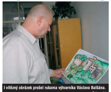
I vítězný obrázek prošel rukama výtvarníka Václava Balšána.

„Celkem jsme dostali 15 fotografií a 19 výtvarných prací. Ve srovnání s minulými ročníky mají i fotografie a obrázky, které nebyly oceněny, vyšší úroveň,“ dodává hejtmán Pavel. Další podrobnosti včetně fotografií i obrázků najdete na www.kr-karlovarsky.cz v odkazu Hejtmanské listy.