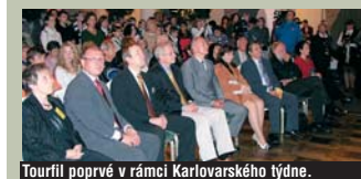
Tourfilm poprvé v rámci Karlovarského týdne.