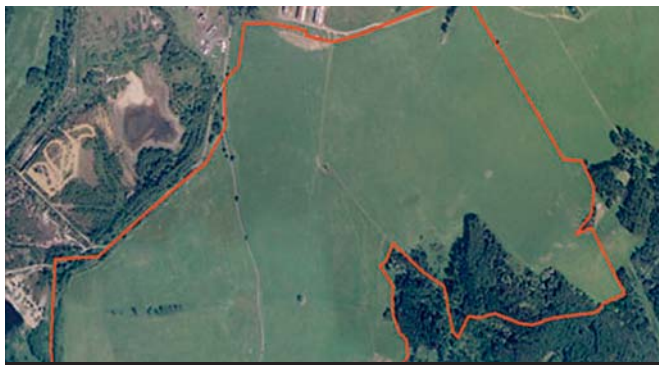
Lokalita golfového hřiště z ptáčích perspektivy.

Spolu se začátkem veletrhu v Mnichově byli spuštěny internetové stránky www.golf-devel.com , které budou určeny v první řadě investorům a developerům v oblasti golfu s nabídkami lokalit v Karlovarském kraji.