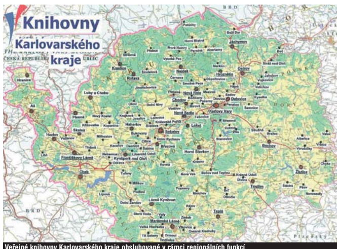
Veřejné knihovny Karlovarského kraje obsluhované v rámci regionálních funkcí