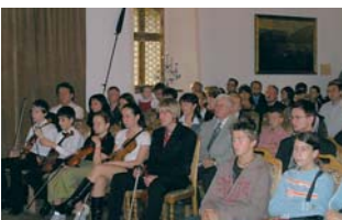
Akce se konala v Rytířském sálu hradu Loket.

S bohatým kulturním programem vystoupili žáci základních uměleckých škol z celého regionu. Slavnostní raut pro všechny přítomné připravili studenti Středního odborného učiliště Kynšperk. „Jsem si vědomi toho, že v našem kraji žije mnoho mladých lidí, jejichž činnost se neomezuje pouze na plnění školní docházky, dělají něco navíc, vzdělávají se, trénují, zdokonalují se a ve svých oborech jsou velmi úspěšní nejen v rámci republiky, ale i v Evropě a ve světě,“ říká radní kraje pro oblast školství Kamil Rezníček. „Vážíme si jich i učitelů, kteří studenty v jejich aktivitách