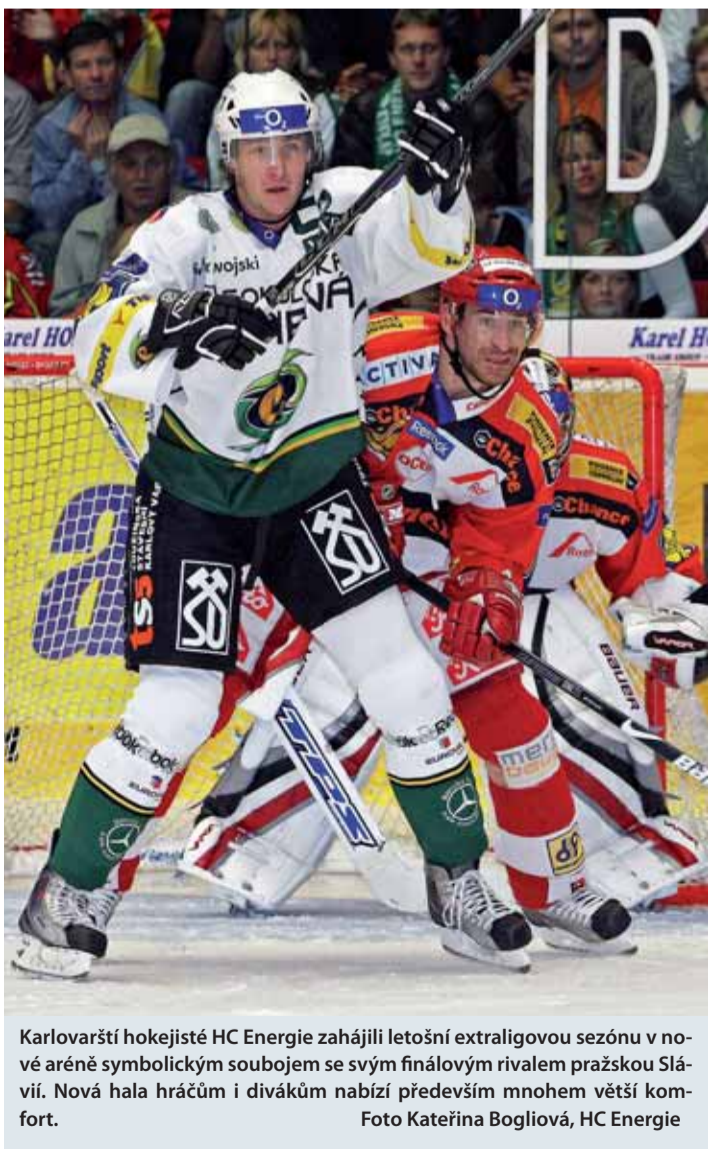
Karlovarští hokejisté HC Energie zahájili letošní extraligovou sezónu v nové aréně symbolickým souborem se svým finálovým rivalem pražskou Slávií. Nová hala hráčů i diváků nabízí především mnohem větší komfort.

„V současné době probíhají přípravy na vyhlášení výběrového řízení pro maturanty a nadcházející akademický rok. A pokud se tato spolupráce osvědčí, chtěli bychom tuto podporu rozšířit i do dalších oborů,“ dodává Čermák.