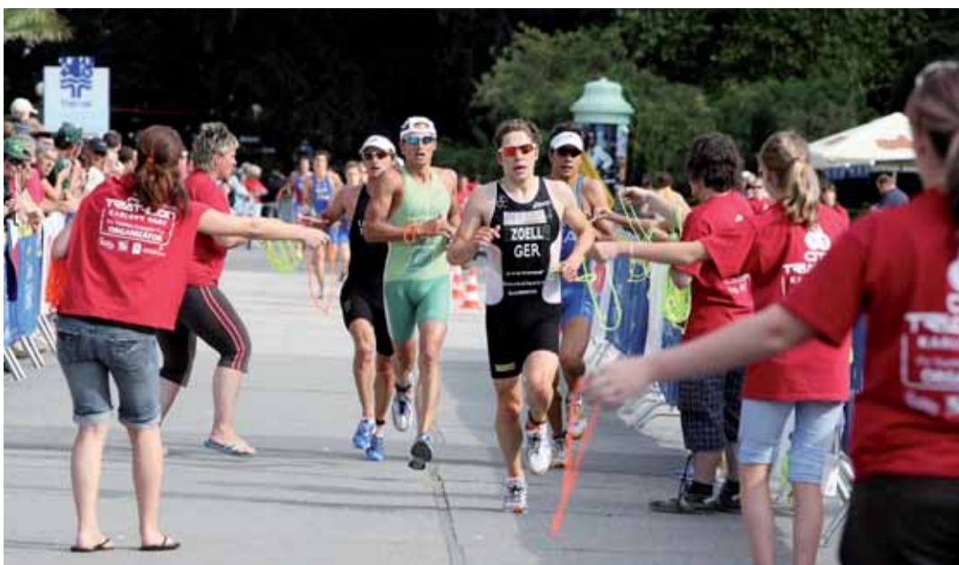
Karlovarský City Triatlon si na nezám diváků rozhodně stěžovat nemohl. Zájem byl značný. Na trati totiž nechýběla, vedle domácí špičky, ani evropská elita tohoto sportu.