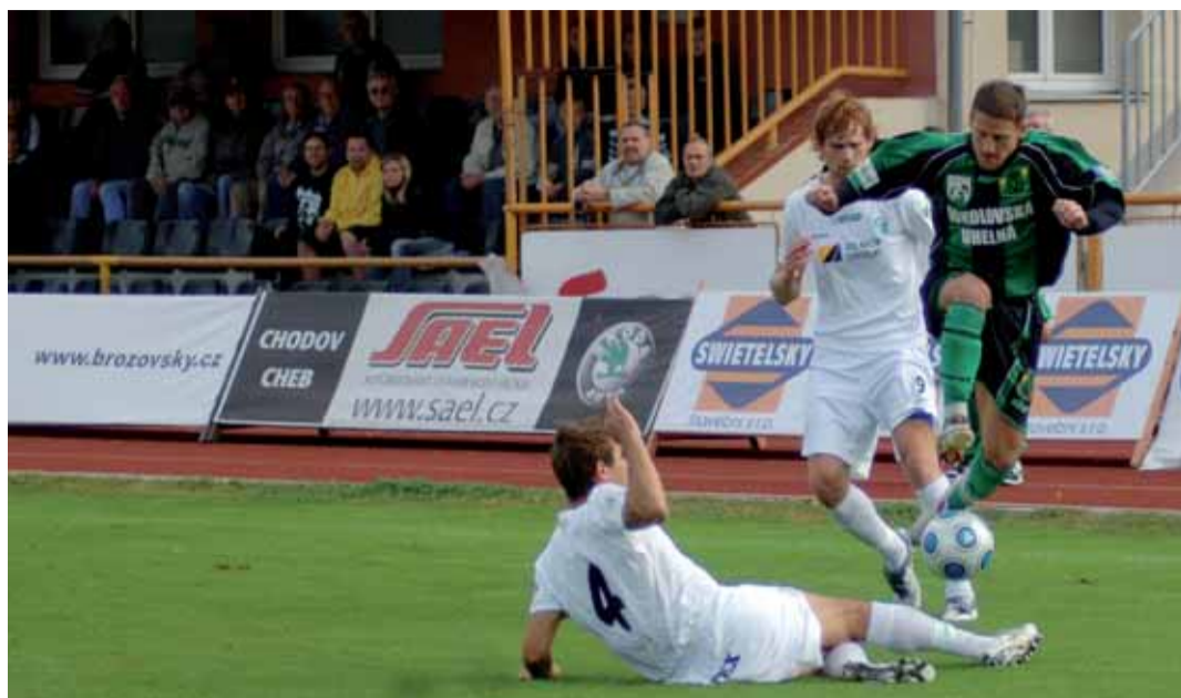
O body se naplno bojuje také v Sokolově. Právě tamní trávník je totiž domovským pro nejvýše postavený fotbalový klub v kraji, FC Baník Sokolov. Ten v současné době hraje druhou nejvyšší soutěž v zemi a v době uzávěrky listů byl na její druhé příčce.