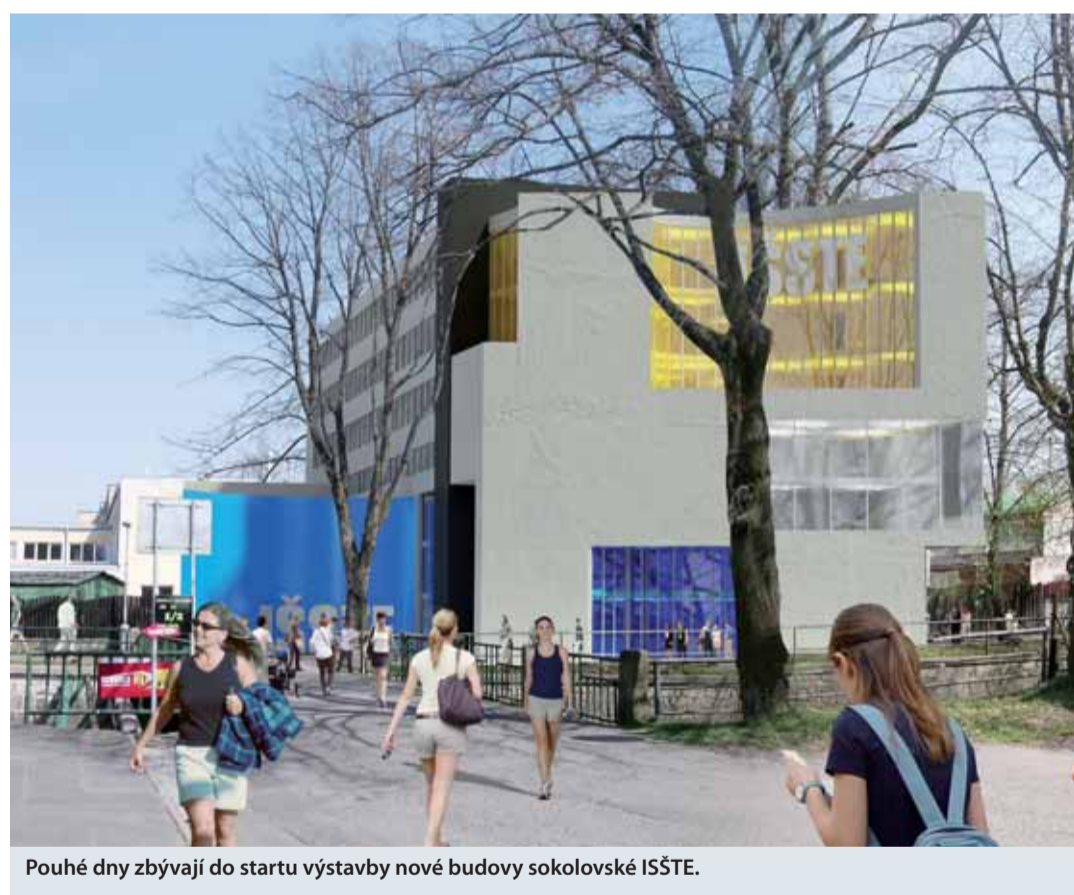
Pouhé dny zbývají do startu výstavby nové budovy sokolovské ISŠTE.