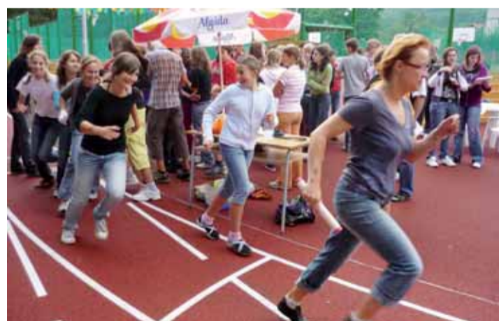
Hřiště zažilo křest při 5. ročníku takzvané Gymplštafety žáků i učitelů.

Výstřelem ze startovní pistole zahájil v pátek 4. září hejtmán Josef Novotný 5. ročník takzvané Gymplštafety učitelů i studentů Prvního českého gymnázia v Karlových Varech.