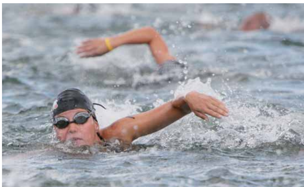
O tom, že triatlon patří ke sportům na vzestupu svědčila, vedle špičkově obsazeného City Triatlonu, také Velká cena Sokolova, která se konala na sokolovském koupališti Michal. Zatímco první z uvedených závodů byl doménou elity tohoto sportu, na startu sokolovského závodu domácí triatlonovou špičku doplnily také desítky amatérských závodníků z celého regionu. A mnozí z nich se ani vedle profesionálů rozhodně neměli za co stydět.