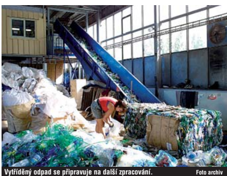
Vytríděný odpad se připravuje na další zpracování.

Pokračovat bude i úspěšná osvěta ke třídění odpadů na školách. „V souladu s mottem akce Školy odpadů v patach projekt umožní dětem navštívit a reálně se seznámit s celou řadou zařízení na třídění, zpracování a odstraňování odpadů,“ říká Luboš Orálek. Významná pro výchovu a osvětu ke třídění odpadů jsou i divadelní představení s motivem ekologického chování a komponované soutěžně zábavné pásmo Hrátky s Ba-