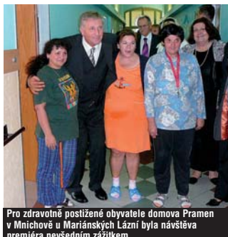
Pro zdravotně postižené obyvatele domova Pramen v Mnichově u Mariánských Lázní byla návštěva premiéra nevšedním zážitkem.

V nabitém programu pokračoval premiér Topolánek po návštěvě chebského gymnázia, kdy zamířil do studia rádia Egreensis a prostřednictvím živého vysílání diskutoval s posluchači. Dopravní spojení mezi Prahou a Chebem, vyvlastňování pozemků, systém udělování dotací i optimalizace lůžkového fondu chebské nemocnice, to byla témata, ke kterým se premiér Mirek Topolánek vyjadřoval. Během diskuse hovořil o nutnosti kvalitního silničního spojení mezi Prahou a Chebem. Rychlostní komunikace R6 by měla být podle Mirka Topolánka dokončena v roce 2013. „Chtěl bych, aby to šlo rychleji. Rádi bychom jezdili čtyřproudem do Německa v roce 2016,“ uvedl premiér. S rozsáhlou výstavbou souvisí i problematika získávání pozemků. V Karlovarském kraji stále není dořešena situace s pozemky v Kynšperku a Lokti. Premiér poukázal na složitost procesu výkupu pozemků. „U silnic sice existuje možnost vyvlastnění. To je ale silové řešení. Každá stavba