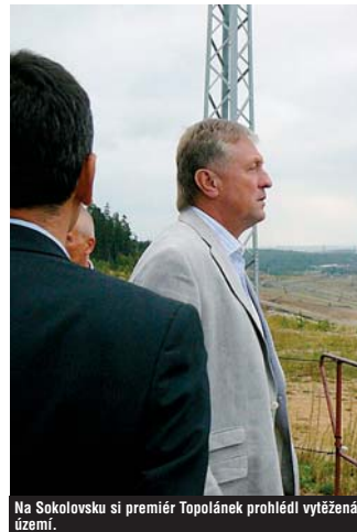
Na Sokolovsku si premiér Topolánek prohlédl vylázněné území.

Medard-Líbk, který právě prochází terénními úpravami. Další zastávkou byla vyhlídka na lom Jiří, kde zástupci těžební společnosti informovali