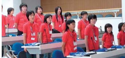
Mladí japonští zpěváci proměnili v koncertní síň jednací sál krajského zastupitelstva.

sál krajského zastupitelstva si poté odbyl premiéru jako koncertní síň, když v něm zazněl úryvek Smetanovy Mé vlasti i lidová píseň v česko-japonské úpravě. Japonští zpěváci převzali drobné dárky a pokračovali ve svém programu prohlídkou Karlových Varů a Lokte. Jejich pobyt v Karlovarském kraji vyvrcholil koncertem česko-japonského přátelství u ašské rozhledny. Koncertu „Háj v notách času“ se účastnil také smíšený pěvecký sbor Chorus Egrensis, dětský pěvecký sbor SASÁCI a také žesťový kvartet z Chebu.