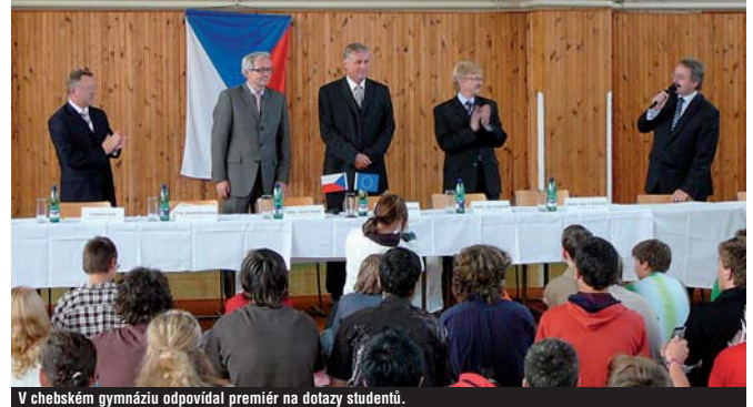
V chebském gymnáziu odpovídal premiér na dotazy studentů.

Druhý den své návštěvy zahájil premiér Mirek Topolánek v sídle společnosti Sokolovská uhelná, která je největším zaměstnavatelem v kraji. Jako těžební společnost se také nejvýraznějším způsobem podílí na formování krajiny v centrální části kraje. K premiérovi se připojil i ministr životního prostředí Martin Bursík. Tématem rozhovoru s vedením společnosti byla především obnova území dotčených hnědouhelnou těžbou. „Zaujala mě nejen rekultivace, ale také největší projekt v této oblasti, kterým je vytvoření jezera Medard.