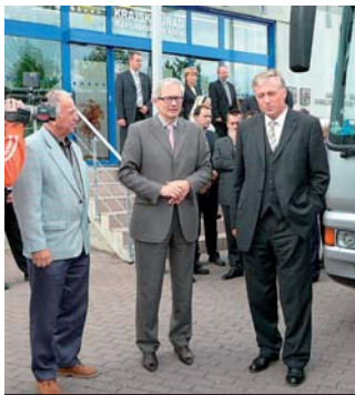
Mirek Topolánek navštívil v doprovodu hejtmana i sídlo Karlovarského kraje.

V nabitém programu pokračoval premiér Topolánek po návštěvě chebského gymnázia, kdy zamířil do studia rádia Egreensis a prostřednictvím živého vysílání diskutoval s posluchači. Dopravní spojení mezi Prahou a Chebem, vyvlastňování pozemků, systém udělování dotací i optimalizace lůžkového fondu chebské nemocnice, to byla témata, ke kterým se premiér Mirek Topolánek vyjadřoval. Během diskuse hovořil o nutnosti kvalitního silničního spojení mezi Prahou a Chebem. Rychlostní komunikace R6 by měla být podle Mirka Topolánka dokončena v roce 2013. „Chtěl bych, aby to šlo rychleji. Rádi bychom jezdili čtyřproudem do Německa v roce 2016,“ uvedl premiér. S rozsáhlou výstavbou souvisí i problematika získávání pozemků. V Karlovarském kraji stále není dořešena situace s pozemky v Kynšperku a Lokti. Premiér poukázal na složitost procesu výkupu pozemků. „U silnic sice existuje možnost vyvlastnění. To je ale silové řešení. Každá stavba