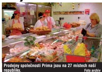
Prodejny společnosti Prima jsou na 27 místech naší republiky.

Stávající obchod s přírodními střívy se rozšířil o zpracování a prodej uzenin i masných výrobků. V současné době činí výroba cca 6 tun masných výrobků denně. Za účelem zvýšení výrobních kapacit si firma v roce 2000 zprvu pronajala a posléze i zakoupila bývalou výrobu masa v Karlových Varech Růžovém Vrchu. Rovněž tento objekt prošel důkladnou rekonstrukcí a jeho provoz nyní odpovídá přísným normám EU. Denní produkce se pohybuje kolem 9 tun masa. Prima Karlovy Vary je garantem kvalitní výroby a celá její produkce je pod stálou veterinární kontrolou. Výrobní uzenin a boudárna ma-