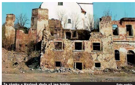
Ze zámku v Hazlově zbyly už jen trosky.