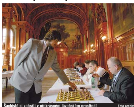
Šachisté si zahráli v překrásném lázeňském prostředí.

Y Oslavu a připomínku jubilea 100 let od konání prvního mezinárodního šachového turnaje v českých zemích, který se hrál v srpnu a září 1907 v Karlových Varech, je turnaj Czech Coal Carlsbad Chess Tournament 2007, který se uskutečnil v karlovarském Grandhotelu Pupp.