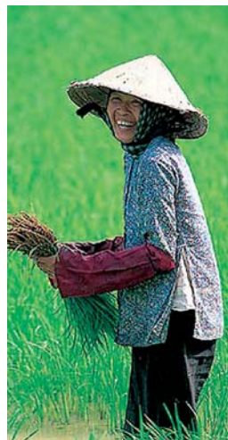
Do naší republiky míří stále častěji i Vietnamci, žijící až doposud na chudém venkově.

Občanství uděluje Ministerstvo vnitra ČR, jež žadateli vydá Listinu o udělení státního občanství ČR. Žádost lze podat u příslušného úřadu (matrika) dle místa svého bydliště. Podání žádosti je podmíněno doložením nepřetržitě pětiletým pobytům na území našeho státu, pohořem se žadatelem, prokázáním znalosti českého jazyka, stanovisky policie, obecního a finančního úřadu, výpisem z rejstříku trestů, rodným listem, dokladem o požití dosavadního občanství a životopisem. To však nepla-