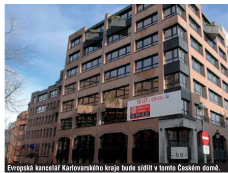
Evropská kancelář Karlovarského kraje bude sídlit v tomto Českém domě. (BEN)