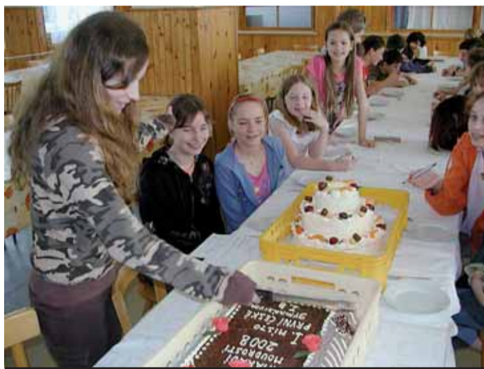
K titulu Kamarádi moudrosti dostali vítězové také dorty, které snědli ještě během slavnostního vyhlášení výsledků. (KK)

Letošní ročník byl ve znamení 650. výročí založení Karlových Varů, otázky byly zaměřeny na zvyky, tradice a kulturu jiných národů (Rusové, Němci, Slovinci, Maďaři, Vietnamci, Ukrajinci, Židé), které kdy žily nebo stále žijí v Karlových Varech, na slavné osobnosti, mezinárodní akce