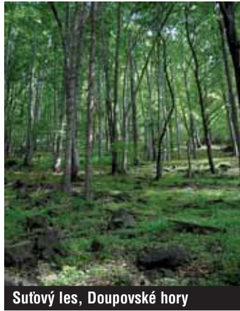
Suťový les, Doupské hory