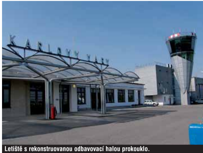
Letiště s rekonstruovanou odbavovací halou prokouklo.

jících vedla za loňský rok Moskva s 43 078 turisty, dále Petrohrad (4058) a za ním dovolenkové destinace Tunisko (3461), Turecko (1825) a Řecko (1278 odbavených cestujících). Celkem letiště odbavilo 60 455 cestujících. Rekonstrukce letiště ale neskončila. Letos v únoru začala stavba nové haly za 91,8 milionu korun. Karlovarský kraj očekává z Regionálního operačního programu NUTS II Severozápad dotaci až 85 procent z nákladů. Kolem 7,5