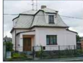
Rozdíl mezi nevyčištěnou a vyčištěnou střechou je znát na první pohled