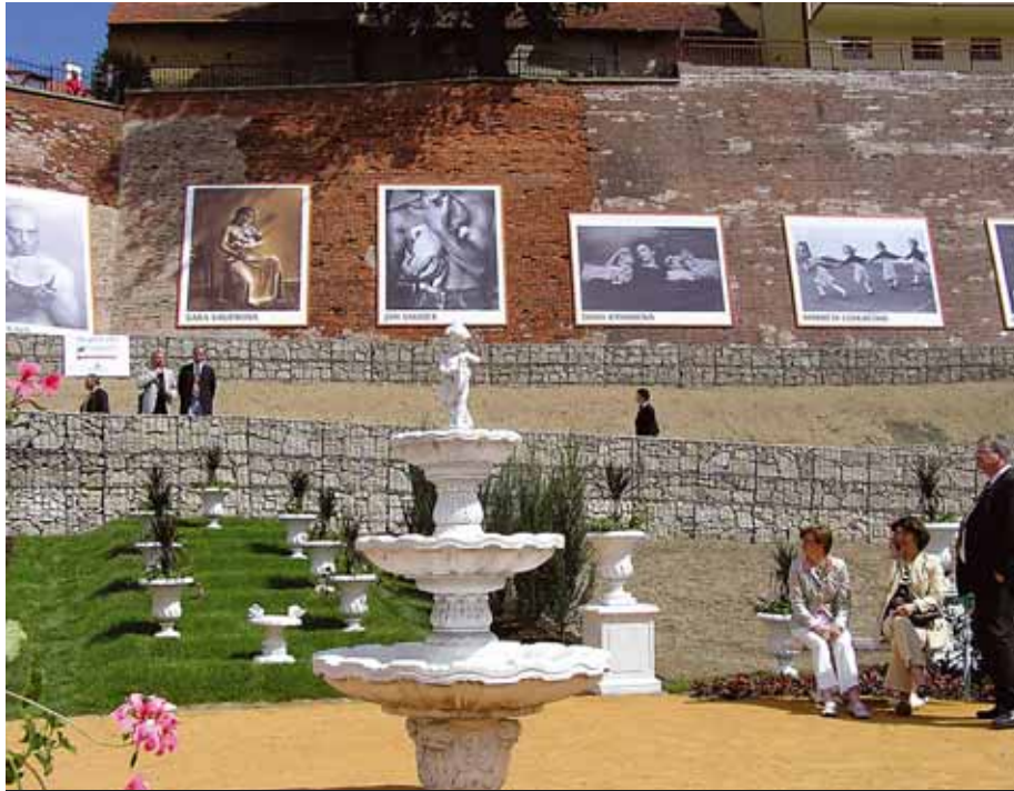
Stěny hradních šancí v Chebu ozdobily umělecké fotografie.