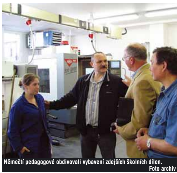
Němečtí pedagogové obdivovali vybavení zdejších školních dílen.

„V květnu zavítali zástupci německé strany do naší školy a tamní pedagogové obdivovali nadstandardní vybavení našich