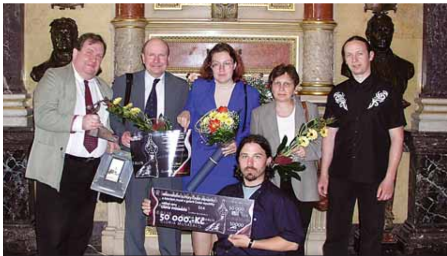
Tým lidí, kteří se podíleli na publikaci Zaniklé obce na Sokolovsku, měl z ocenění i šeku radost.

Krajské muzeum Sokolov přihlásilo do soutěže celkem tři projekty – výstavu Hoří, hoří, hoří, knihu Johann David Adler von