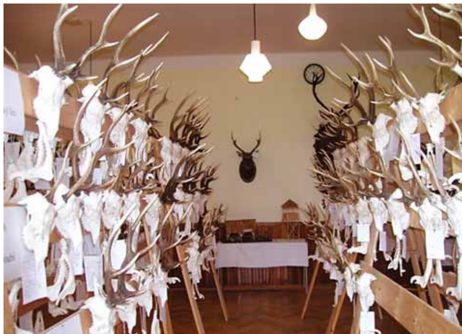
Chovatelská přehlídka nabídla návštěvníkům 700 trofejí z loňské lovecké sezony.