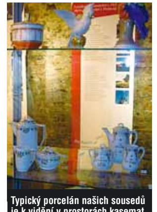
Typický porcelán našich sousedů je k vidění v prostorách kasemat Chebského hradu.