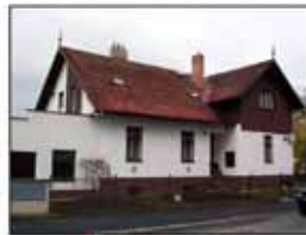
↑ PŘEDAPO ↓

Možná to znáte... Vaše střecha je sice funkční, ale její špinavý a často i mechový vzhled kazí celkový dojem Vašeho domu. Možná chybí i nějaká taška, šablona či hřebenač, nebo třeba jen zatéká okolo komína. A přesto!!! Měnit takovou střechu za novou je mnohdy zbytečně velká investice. Za zlomek ceny nové střechy lze totiž Vaši starou střechu snadno vyčistit od mechů, lišejníků a ostatních nečistot. Po očištění se opravují případné závady a zatékání. Střecha se následně ošetří bezbarvou chemickou ochranou nebo barevným nástřikem, který můžete vybírat z mnoha odstínů. Takto ochráněná a zrenovovaná střecha je pak znovu nejen velmi pěkná, ale je i výrazně prodloužena její životnost. Tyto práce se provádějí ze speciálních pracovních plošin. Při každé takové zakázce se zdarma provádějí i již zmíněné drobné opravy a výměny prasklých či chybějících šablon, tašek a hřebenačů, nebo čištění okapů atp. Vyčištění a chemická ochrana střech se u běžné velkých domů pohybuje okolo 13 000 Kč. V případě barevného nástřiku se ceny pohybují okolo 35 000 Kč.