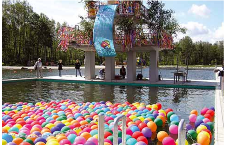
Starostka Marktredwitz si pro svůj projev vybrala skokanský můstek u revitalizovaného koupaliště, kde se přitékající voda čistí přírodní cestou.

Karlovarský kraj představuje zájemcům rekonstrukci letiště v Karlových Varech a činnost nově vybudované Krajské knihovny. Expozice tak má prohloubit znalosti o obou přeshraničních regionech. Návštěvníci si ji budou moci prohlédnout do 24. září 2006. (HAD)