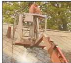
Čištění špinavé a zarostlé střechy

...chemickou ochranu střechy po několika letech pravidelně obnovovat. Obnovení je časově nenáročné a stojí jen kolem 1500Kč. Tento nový typ chemie si již dovede poradit i s nově vyrůstajícími mechy. Součástí nového nástřiku chemické ochrany je navíc i kontrola střechy a případná bezplatná drobná oprava prasklých či vypadlých tašek, šablon, hřebenačů nebo zatékání. Tímto způsobem lze střechu udržet po celou dobu její životnosti pěknou a navíc už nikdy nebudete mít problém s fesmesníka na drobnou, ale nepříjemnou opravu zatékání. Dříve čištěné střechy, ošetřené starým typem impregnace a nebo nenaimpregnované vůbec a které jsou již zčernalé, je možné nenáročně chemicky očistit za cenu kolem 2000 Kč.