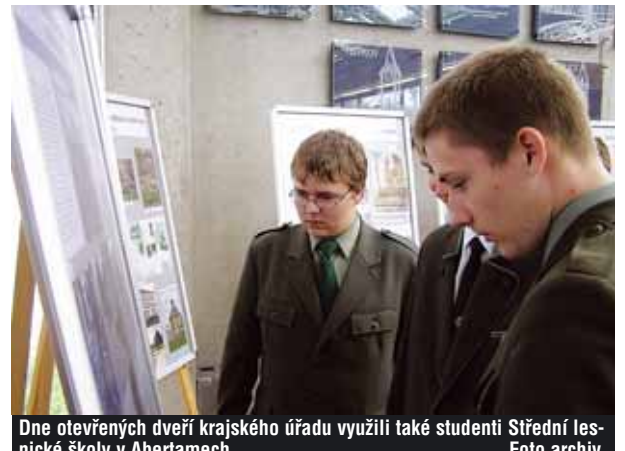
Dne otevřených dveří krajského úřadu využili také studenti Střední lesnické školy v Abertamech.

„Studenty zajímaly především investice do středních škol, důvody jejich sloučení i názor hejtmána na státní maturitu. Jejich otázky se týkaly i nároků na funkci hejtmána a časové vytíženosti. Snažili jsme se ukázat veřejnosti, že kraje a krajské úřady jsou moderními institucemi, které usilují o co největší vstřícnost a otevřenost vůči občanům,“ říká R. Rokůsek. (LAM)