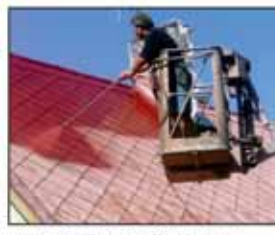
I starší taškové a eternitové střechy lze po očištění ochránit chemicky nebo nástřikat speciální barvou