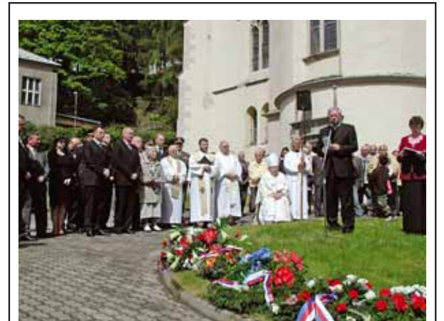
Pietního aktu se zúčastnilo mnoho pamětníků a hostů.

Kontakt: Krajský inspektorát Karlovy Vary, Krušnohorská 7, Karlovy Vary. (HAD)