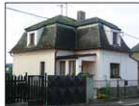
↑ PŘEDAPO ↓