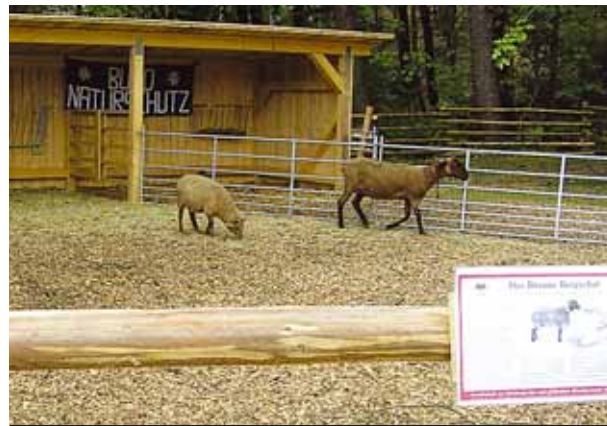
Součástí Krajinné výstavy v Marktredwitz jsou i živá zvířata.