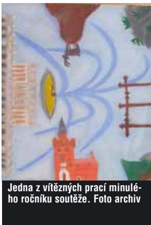
Jedna z vítězných prací minulého ročníku soutěže.