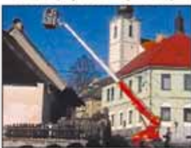
Pracujeme ve výšce až 30 metrů