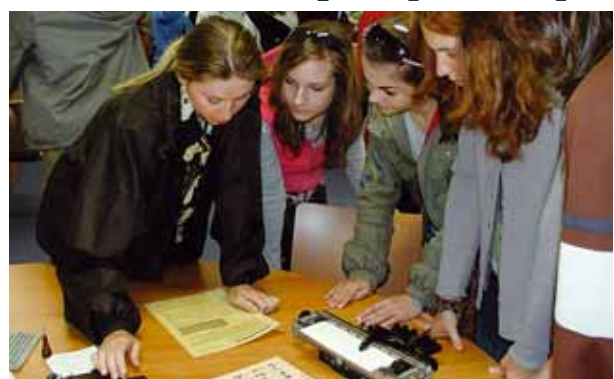
Návštěvníky překvapil vzhled knih pro nevidomé psané Braillovým písmem.

Jak se žije nevidomým, si v posledním květnovém týdnu vyzkoušeli žáci i studenti škol v Karlovarském kraji a také řada občanů. Akce, pořádaná ve spolupráci kraje s organizacemi pro nevidomé v Krajské knihovně v Karlových Varech, měla značný úspěch. Řada návštěvníků si totiž teprve po procházce se zakrytými očima a slepečkou holí v ruce dokázala představit, jak se asi nevidomí cítí v cizím prostředí a jak mohou předměty poznávat pouze hmatem. „V oddělení pro nevidomé si přichází prohlíželi a ohmatávali hmatovou sbírku přírodnin a střídali ze zvukové pistole na terč. Návštěvníci akce se seznámili s Braillovým