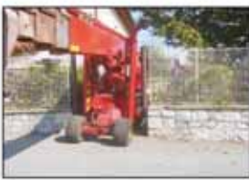
Plošiny se snadno pohybují okolo domů a projedou i malými vrátky