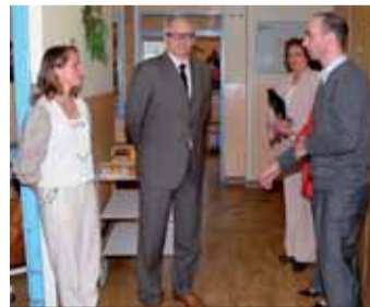
Domov pro osoby se zdravotním postižením v Mariánské pečuje o dvě stovky klientů a je největším zařízením svého druhu v Karlovarském kraji.