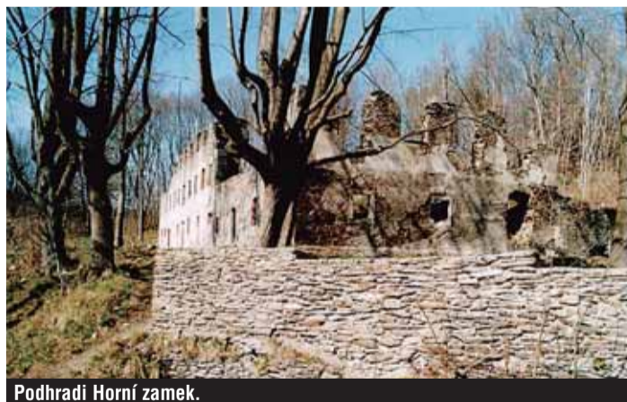
Podhradí Horní zámek.

Z Krásné pak sjedeme dolů na silnici do Podhradí a pokračujeme po ní vlevo k následující křižovatce, kde je rozcestí s cyklotrasou 2057 (Hranice–Cheb). Pokračujeme do samoty Marak, která nese jméno po zaniklé barvírně látek Marack. Na konci samoty, vlevo, asi 30 m od silnice byl v roce 1290 zasazen kamenný kříž při vymezení hranice nové zřízené farnosti Aš. Je to nejstarší známý smírčí kříž na Ašsku a byl tu usazen Heinrichem z Plavna. Po silnici dojedeme do Podhradí, historicky nejstarší obce v Aš-