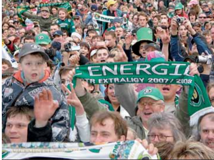
Pro nás jste mistři! Znělo nadšeným davem u Thermalu, když se vyvolávala jména hokejových vicemistrů.

Historicky to byl největší hokejový úspěch karlovarských hokejistů. Nejen od roku 1997, odkdy je karlovarský hokejový klub pravidelným účastníkem extraligy, ale vlastně od roku 1932, co se vůbec hokej v Karlových Varech hraje. V posledních sezonách od roku 1991 v barvách hlavního sponzora jako HC Becherovka