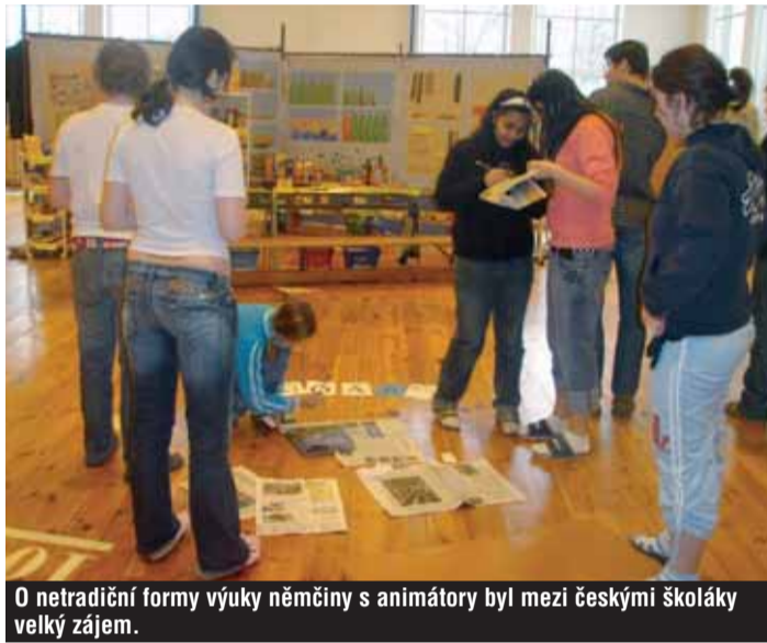
O netradiční formy výuky němčiny s animátory byl mezi českými školáky velký zájem.