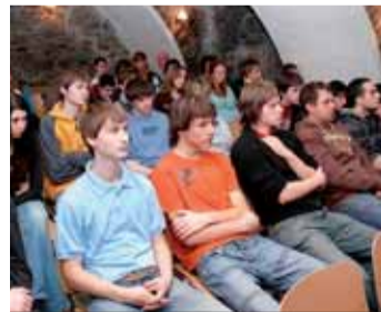
Plány o investicích do mikroregionu Podkrušnohoří vyslechl studenti ostrovské průmyslovky se zájmem. Většina z nich chce v regionu žít a pracovat.

V rámci cest po mikroregionech navštívil hejtmán Josef Pavel oblast Podkrušnohoří. Cestu zahájil setkáním se studenty SPŠ Ostrov, s nimiž diskutoval o jejich budoucím uplatnění, plánovaném Centru technického vzdělávání v Ostrově, ale také o rekonstrukcích krajských silnic a o termínu dokončení rychlostní komunikace R6 v kraji. „V tomto roce budou v kraji zahájeny dvě etapy Nové Sedlo-Sokolov a Sokolov-Tišová, přičemž v regionu by měla být tato rychlostní komunikace zprůjezdněna v roce 2010,“ upřesnil hejtmán. Nadpoloviční většina studentů ostrovské průmyslovky by prý chtěla zůstat u technických profesí, na než se v současnosti připravují. Ředitel školy Pavel Žemlička zmínil i problém budoucího úbytku žáků, který si vyžádá další změny ve struktuře oborů a škol. „Demografická křivka je jasná, podle předpokladů bude za dva roky o 400 žáků