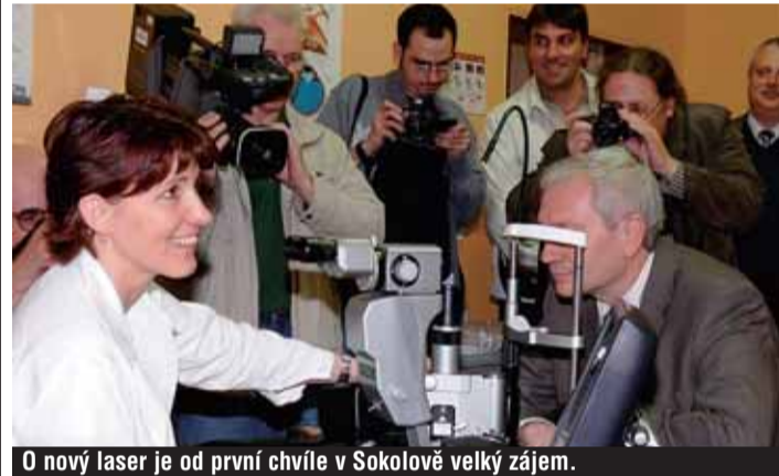
O nový laser je od první chvíle v Sokolově velký zájem.

Sítnicovým laserem nejnovější generace disponuje nyní oční oddělení sokolovské nemocnice. Dosud měla Česká republika pouze jeden přístroj tohoto typu v Ostravě. Nemocným z Karlovarského kraje se tak dostane nejmodernější lékařské péče. Moderní vybavení dostala rovněž jednotka intenzivní péče a iktová jednotka na neurologickém oddělení nemocnice v Sokolově. Podle hejtmana Josefa Pavla jsou novinky v Sokolově v souladu s dlouhodobou koncepcí krajské nemocnice. „Chceme ušetřit na zefektivnění administrativy, nákupu materiálu a služeb. Na čem ale šetřit nechceme, jsou mzdy a přístrojové vybavení,“ uvedl hejtman. Letos kraj přispěje krajské nemocnici na nákup přístrojů 30 miliony korun.