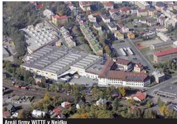
Areál firmy WITTE v Nejdku