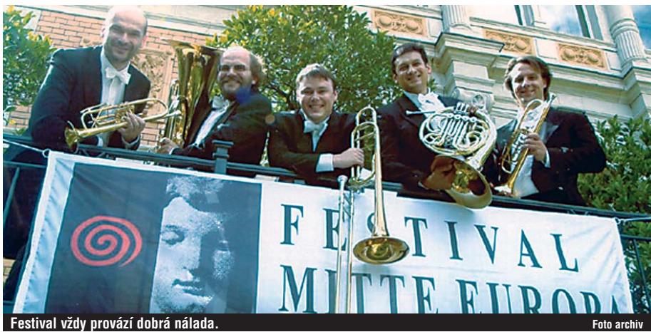
Festival vždy provází dobrá nálada.