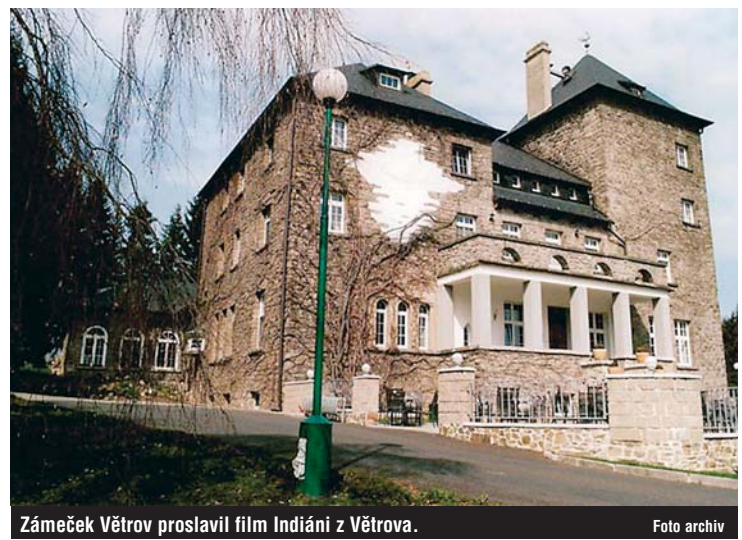
Zámek Větrov proslavil film Indiáni z Větrova.

Markéty Zinnerové zde byl natočen film Indiáni z Větrova. Vrátime se zpět na silnici, projedeme křižovátku na Podhradí, kde je zároveň rozcestí s CT 2059, a za chvíli už přijíždíme do Aše na Goethovo náměstí. Z Aše pokračujeme po značené trase do Mokřin (Nassengrub). Nejhodnotnější stavbou v Mokřinách je kostel postavený v roce 1913. Trasa nás dále zavede do Nebes, přesněji do obce Nebesa (Himmelreich), s oblíbeným hostincem. Potom pokračujeme do Výchledů, kde si můžeme prohlédnout boží muka z roku 1830 s motivem Nejsvětější Trojice, a pokračujeme do obce Skalka. Zde je rozcestí s CT 2064 (do Táborské), restaurace Elster a vedle ní zajímavý pomník padlým v 1. sv. válce se sochou orla. Ve Skalce můžeme zase odbočit z trasy a podívat se na chráněné Goethovy skály. Vede tam modrá turistická značka, ale 2,5 km dlouhá cesta ke skalám je vhodná jen pro MTB. Ti, kdo terén nemusí, mohou popojet až na křižovátku s hlavní silnicí, odbočit vpravo po hlavní na Aš a asi po 800 m si mohou alespoň prohlédnout u silnice Goethův kámen s pamětní deskou.