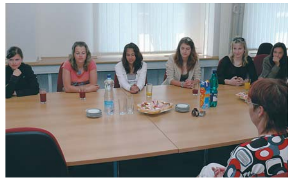
Týmu mladých házenkářek se dostalo uznání za reprezentaci kraje.