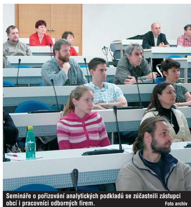
Semináře o pořizování analytických podkladů se zúčastnili zástupci obcí i pracovníci odborných firem.

Zástupcům sedmi obcí s rozšířenou působností Karlovarského kraje byl určen seminář týkající se územně analytických podkladů pořádaný odborem regionálního rozvoje Krajského úřadu Karlovarského kraje. Na zmíněné obce padla od 1. ledna 2007 nová náročná povinnost pořizovat územně analytické podklady, vyplývající z nového stavebního zákona 183/2006 Sb., o územním plánování a stavebním řádu, a prováděcí vyhlášky 500/2006 Sb., o územně