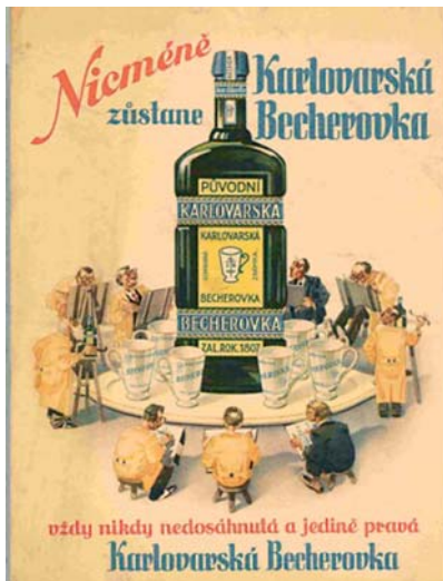
Slavná becherovka v dobových reklamách

A jaká tedy vlastně je 200 let trvající existence becherovky? Slavný bylinný likér byl vynalezen v roce 1807 rodinou Becherů v Karlových Varech. Původně se prodával jako žaludeční kapky na zažívání v malých skleněných lahvičkách. Vzhledem k jejich lahodné chuti ale řada pacientů porušovala předepsané dávkování a postupně vytvářela tradici becherovky jako aperitivu. Rostoucí obliba a poptávka po becherovce si vynutila stále větší balení a becherovka začala pronikat do gastronomie i domácností. Dnes lze becherovku koupit v celé řadě velikostí. Od malické sběratelské 5cl lahvičky přes