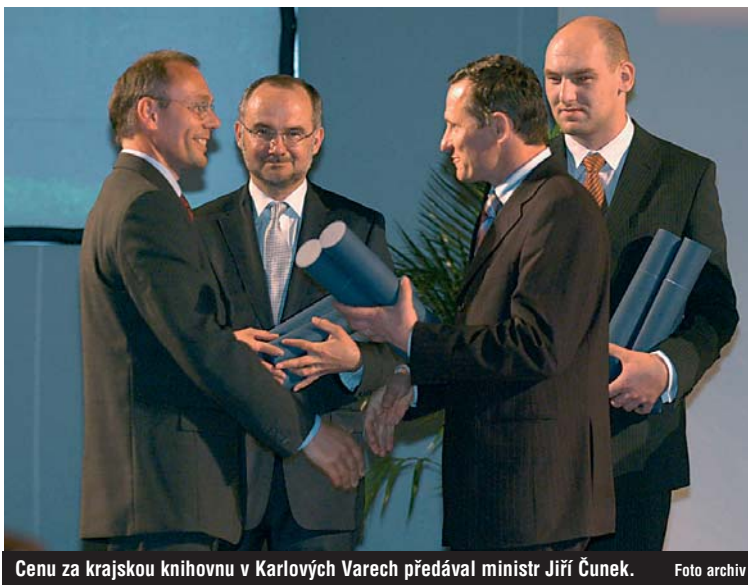
Cenu za krajskou knihovnu v Karlových Varech předával ministr Jiří Čunek.

Čestné uznání za Nejlepší investici roku v celorepublikové soutěži Top Invest získala v rámci Stavebního veletrhu v Brně stavba krajské knihovny v Karlových Varech. Tato cena je každoročně udělována na třech stavbách. Ty vybírá odborná porota z širokého spektra stavebních akcí realizovaných v celé České republice s důrazem na hodnocení kvality záměru a jeho provedení. Vyhláшателеm soutěže je Ministerstvo průmyslu a obchodu České republiky, Ministerstvo pro místní rozvoj České republiky a Svaz podnikatelů ve stavebnictví České republiky. Cenu za krajskou knihovnu převzal z rukou ministra pro místní rozvoj Jiřího Čunka v zastoupení hejtmana kraje Radek Havlan, vedoucí odboru investic a grantových schémat Krajského úřadu Karlovarského kraje.