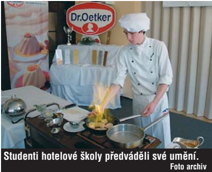
Studenti hotelové školy předváděli své umění.

Velmi úspěšná byla i prezentační akce Hotelové školy ve společenském domu Casino. Největší gastronomickou přehlídkou žáků odborné školy v republice navštívilo více než tisíc hostů. Zastoupeny byly obory hotelnictví a turismus, kuchař, číšník, obchodník a krejčov.