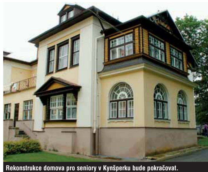
Rekonstrukce domova pro seniory v Kynšperku bude pokračovat.

Novým projektem, na jehož realizaci by chtěl kraj získat další evropské finance, je plán přeměny dvou pobytových zařízení pro osoby se zdravotním postižením na místo, kde budou moci žít v přirozeném prostředí, podobném životu jejich vrstevníků, a se zájemem pro podporu jejich individuálních schopností. Součástí projektu je také přemístění mentálně postižených obyvatel z ústavů do chráněného bydlení s využitím například služeb osobní asistence tak, aby se mohli začlenit do běžného života za branami ústavu. „Jedná se pochopitelně o ty osoby, které jsou schopny žít mimo ústav a samozřejmě mimo něj žít chtějí,“ uvedla Ellen Volavková s tím, že pro některé obyvatele ústavů se toto zařízení stalo oázou bezpečí a jeho opuštění by bylo příliš traumatizujícím