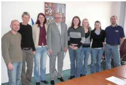
Do závěrečných bojů play-off popřál hejtmán basketbalistkám hodně sportovního štěstí a úspěchů. Na některý zápas je přijde určitě povzbudit.