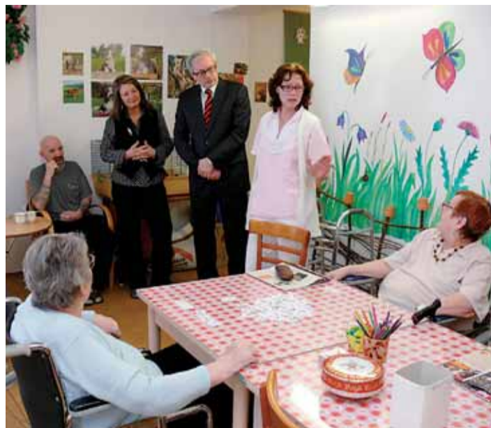
Domov se zvláštním režimem Matyáš si pochvalovali hejtmánovi kraje senioři v Nejdku.