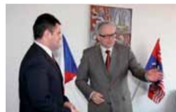
Rumunští diplomaté sondažovali v Karlovarském kraji půdu, aby po nich mohli přijet s konkrétními návrhy spolupráce zástupci firem.