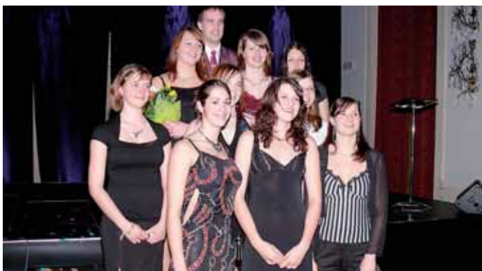
Oceněny v kategorii Žáci – sportovní kolektiv: Volejbalový klub K. Vary.