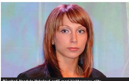
Půvabná Vendula Vokalová patří mezi kickboxovou elitu.