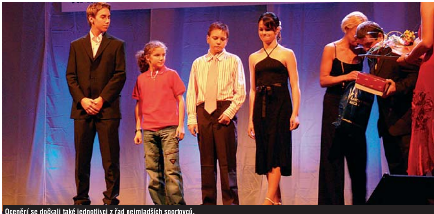
Ocenění se dočkali také jednotlivci z řad nejmladších sportovců.