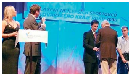
Nezapomnělo se ani na trenéry kickboxu a šermu.