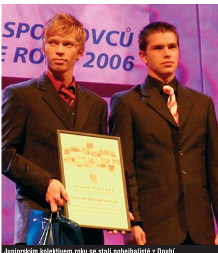
Juniorským kolektivem roku se stali nohebalisté z Doubí.