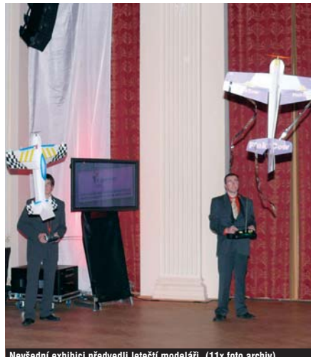
Nevšední exhibiči předvedli letečtí modelářů.