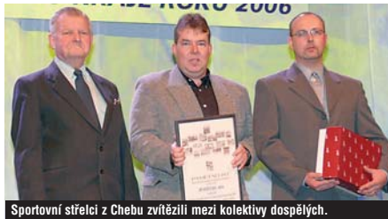
Sportovní střelci z Chebu zvítězili mezi kolektivy dospělých.