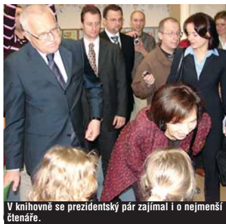
V knihovně se prezidentský pár zajímal i o nejmenší čtenáře.

Druhý den návštěvy se manželé Klausovi setkali s občany na Poštovním náměstí v Aši a navštívili