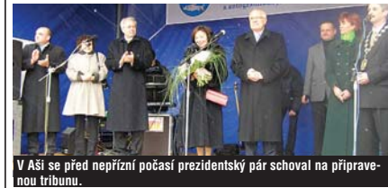
V Aši se před nepříznivým počasím prezidentský pár schoval na přípravnou tribunu.