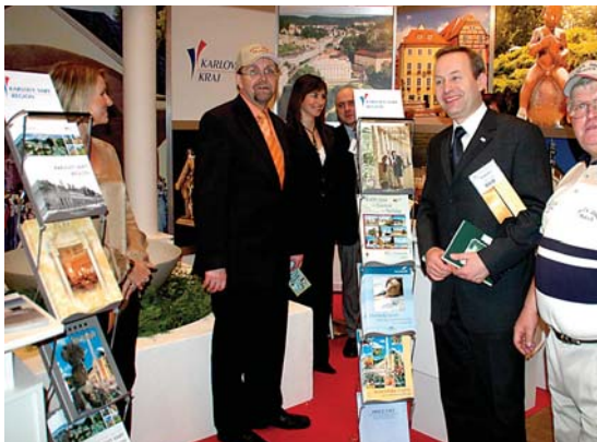
Stánek Karlovarského kraje navštívil ministr pro místní rozvoj Radko Maršínek (vlevo).