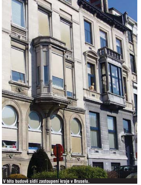
V této budově sídlí zastoupení kraje v Bruselu.