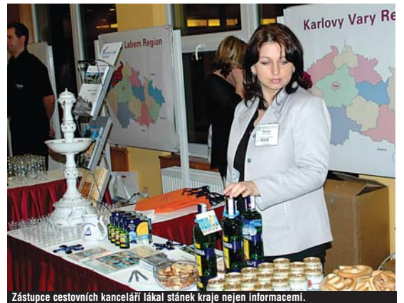
Zástupce cestovních kanceláří lákal stánek kraje nejen informacemi.

Porcelánová fontánka, z níž místo pramenité vody tryskal známý bylinný likér, lákala zástupce zámožných cestovních kanceláří do výstavního stánku Karlovarského kraje. Ten se na tradičně prezentoval především kvalitním lázeňstvím na konferenci Sdružení amerických cestovních kan-