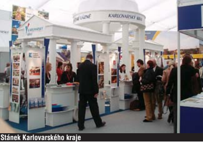
Stánek Karlovarského kraje