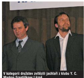
V kategorii družstev zvířezili jachtaři z klubu Y. C. Markop Františkovy Lázně.