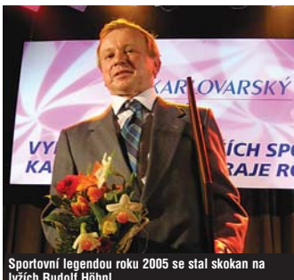
Sportovní legendou roku 2005 se stal skokan na lyžích Rudolf Höhn.