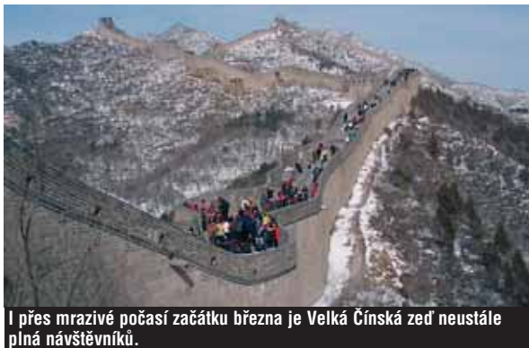
I přes mrazivé počasí začátku března je Velká Čínská zeď neustále plná návštěvníků.