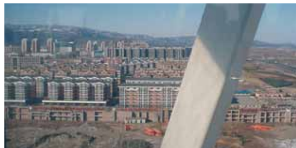
Peking zažívá neskutečný stavební boom. Staví se celé čtvrtě, některé z nich budou dočasným domovem pro návštěvníky příštích olympijských her.