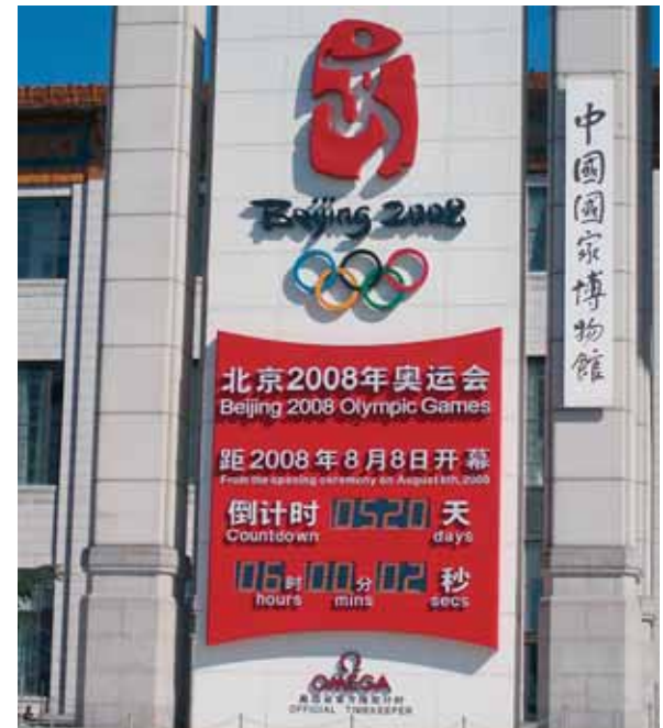
Tato časomíra v Pekingu již odpočítává dny, minuty a vteřiny do začátku Olympijských her v příštím roce.