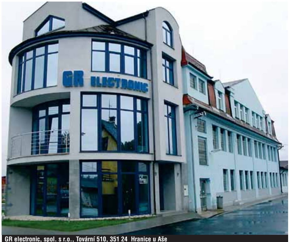
GR electronic, spol. s r. o., Tovární 510, 351 24 Hranice u Aše