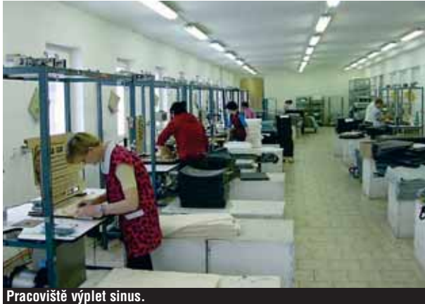
Pracoviště výplet sinus.

Firma svoji činnost začínala se 17 zaměstnanci. V červnu 2004 bylo již v podniku zaměstnáno 450 lidí, z toho 25 přímo v logistice. Dnes je ve firmě zaměstnáno 800 lidí. Vzhledem k dynamickému vývoji automobilového průmyslu byla firma nucena otevřít novou pobočku nedaleko Tábora v obci Bechyně. V současné době je v této pobočce 70 pracovníků a do budoucna se plánuje