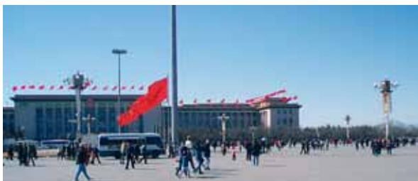
Asi nejznámějším místem nejen Pekingu, ale celé Číny je náměstí Nebeského klidu.