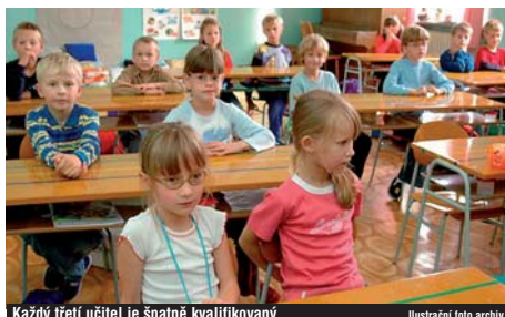
Každý třetí učitel je špatně kvalifikovaný.

Větší pozornost hodlá kraj věnovat provázanosti jednotlivých stupňů vzdělávání od předškolních zařízení po střední a vysoké školy. „Rádi bychom obnovili každoroční porady s řediteli základních škol, na nichž by se mohla řešit problematika příjmových výdajů, změn školské legislativy nebo spolupráce s místními samosprávami,“ vysvětlil Emler. Školám i obcím je na vyžádání poskytována metodická a odborná pomoc krajského úřadu zejména v otázkách vzdělávání, dále v oblasti pracovně-