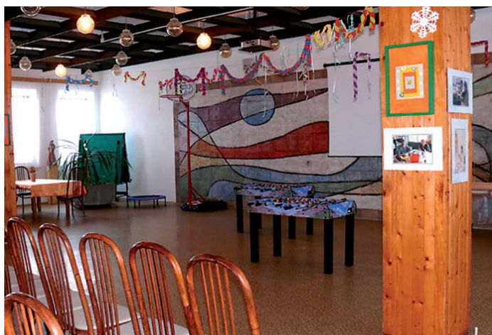
Vybavení kavárny domova v Mariánské přišlo díky značnému podílu svépomoci na pouhých 70 tisíc korun.

Kavárna a čajovna Sluníčko s knihovnou má být místem společných setkání a aktivit klientů Domova pro osoby se zdravotním postižením v Mariánské s jejich přáteli. Obyvatelé domova mohou v kavárně posedět nad šálkem čaje nebo kávy a zapojit se do programu, v němž nechybí společenské hry, stolní tenis, badminton, ale i tanec nebo arteterapie.