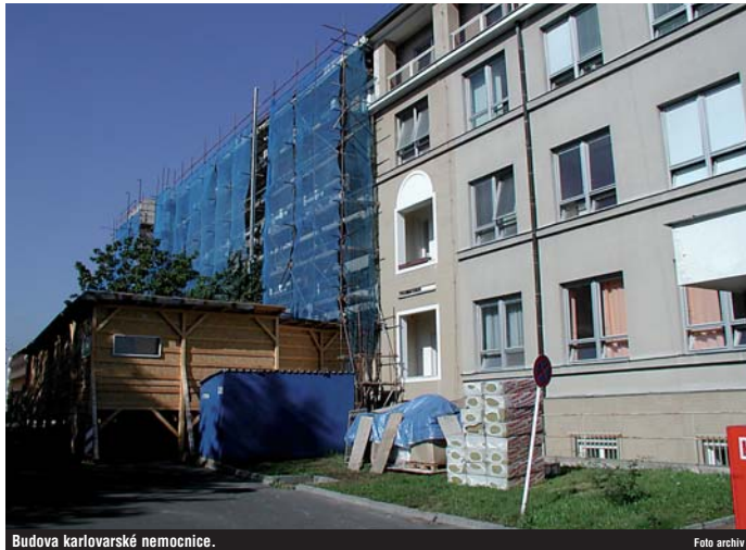
Budova karlovarské nemocnice.

Restrukturalizace by měla spočívat především ve zvýšení efektivity, tedy aby byla krajská nemocnice schopna s menším počtem pracovníků a materiálových nákladů vykonat stejné množství práce. Například při dlouhodobě nedostatečném využití kapacity dvou stanic by mělo dojít k jejich sloučení do jedné. „V žádném případě nejde o snížení objemu a kvality poskytované péče, ale spíše zredukování celkové kapacity nemocnice, což