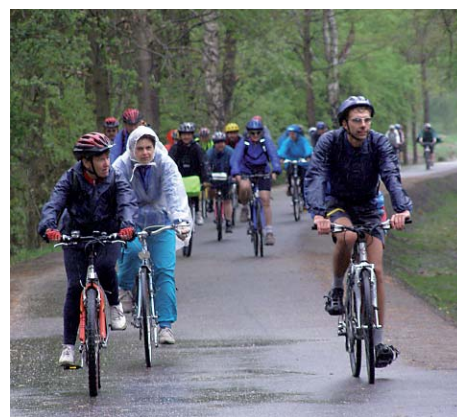
Karlovarský kraj na rozvoji cykloturistiky již tradičně dbá.