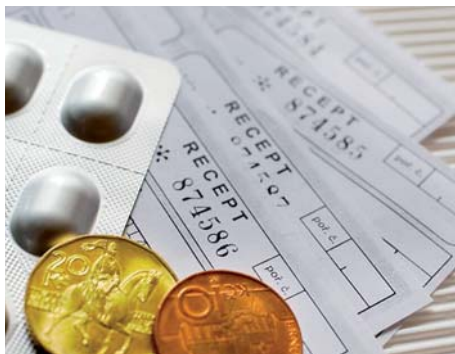
Od začátku února nabízí Karlovarský kraj svým občanům náhrady za regulační poplatky ve svých zdravotnických zařízeních.

K pokrytí výdajů na úhradu poplatků kraj využije 30 milionů