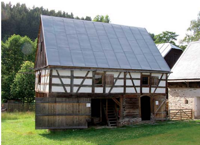
Hrázděná stavení patří k cenným ukázkám venkovské architektury.