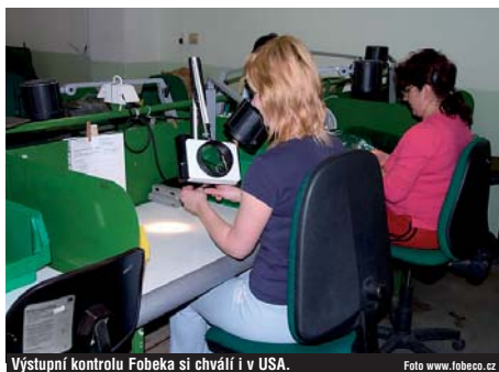
Výstupní kontrolu Fobeka si chválí i v USA.