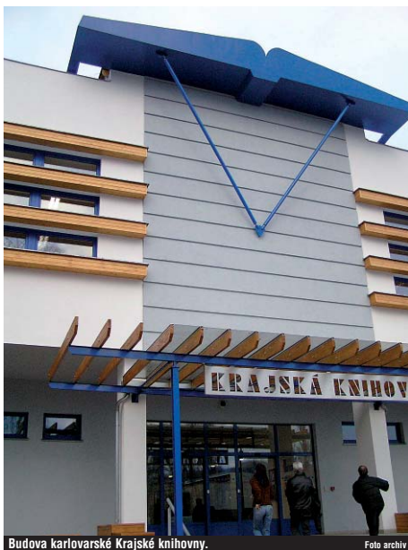
Budova karlovarské Krajské knihovny.

A-klub Dvory 5., 12., 19., 26. 3. Her-ní klub – Pro zájemce o hraní strategických, logických a společenských a deskových, od 15:00 her. Chytrá zábava pro každého