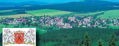
Krušnohorské Abertamy (logo z roku 1579).

Z čeho vznikl název Abertamy (v němčině nejčastěji Abertam), je dodnes nejasné. Pověst praví, že jednou kolem budoucích Abertam projížděl jakýsi šlechtic a uviděl muže, který stavěl na potoku hráz. Na otázku, co že to vlastně dělá, měl dostat odpověď: „Aber (einen) Damm“ (no přece hráz). Odtud byl už jen krůček k názvu.