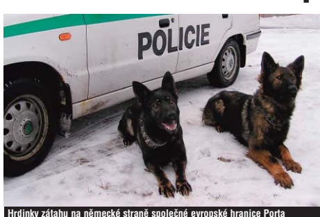
Hrdinkami zátlahu na německé straně společně evropské hranice Porta a Rhea. U Bärensteinu pomohly usvědčit dva německé pašeráky drog.

Hrdinkami policejního zátlahu proti pašerákům drog na česko-německé hranici mezi Potůčky a Bärensteinem se staly služební feny cizinecké policie Rhea a Porta. O pomoc psodvů Karlovarského kraje požádala policejní ředitelství Chemnitz-Erzgebirge prostřednictvím stýněného důstojníka společného centra česko-německé policie i celní spolupráce Schwandorf. Potřebovali zásah v okrsku Annaberg, kde psodvody a psy cvičené na drogy nemají. Byl to případ bleskové přeshraniční pomoci mezi dvěma kraji uvnitř Evropské unie. „Naše dvoúčenná hlídka cizinecké policie z Karlových Varů se dvěma služebními psy se přesunula k Bärensteinu, kde německá policie asi sto metrů od hranice