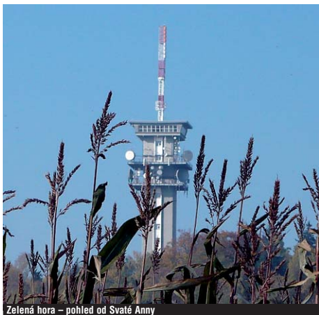
Zelená hora – pohled od Svaté Anny

Cyklotrasa 2164 (Cheb–Horní Hrančičná–Pomezí)