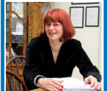
Reditelka krajského muzea: peče nejlepších Strúdlí v Chebu.