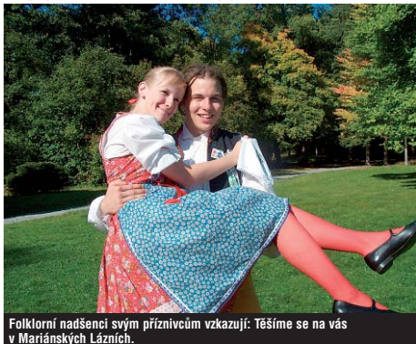
Folklorní nadšenci svým příznivcům vzkazují: Těšíme se na vás v Mariánských Lázních.

Masopustní radovánky skončily Popelační středou a začalo období půstu, které bude trvat až do Velikonoc. Ty se v letošním roce konají nevyčká brzo. I folklorní soubor Marjánek z Mariánských Lázní symbolicky zakončil masopust předáním žezla Půstovi a po plesové sezóně se vrací k přípravám na zářijový folklorní festival Mariánský podzim.