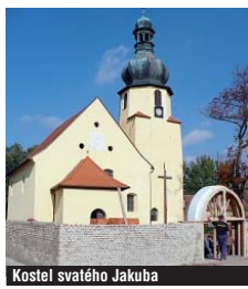
Kostel svatého Jakuba