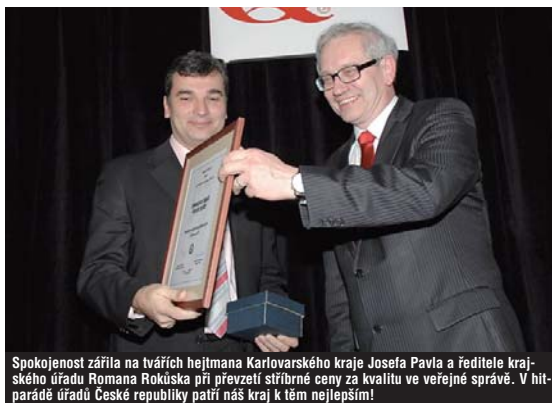
Spokojenost zářila na tvářích hejtmána Karlovarského kraje Josefa Pavla a ředitele krajského úřadu Romana Rokúseka při převzetí stříbrné ceny za kvalitu ve veřejné správě. V hitparádě úřadů České republiky patří náš kraj k těm nejlepším!

Dvojnásobně zabodoval karlovarský krajský úřad na 4. Národní konferenci kvality ve veřejné správě, která se konala od 23. do 25. ledna ve SPA hotelu Imperial. Poprvé jako pozorný hostitel, kterého si 300 pozvaných starostů, tajemníků a dalších hostů