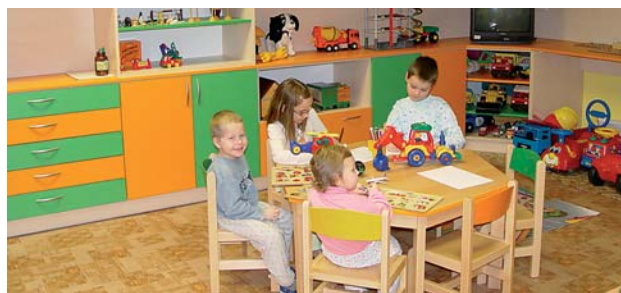
Děti si užívají nových hraček a dalšího vybavení zrekonstruované herny.

Základní a mateřskou školu, která slouží potřebám dětského oddělení, otevřela po celkové rekonstrukci Nemocnice v Karlových Varech. Do oprav investovala kolem 250 000 korun ze svých zdrojů, další peníze poskytl sponzoři a vybavení dodal bezplatně Karlovarský kraj.