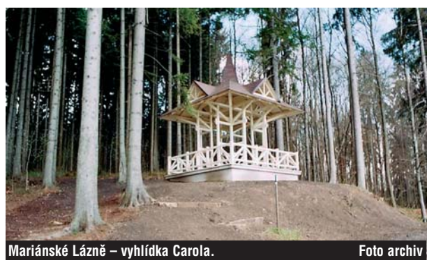
Mariánské Lázně - vyhlídka Carola.