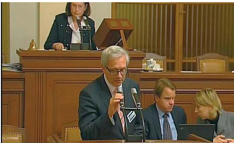
Hejtmán obhájil zákonodárnou iniciativu Karlovarského kraje na půdě Parlamentu ČR.

„Tímto postupem nebude narušeno samotné správní řízení, neboť dokazování a rozhodnutí ve věci je pouze v kompe-