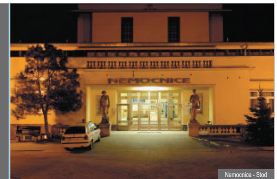
Nemocnice - Stod