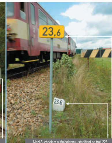
Mezi Suchdolem a Majdalenou - staničení na trati 226

i Číslo trati se z tabule staničníku bohužel nedozvíte. Číslo 183 má souvislost se staničním stožárů trakčního vedení a je pro oznámení Vaší polohy na linku 112 bezvýznamné. Shoda s číslem trati je náhodná!!!