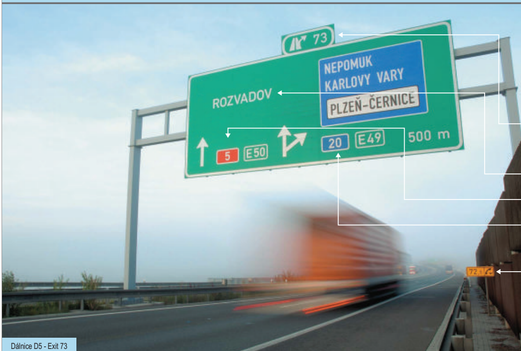
Dálnice D5 - Exit 73

i Dálnice a rychlostní komunikace jako hlavní komunikační tepny usnadňují cestu do práce, umožňují přepravu velkého množství zboží. Ocení je i cestující na velké vzdálenosti. Na druhou stranu představují trasy s vysokým počtem nebezpečných dopravních nehod, často řetězových. K nim může napomáhat nepřízeň počasí, ale bohužel i (ne)kvalita komunikace.