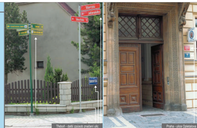
Třeboň - další způsob značení ulic

Více čísel na budově může být umístěno například jestliže jedním vchodem jde projít k více bytům nebo má-li město kromě čísel popisných zavedená také čísla orientační. Pak je možné sdělovat kterékoli z nich, případně obě.