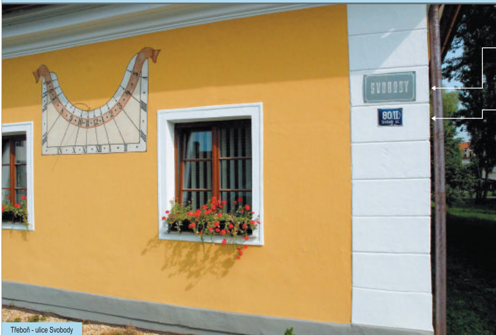
Třeboň - ulice Svobody

i Ulice nejsou pojmenované ve všech obcích a městech.