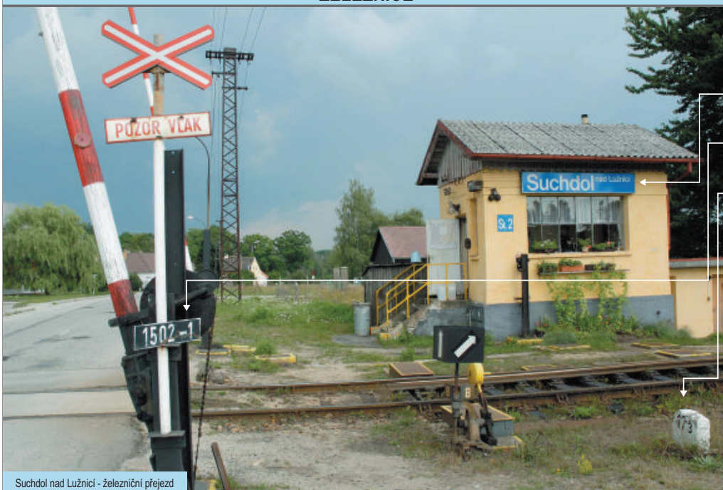
Suchdol nad Lužnicí - železniční přejezd

i Železnice je důležitá dopravní tepna i místo nebezpečných nehod. Přejezd v Suchdole nad Lužnicí jde přesně určit třemi různými způsoby.