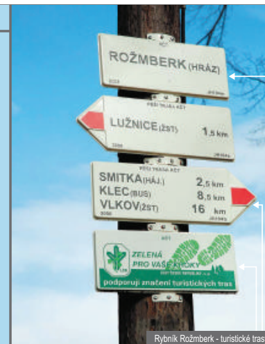
Rybník Rožmberk - turistické trasy

Význam turistických tras pro příjem tišňového volání je pouze pomocný. V členitém terénu s nedostačkem jiných orientačních bodů, například na horách, jejich význam roste.