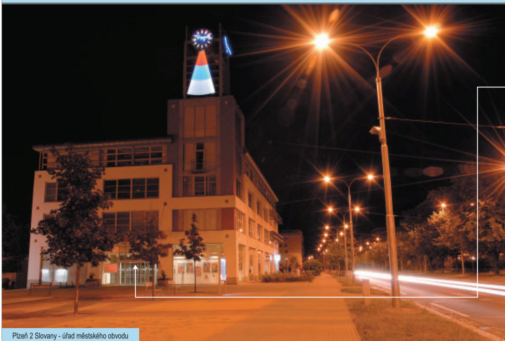
Pízeň 2 Slováky - úřad městského obvodu

i Budovy úřadů bývají cílem „žertů“, při kterých anonymně oznamuje umístění nebezpečných předmětů do objektu. Takový člověk by si měl uvědomit, že následný zásah složek integrovaného záchranného systému platí ze svých daní.