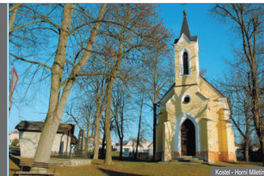
Kostel - Horní Miletín

⚠ Orientačním bodem a to dobře použitelným, jsou i neudržované hřbitovy. V topografických i turistických mapách jsou pečlivě zmapovány.