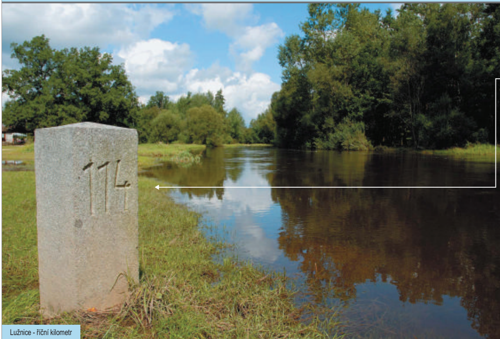
Lužnice - říční kilometr

i Větší vodní toky nelákají jen rybáře, ale zejména v letních měsících také množství vodáků. Pro toky existuje staničení - kilometrůž. Říční kilometry nejsou číslované od pramene toku, ale naopak číselná řada říčních kilometrů vzrůstá od soutoku směrem proti proudu.