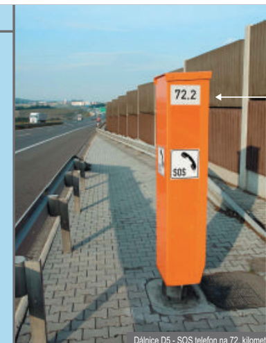
Dálnice D5 - SOS telefon na 72. kilometru

Při tísňovém volání hlašte operátorovi číslo dálnice, kilometr a směr, kterým jedete.