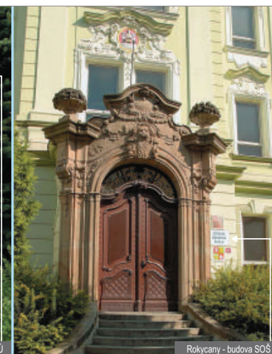
Rokycany - budova ŠOŠ

i Česká pošta nemusí být označena známkou přímo na budově. Často jsou tabule umístěny na stojanech před budovou. Reklam na pojišťovnu, případně spořitelnu si není třeba všímat. Důležitá je