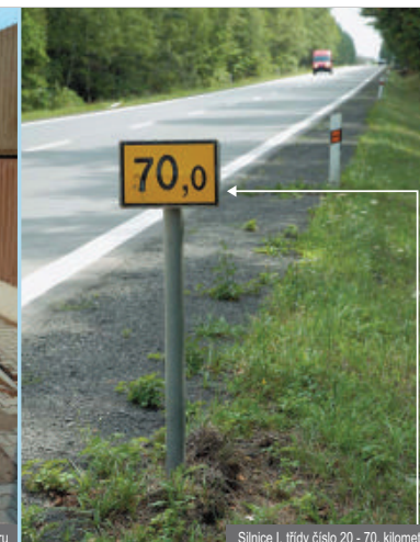
Silnice I. třídy číslo 20 - 70. kilometr

i SOS telefon může sloužit k ohlášení nehody Policii ČR, nese i informaci o kilometru dálnice na kterém se nachází - 72. kilometr 200. metr