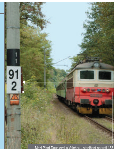
Mezi Plzní Doudlevcí a Valchou - staničení na trati 183

⚠ Staničníky stejné hodnoty se mohou vyskytovat v rámci jedné trati nebo v místech, kde se sbíhá více tratí. Zde by nepřesná informace mohla vést ke vzniku problému. Důležitá je proto informace o naposledy projaté stanici nebo stanici, ke které směřujete.