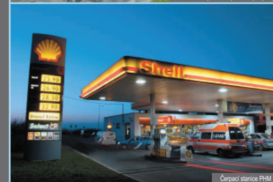
Čerpací stanice PHM