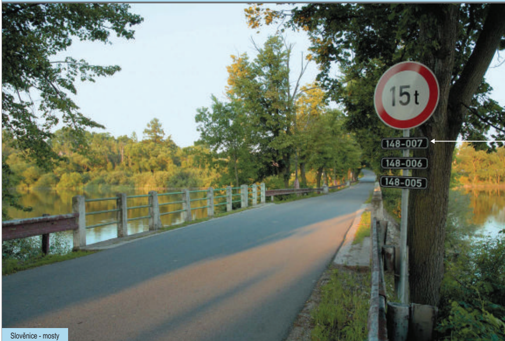
Slověnice - mosty

i Silnice II. třídy se označují trojčísleým číslem, silnice III. třídy čtyř a vícečísleým číslem. Není na nich vytvořeno staničení. K orientaci lze použít objekty, kterých si většina řidičů obvykle nevšimá. Jednoduše proto, že neznačí jejich význam a nepotřebují si jich všimát. 148-007, 148-006, 148-005 jsou čísla tří mostů v obci Slověnice na Třeboňsku. Vedou přes výběžek rybníku Dvořohů. Následují těsně za sebou a jsou označeny jednou společnou značkou. Stejně jako například u železničních přejezdů číslo před pomíčkou představuje číslo silnice. Číslo za pomíčkou je pořadové číslo objektu na silnici daného čísla. Takovoto označení mostu nebo dalších objektů (přejezdů, podjezdů), je jednoznačnou adresou objektu. Zmíněné objekty se dají samozřejmě použít k určení místa volání i na dálnicích, rychlostních komunikacích a silnicích I. třídy.