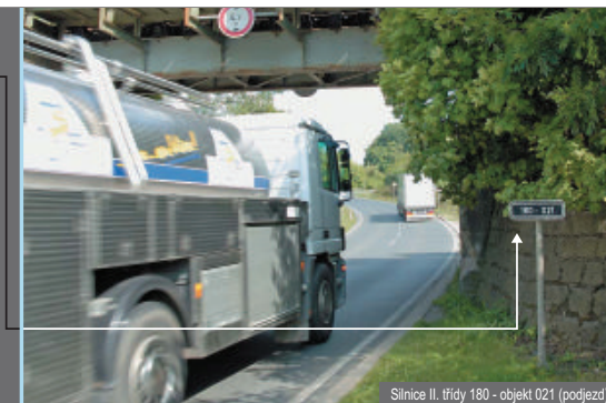
Silnice II. třídy 180 - objekt 021 (podjezd)

☎ Při tísňovém volání hlase prosím opět směr, odkud a kam jedete. Důležité je také sdělit značku čerpací stanice. Ve velkých sídlech a na dálnicích, kde je poměrně velké množství čerpacích stanic, jde o důležitý rozlišovací údaj.