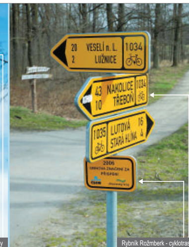
Rybník Rožmberk - cyklotrasy

⚠ Reklama sponzora značení pro orientaci v terénu význam nemá.