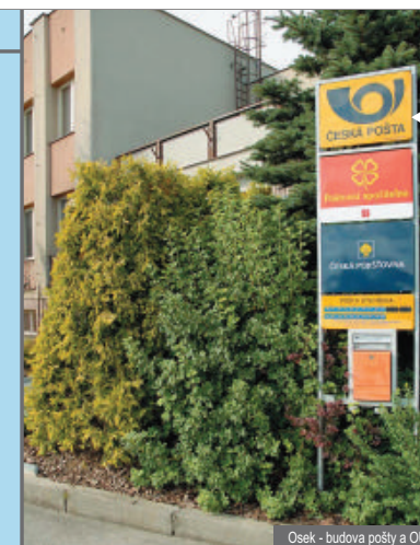
Osek - budova pošty a OÚ

Nejlepší způsob určování místa mimořádné události ve městě zůstává oznámení přesné adresy.