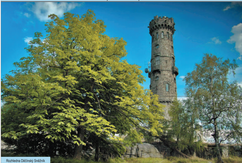
Rozhledna Děčinský Sněžník

i V topografických mapách je mnoho objektů vedených jen jako bodová značka - vysílače, rozhledny a podobně. Nicméně ve skutečném světě jsou a proto mají svůj význam pro orientaci v terénu.