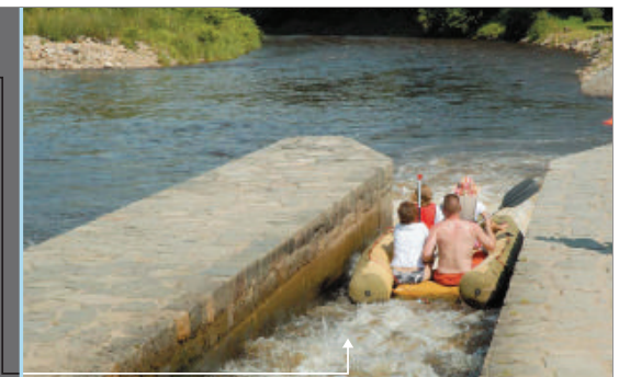
Zlatá Koruna - jez s propustí

informujte operátora o své trase, tj. odkud a kam směřujete. Název vodní plochy, kterou mýjíte, použijte jako informaci pro upřesnění Vaší polohy.