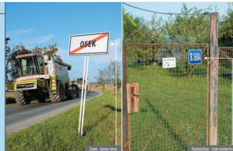
Osek - konec obce

Problém představují špatně udržovaná stavení, často bez jakéhokoli vyznačení čísla popisného.