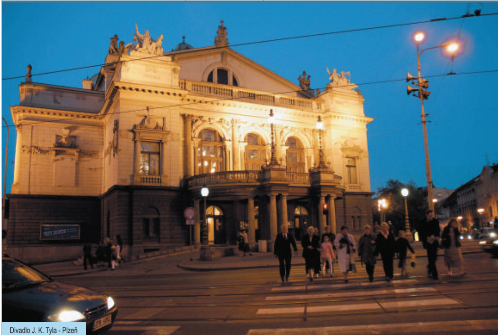
Divadlo J. K. Tyla - Plzeň