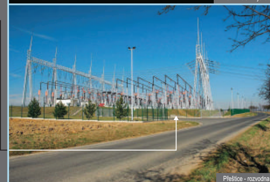
Přeštice - rozvodna