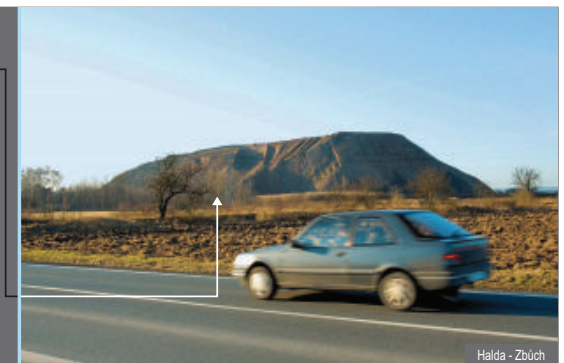
Halda - Zbůch

místa mimořádné události se dají použít pouze skládky řízené a řádně provozované. To se netýká například několika pneumatik pohozovaných u silnice nebo pár hromádek rostlinného odpadu tlejícího na kraji lesa.