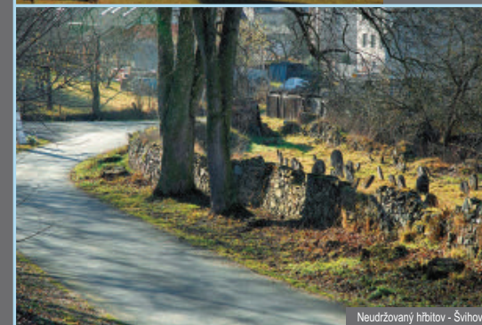
Neudržovaný hřbitov - Švihov