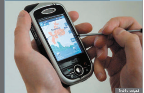
Mobil s navigací