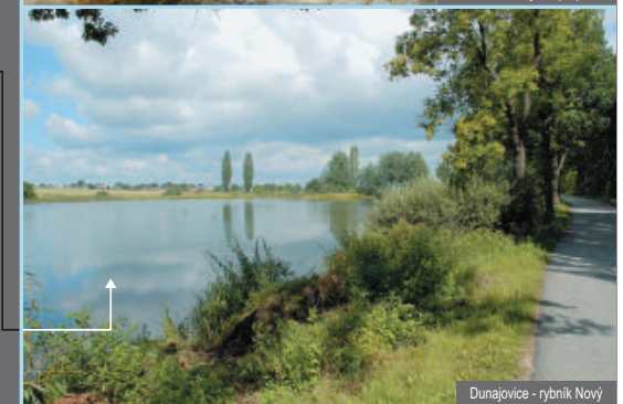
Dunajovice - rybník Nový