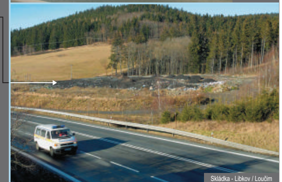
Skládka - Libkov / Loučim