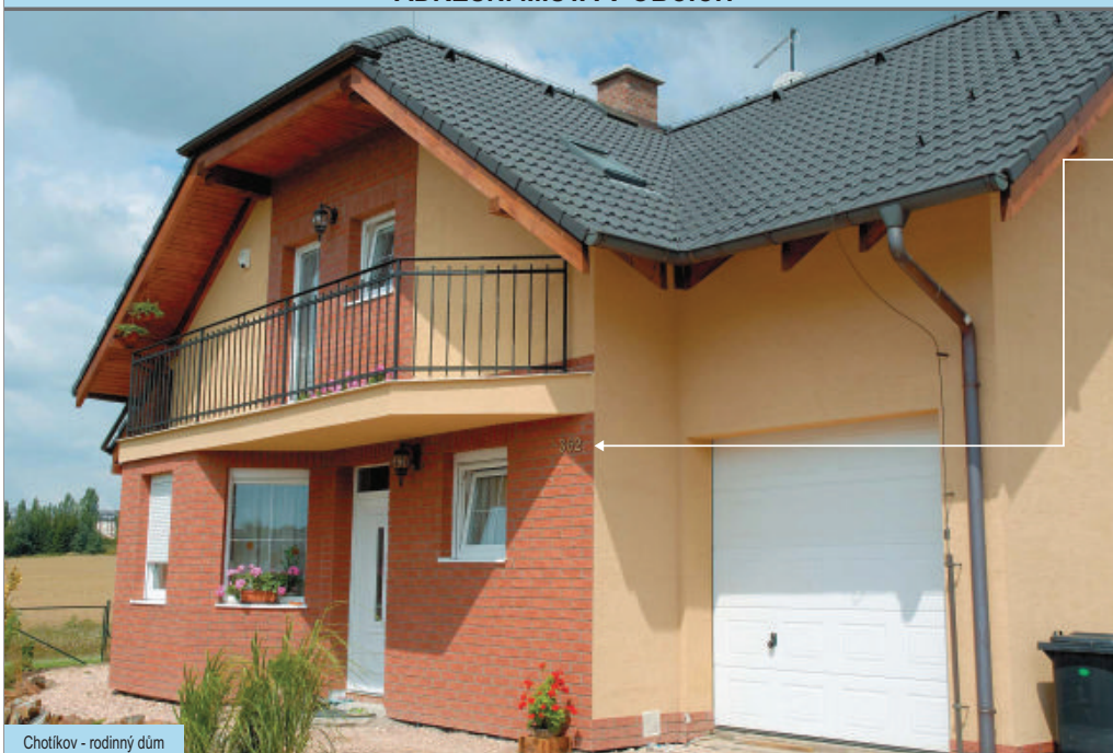
Chotkov - rodinný dům

i Číslo popisná domů v menších obcích záchranáři a hasiči mnohdy složitě hledají. Ne vždy občané věnují potřebnou pozornost údržbě označení své nemovitosti.