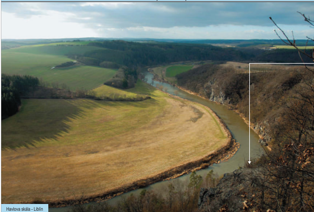
Havlova skála - Liblín