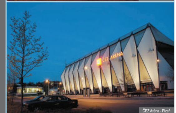
ČEZ Arena - Plzeň