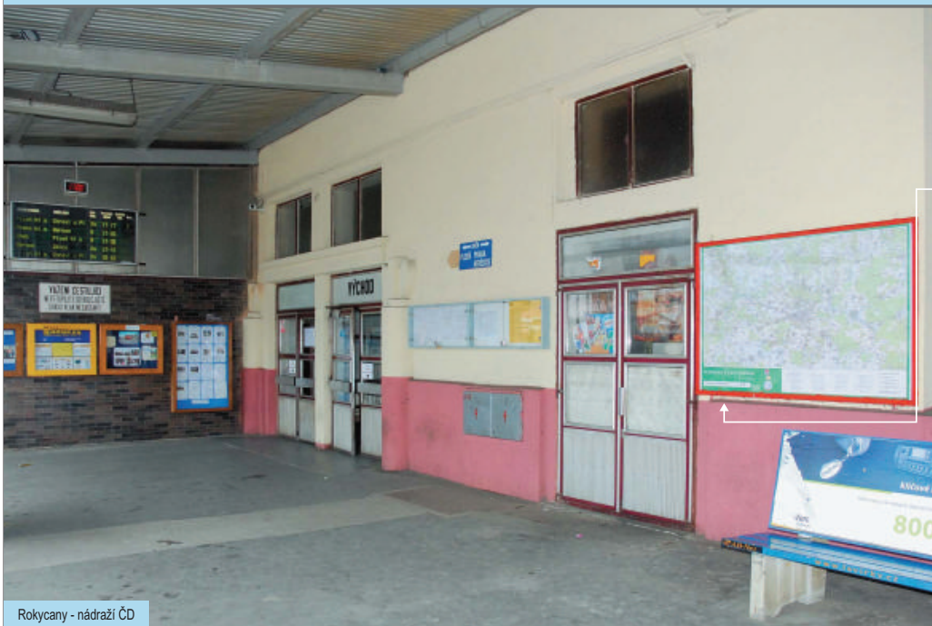
Rokycany - nádraží ČD

i KLUB ČESKÝCH TURISTŮ byl založený na konci 19. století. Dodnes jde o organizaci s početnou členskou základnou, čítají okolo 40 tisíc členů. Kromě ostatní činnosti se zabývá značením turistických tras a jejich údržbou. Značí trasy pro pěší turistiku, lyžáře a ve spolupráci s dalšími organizacemi také trasy pro cyklisty.