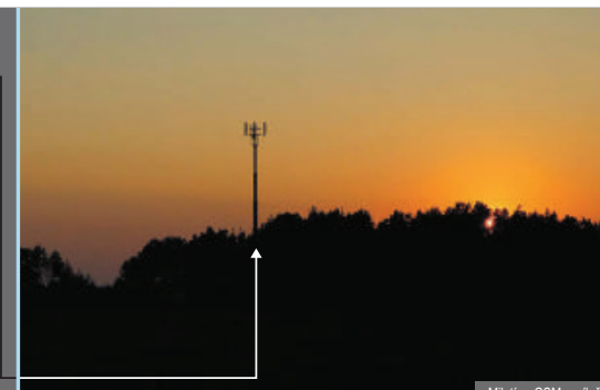
Miletín - GSM vysílač

☎ Při tísňovém volání informujte operátora o názvu obce, kterou jste naposledy projeli, případně ke které směřujete. Můžete informovat také o číste silnice, po které jedete. Samotná rozvodna má pouze pomocný význam pro přesnější určení Vaší polohy.