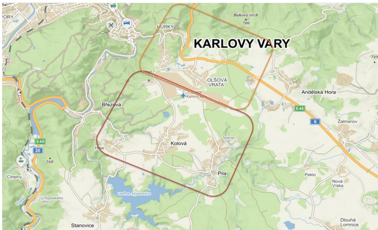
Obrázek 1 Tvary leteckých okruhů