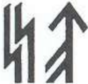
Heilszeichen (runa prosperity)