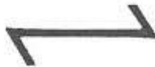
Eif – Rune (symbol horlivos a nadšení)