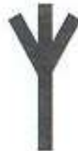
Leben – Rune a Toten - Rune