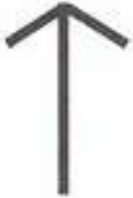
Tyr – Rune (runa bitvy)