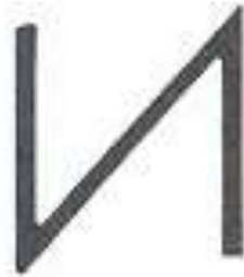
Ger – Rune (symbol společného ducha)