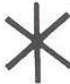
Hagall – Rune (symbol věrnosti)