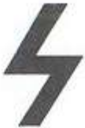
Sig – Rune (runa vítězství)