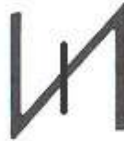
Wolfsangel – „vlčí hák“ (symbol svobody a nezávislosti)