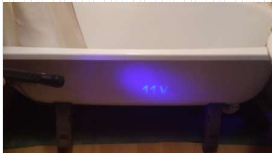
Označení vany UV lakem