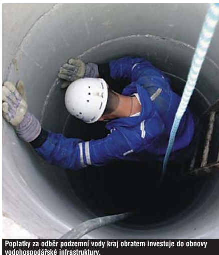
Poplatky za odběr podzemní vody kraj obrátem investuje do obnovy vodohospodářské infrastruktury.

Před dvěma lety byly příspěvky hrazeny z účelově vázaných prostředků poskytnutých krajům ze státního rozpočtu. V regionu bylo tehdy proinvestováno celkem téměř sedm milionů korun. Vloni už byly příspěvky hrazeny z prostředků vybraných za odběry podzemní vody a proinvestováno bylo 6,5 milionu korun.