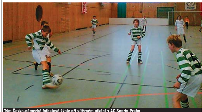
Tým Česko-německé fotbalové školy při vítězném utkání s AC Sparta Praha.

Vynikající druhé místo získal česko-německý výběr fotbalové školy na I. mezinárodním halovém mistrovství žáků ročníku 1996, které se uskutečnilo v hale Clermont – Ferrand. Do Řezna se sjelo celkem dvanáct týmů z České republiky, Německa, Rakouska a Švýcarska.