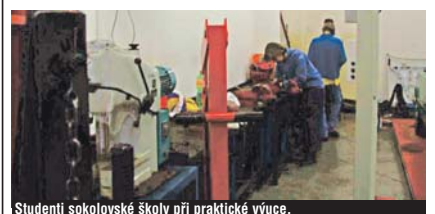
Studenti sokolovské školy při praktické výuce.

Návštevou vybraných pedagogů z Integrované střední školy technické a ekonomické Sokolov v německé střední škole Untervellenborn Saafeld začala mezinárodní odborně vzdělávací spolupráce obou zařízení.