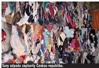
Tuny odpadu zaplavily Českou republiku.