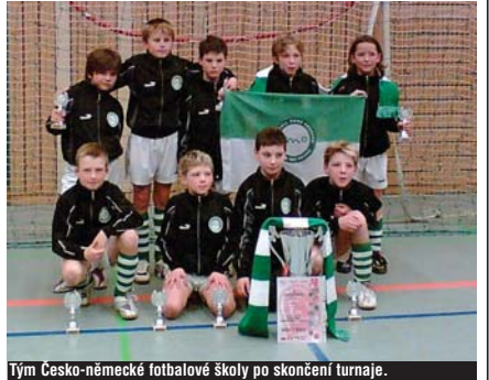
Tým Česko-německé fotbalové školy po skončení turnaje.