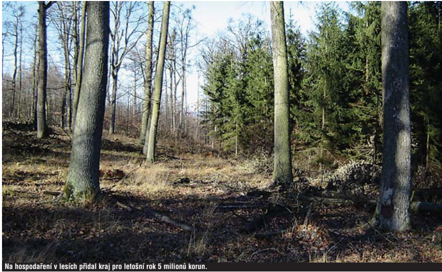
Na hospodaření v lesích přidal kraj pro letošní rok 5 milionů korun.

„Pro rok 2006 došlo k redukci počtu dotačních titulů, nicméně rozpočtové prostředky pro příspěvky se objemově navýšily. Tato skutečnost se jistě kladně promítne při zalesňování kalamitních holin,“ říká radní kraje Luboš Orálek. „Vloni jsme na