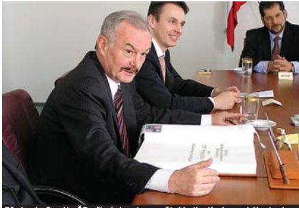
Předseda Senátu ČR při zápisu do pamětní knihy Karlovarského kraje.