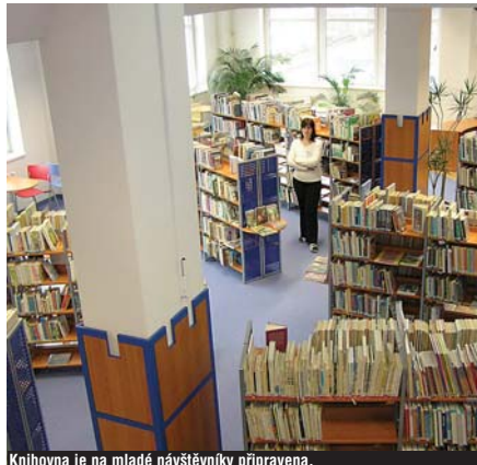
Knihovna je na mladé návštěvníky připravena.

Soutěž pro školáky s názvem Kamarádi moudrosti vyhlásila letos už podvanácté Krajská knihovna Karlovy Vary. V měsíci dubnu bude každá třída základní školy sbírat body celkem ve třech kategoriích.