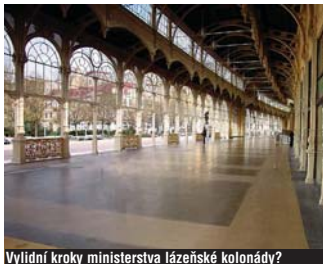
Výhlední kroky ministerstva lázeňské kolonády?