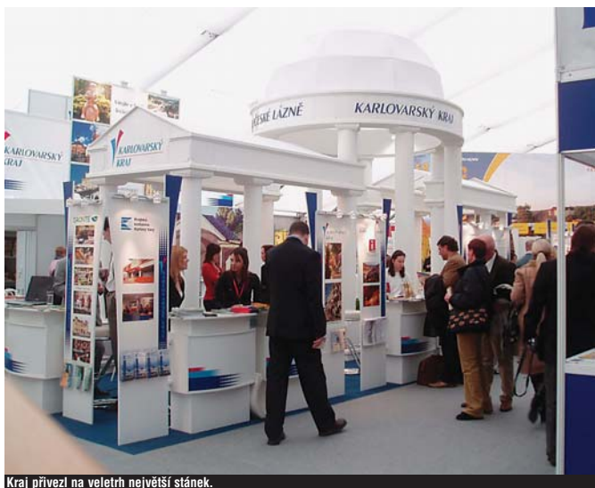
Kraj přivezl na veletrh největší stánek.