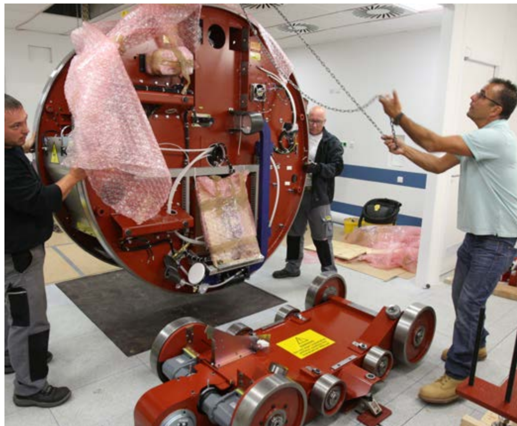
Instalace lineárního urychlovače v chebské nemocnici.