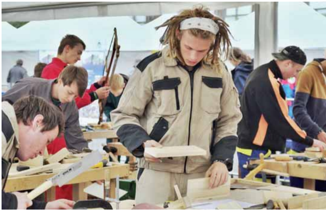
V Sokolově soutěžili také učňové oboru truhlář.

Nejen tato školní skupina si přišla prohlédnout, zjednodušeně řečeno, jak dnes vypadají některá řemesla. A nejen deváté třídy tak svou účastí na Machrech roku naplnily záměr pořadatelů, kteří se už šestým rokem snaží o obnovu prestiže učňovského školství a popularizaci řemesel. Třeba právě tím, že na náměstích pořádají tuto učňovskou