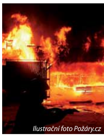
Ilustrační foto Požáry.cz

Kraj zároveň vyhověl také dvěma městům, jejichž jednotky potřebovaly obnovit zastaralou po-