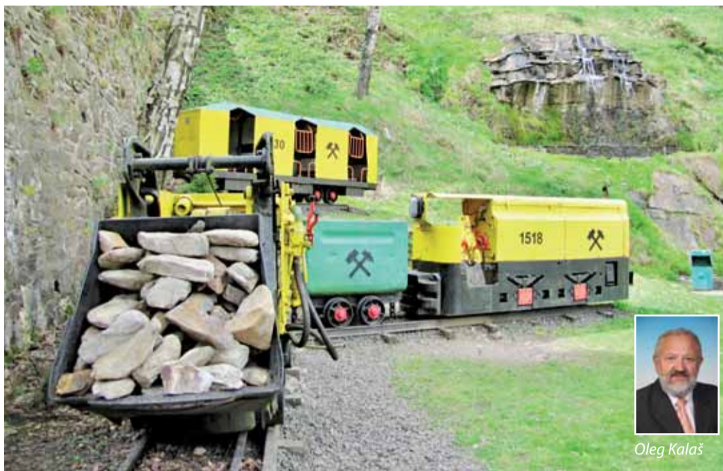
Jednou z aktivit v oblasti rozvoje kultury a cestovního ruchu v Karlovarském kraji je práce na zapsání Hornické kulturní krajiny Krušnohoří-Erzgebirge na Seznam kulturního dědictví Unesco. Na ilustračním snímku Václav Fikara je Jáchymov.