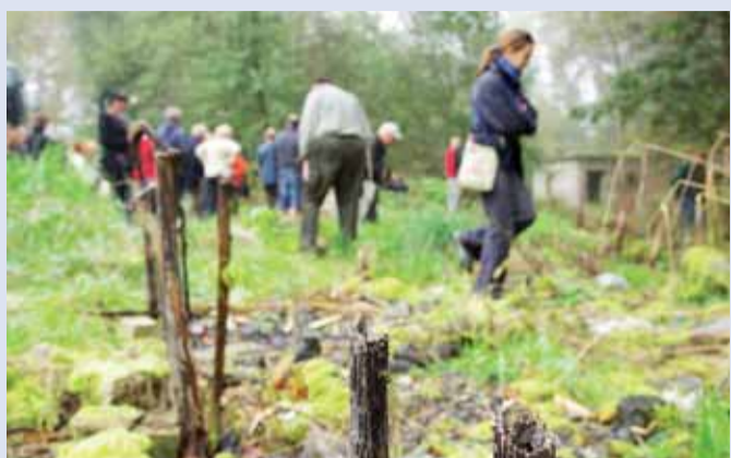
Účastníci konference o likvidaci invazních rostlin v Karlovarském kraji absolvovali i prohlídku terénu. Druhý den konference navštívili několik lokalit v regionu, aby se přesvědčili o efektivitě zvolených metod jejich likvidace.

Už druhým rokem likviduje Karlovarský kraj invazní rostliny - bolševník, křídlatky a netýkavku. Protože se v rámci celé Evropské unie jedná o unikátní projekt, uspořádal na začátku října dvoudenní konferenci, aby se stejně jako v loňském roce podělil o své zkušenosti se zájemci a odborníky z celé republiky.