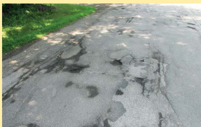
Silnice II. a III. tříd jsou někde ve velmi špatném stavu, některé jejich úseky letos projdou rekonstrukcí. Ilustrační foto

Seznam Krajské správy a údržby silnic Karlovarského kraje zahrnuje především ty úseky, u kterých již nelze provádět běžnou údržbu a lokální výspravy. Na komfortnější jízdu se mohou těšit řidiči například ze Sokolovska, Ostrovska či Krušných hor. Práce se naplní rozběhnou na silni-