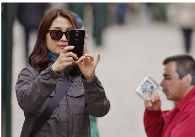
Vlivem složité mezinárodní situace vloni klesaly počty ruských turistů, přilétajících do mnoha evropských destinací. Karlovy Vary nevyjímaje.

generální ředitel AXXOS Hotels & Resorts (společnost provozuje v Karlových Varech hotely Aqua Marina, Olympia, Marttel nebo St. Joseph Royal Regent)