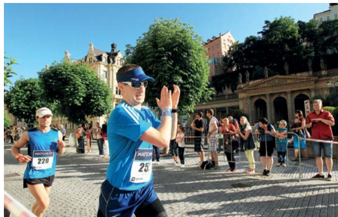
Zahraniční běžci si pochvalují jedinečnou kulisu.

Mattoni 1/2Maraton Karlovy Vary se rozběhne potřetí. Se stříbrnou známkou a v online přímém přenosu, zato však na stejné trase. Stejně krásné jako loni.