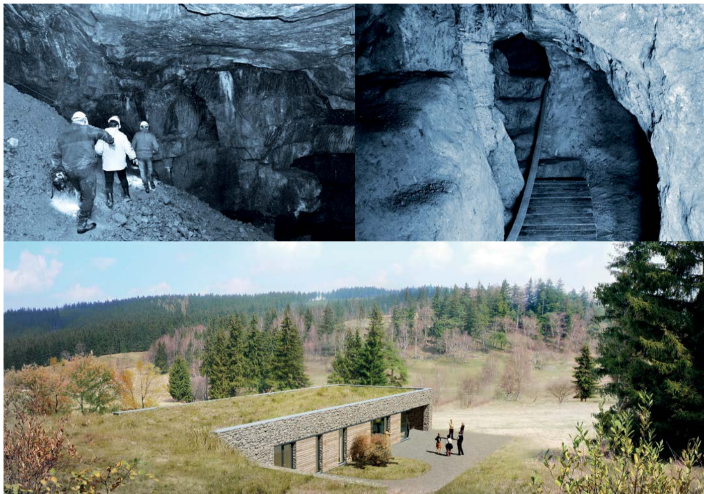
Na snímcích nahoře pohled do do středověkého cínového dolu Jeronym, dole pak vizualizace chystaného vstupního zázemí tohoto dolu.