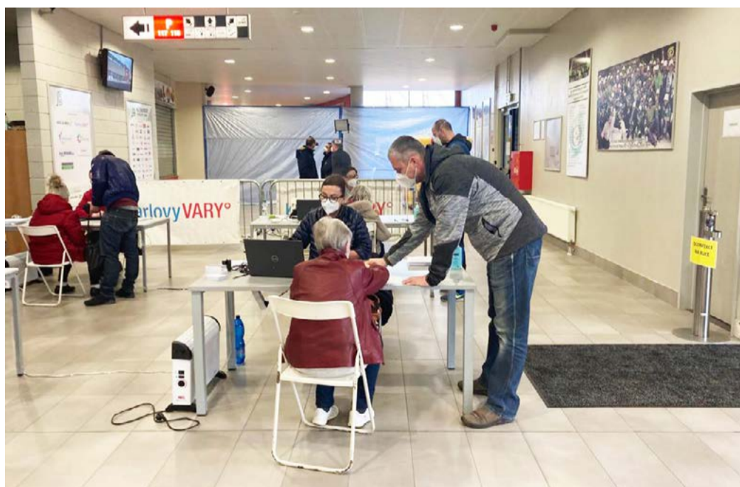
Očkovací centrum v KV Areně Pro přichozí jsou připravena čtyři očkovací stanoviště, čekárna pojme až 85 lidí.

S otevřením nových velkokapacitních očkovacích center v Karlovarském kraji souvisí uzavření očkovacích míst v nemocnicích v Karlových Varech, Sokolově a Chebu a tedy i převedení všech dosavadních rezervací. Lidé, kteří se původně registrovali v centrálním rezervačním systému státu, tedy senioři 80+, 70+, zdravotníci a pedagogové, dostali sms zprávu s vyzváněním o přesunu času a místa očkování z nemocnic do očkovacích center. Zároveň je kontaktovaly operátorky asistenční linky 800 600 444, které je na změnu upozornily.