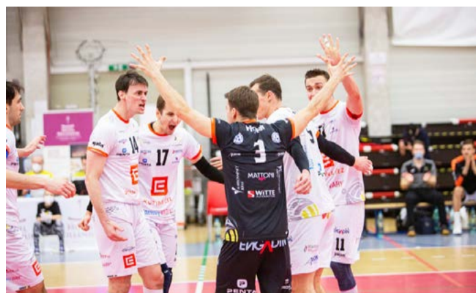
Čtvrtfinálová série mezi Karlovarskem a Kladnem se hrála na tři vítězná utkání.

KARLOVY VARY Nejvyšší soutěž volejbalistů vstoupila do klíčové vyřazovací fáze. Vítěz základní části extraligy, tým Karlovarska, svedl čtvrtfinálovou bitvu nakonec s jiným soupeřem, než původně měl. Po diskvalifikaci mužstva Beskyd přijeli na západ Čech volejbalisté Kladna. „Sezona jim nevychází pod-