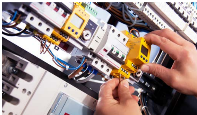
Elektrikář – silnoproud Studenti nového oboru Integrované střední školy Cheb získají po třech letech výuční list a rok poté maturitní vysvědčení.

Otevření tohoto nového oboru je podmínkou pro přihlášení školy do „Pokusného ověřování organizace a průběhu modelu vzdělávání umožňující dosažení středního vzdělání s výučním listem a střed-