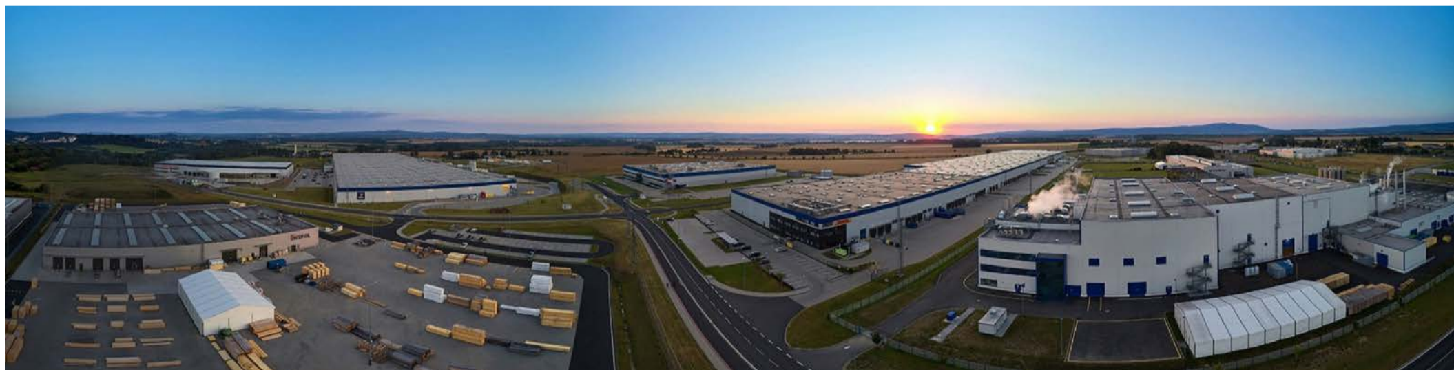
Park Cheb byl vyhlášen nejlepší průmyslovou zónou roku 2017 ve střední Evropě. Získal také certifikaci udržitelného přístupu BREEAM na úrovni „Very Good“ a „Excellent“, což z něj udělalo jeden z nejlépe hodnocených tzv. zelených parků v ČR

CHEB O budoucím rozvoji svých aktivit v Karlovarském kraji jednali se zástupci kraje představitelé investiční skupiny Accolade. Ta už řadu let investuje do moderních průmyslových parků. V Chebu rozvinula jeden z nejlépe hodnocených komplexů pro moderní podnikání ve střední Evropě a v loňském roce revitalizovala také první část brownfieldů bývalých chebských strojíren.