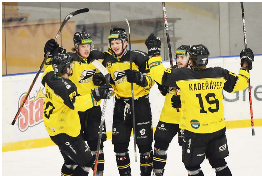
Hokejisté Baníku Sokolov se po čtvrtstoletí proboujeli do prvoligového play-off.