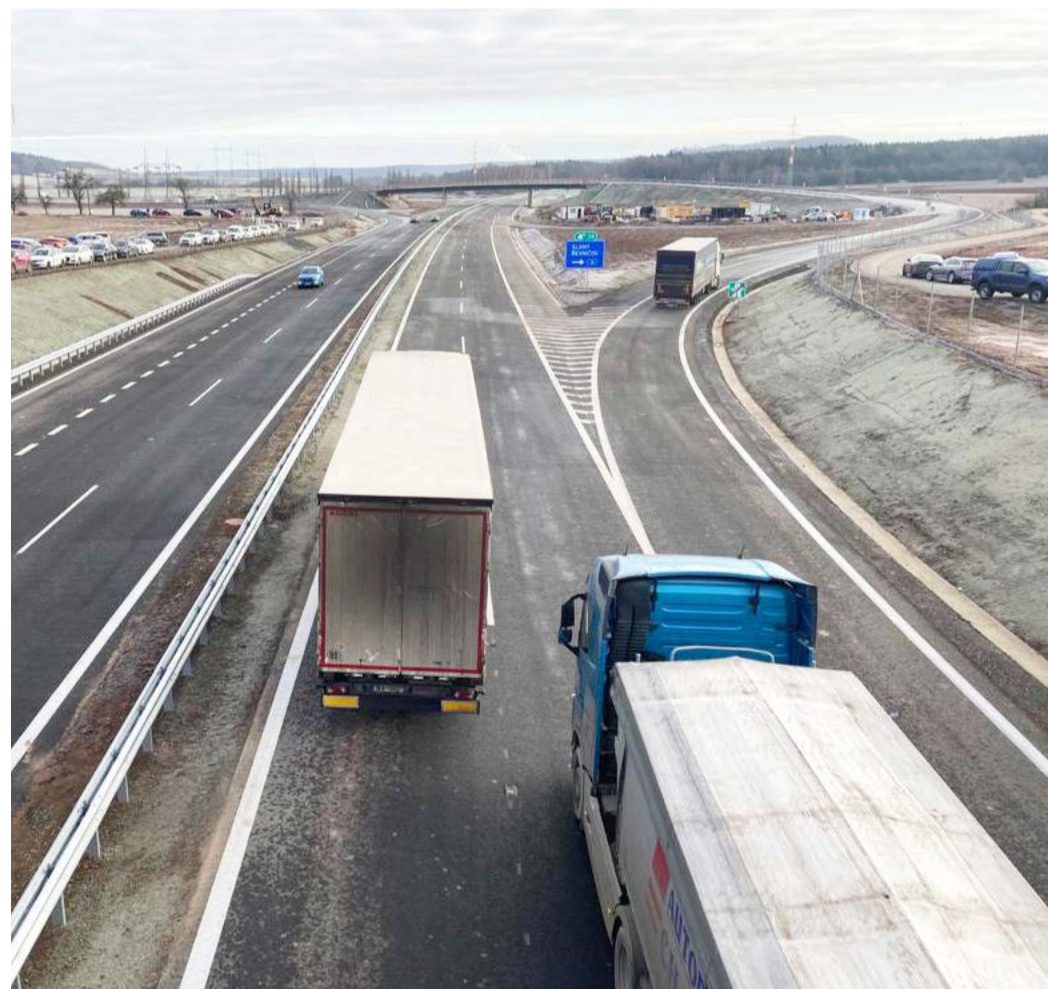
Silnice I/6 Konečným cílem je dokončení zbývajících úseků tahu D6 a vytvoření tak kompletního a kvalitního spojení mezi hlavním městem ČR Prahou a západočeskou aglomerací včetně mezinárodního propojení do Spolkové republiky Německo.

Kromě prací na obchvatu Lubence aktuálně pokračuje výběrové řízení na dodavatele stavby přeložky v Krupě. Se zahájením stavby se podle ředitele karlovarského pracoviště Ředitelství silnic a dálnic Lukáše Hnízdila počítá v pololetí tohoto roku. Na konci roku 2021 se pak zahájí výběrové řízení na zhotovitele obchvatu Hořeviček a Hořesedel.