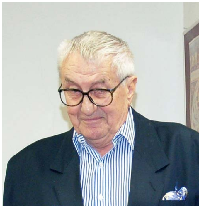
Vladimír Páral. Slavný český spisovatel se proti nemoci Covid-19 nechal očkovat v Karlovarské krajské nemocnici.

KARLOVY VARY, MARIÁNSKÉ LÁZNĚ Soukromá vichřice, Katakult, Milenci a vrazi, Mladý muž a bílá velryba... kdo by neznal knížky Vladimíra Párala, řada z nich byla ostatně také zfilmovaná. V Karlo-