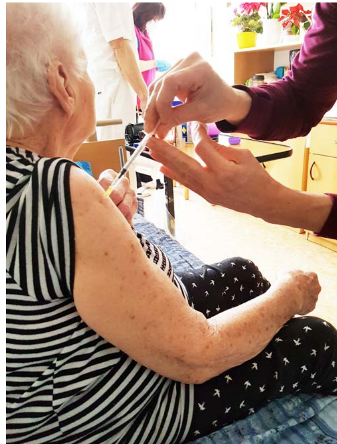
Očkování proti COVID-19. Senioři starší 80 let se mohou registrovat v centrálním rezervačním systému státu.

Karlovarský kraj obeslal potřebnými údaji také starosty obcí Karlovarského kraje, poskytovatele sociálních služeb, kteří pracují se seniory, letáky s telefonními čísly jsou k dispozici na odběrových místech. Zároveň krajský úřad vyčlenil z řad svých zaměstnanců operátory pro asistenční linku, podobně jako je tomu v případě zajištění chodu call centra pro objednávání odběrů. (KÚ)