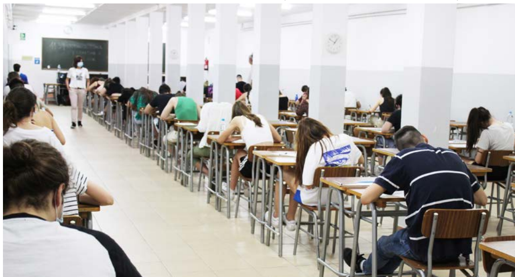
Maturita 2021 Letos se studenti vyhnou písemným slohovým pracím z českého a cizího jazyka.

Společnost Cermat také prověřovala strukturu didaktických testů tak, aby se v nich vyskytovalo jen minimum otázek z učiva, které spadá do období, kdy byla narušena řádná výuka. Ústní zkoušky zůstávají povinné pro všechny bez změny. (KÚ)