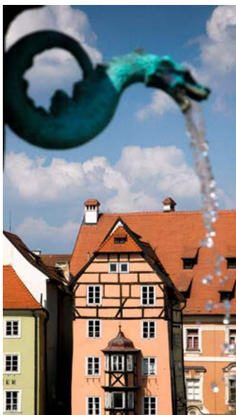
Historické město roku Vítězem krajského kola soutěže se stal Cheb.

CHEB Město Cheb se stalo vítězem krajského kola soutěže Historické město roku 2020 a postoupilo tak do celostátního kola, kde se utká s dalšími městy jednotlivých krajů ČR. Titul Historické město roku se uděluje jako ocenění za nejlepší přípravu a realizaci v rámci Programu regenerace městských památkových rezervací a městských památkových zón. O vítězství v krajském kole a o postup do celostátního kola bojovala v Karlovarském kraji další tři města – Žlutice, Horní Slavkov a Karlovy Vary. „Městu Cheb k zasluženému vítězství moc gratuluji. Ale i další tři města, která se krajského kola zúčastnila, měla rozhodně co nabídnout. Horní Slavkov se mohl pochlubit například dokončením obnovy sochy sv. Floriana nebo zádušní svítilny na území své památkové zóny, ale také opravou hřbitovní zdi a pokračujícími pra-