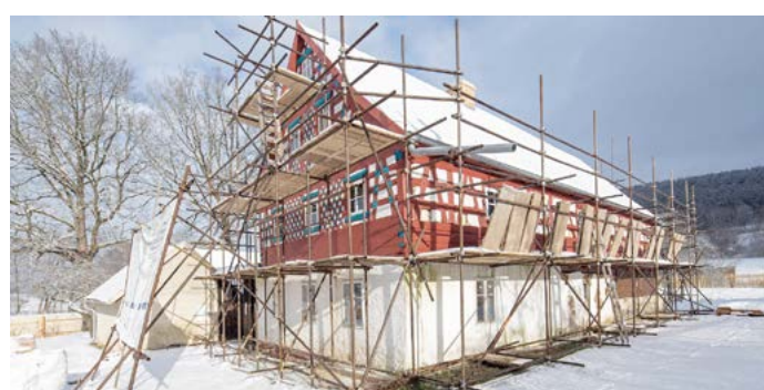
Rekonstrukce statku v Milíkově Nejzajímavější změnou je demontáž a výroba kopie původního hrázdného štítu.

ru dokončena nová budova toalet pro návštěvníky. Pozemek statku byl oplocen dlažbovým plotem a proběhla výsadba habrového plotu spolu s dalšími zahradními prvky dle architektonického návrhu. Na první pohled viditelnou změnou zaznamenala budova obytného domu a to kompletní výměnu střešní