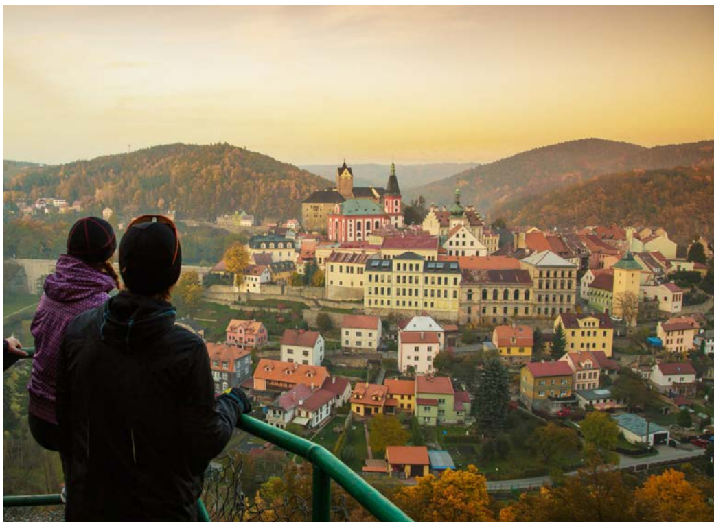
Lázeňství a cestovní ruch jsou klíčovými odvětvími ekonomiky Karlovarského kraje.

dočasného finančního rámce, který je v současné době 800 tisíc eur. Karlovarský kraj navrhuje jeho navýšení minimálně na dvojnásobek. Největší zaměstnavatelé totiž tuto hranici překonali už během jarní vlny a jsou nyní zcela bez pomoci.