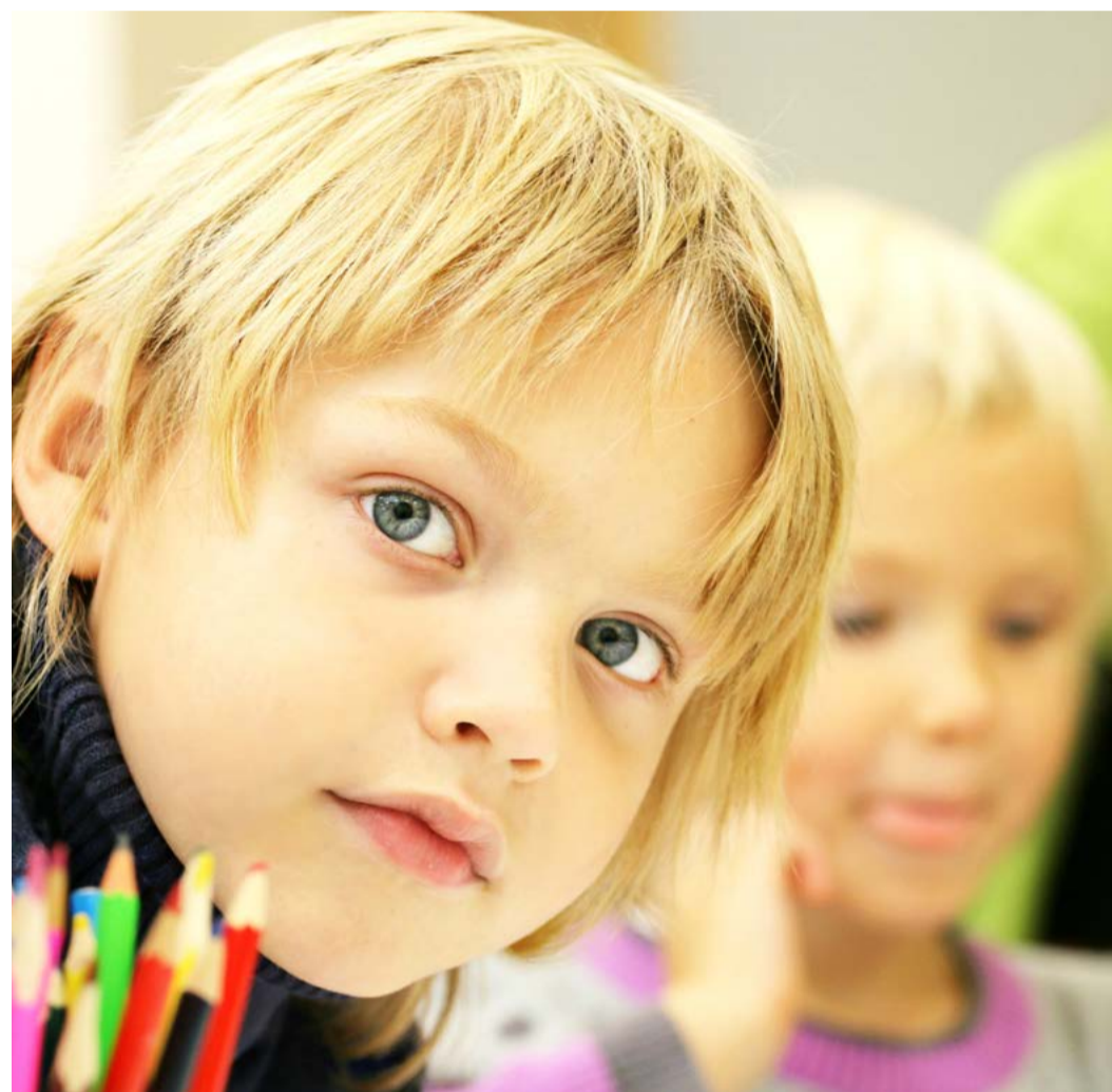
Logická olympiáda online Na řešení zapletklých otázek a rébusů měli celkem 30 minut.