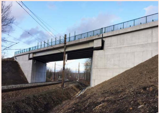
Most u Nového Sedla. Zmodernizovaná stavba na silnici II/209 propojuje území Chodovska s dálnicí D6.