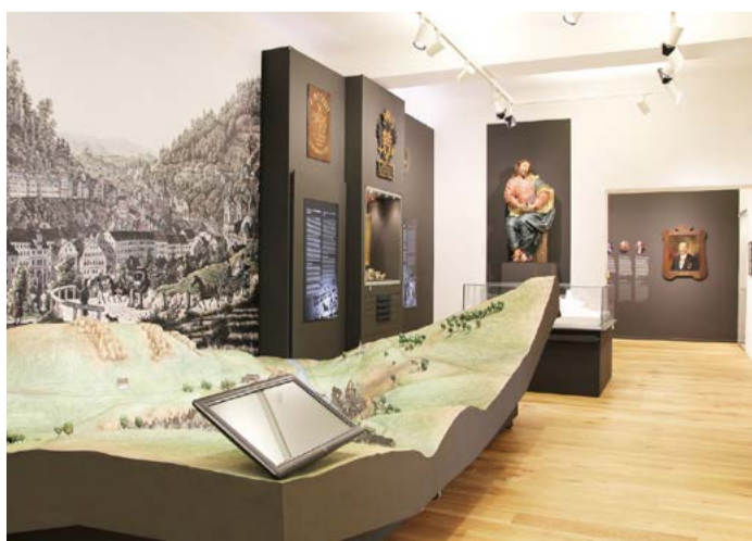
Znovu za kulturu S rozvolněním proticovidových opatření se vrátil život do příspěvkových organizací Karlovarského kraje v oblasti kultury, byť jen v omezeném režimu.

Karlovy Vary, Královská mincovna Jáchymov, Krajská knihovna Karlovy Vary, Muzeum Sokolov, Muzeum Cheb, Galerie umění Karlovy Vary, Interaktivní galerie Becherova vila, Galerie výtvarného