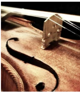
Dílna houslaře Nový edukační program využije také expozici hudebních nástrojů v Lubech.