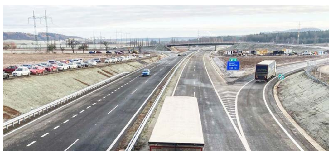
D6 Nový úsek dálnice už řidičům od prosince slouží mezi Novým Strašecím a Řevničovem.

Budování obou dálničních částí začalo v roce 2017. Náklady na jejich výstavbu přesáhly 2 miliardy korun s dotací z EU. Třetí rozpracovaný úsek na D6 by měl být hotov v srpnu 2021. Jde o obchvat Lubence. V současnosti také Ředitelství silnic a dálnic vyhlásilo zadávací řízení na zhotovitele přeložky u Krupé. Dálnice D6 by měla být kompletně dokončena v roce 2026, podle vicepremiéra Karla Havlíčka je možné, že to stavebníci stihnou ještě o rok dříve. (KÚ)