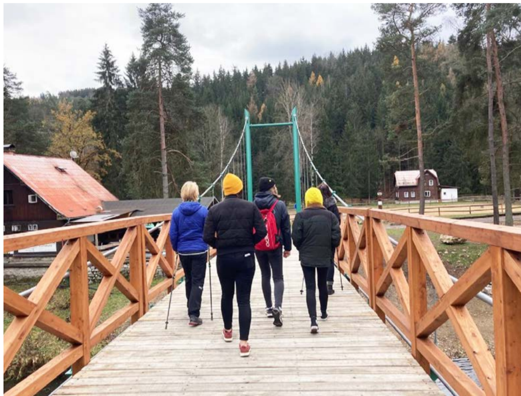
Lávka u Svatošských skal. Visutá konstrukce je ocelová s dřevěnou mostovkou z dubu a modřínu.