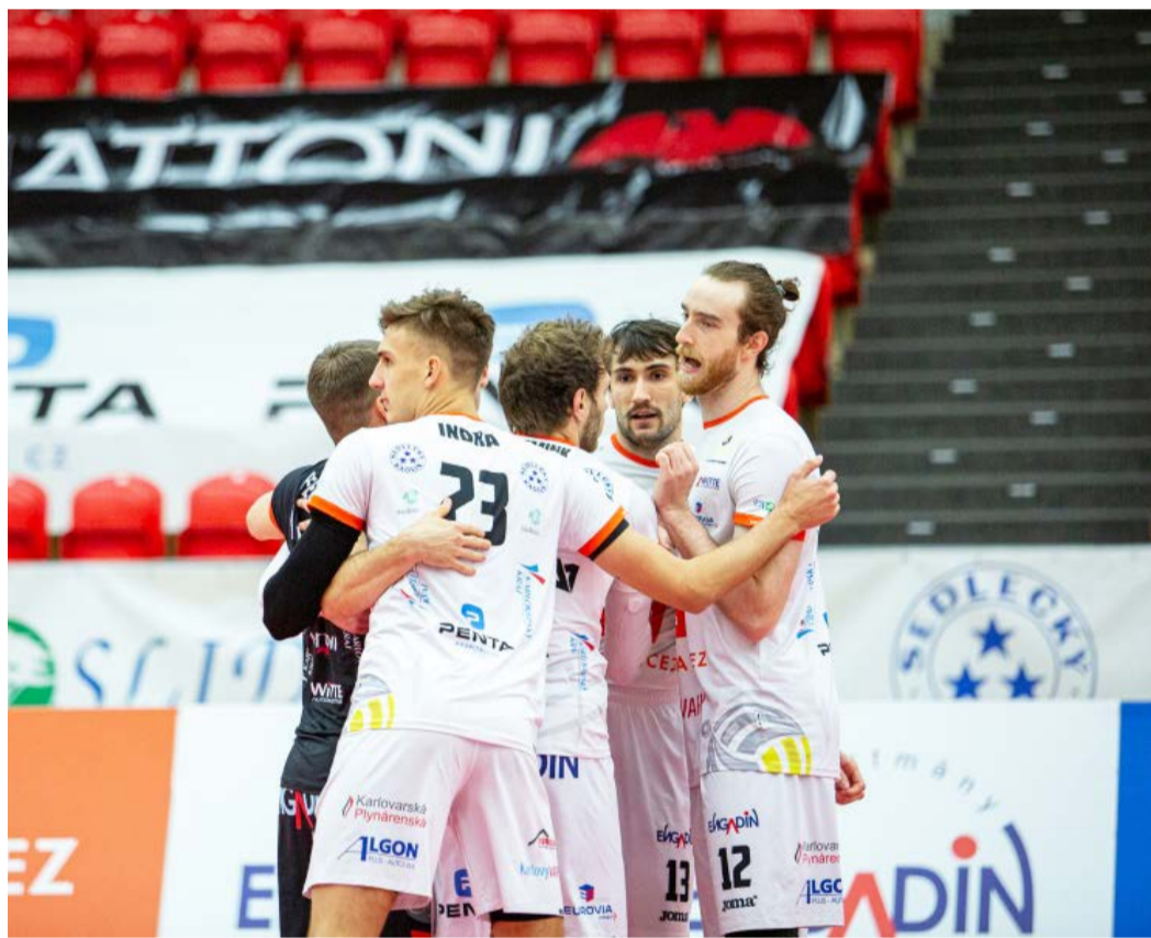
Liga mistrů Na prvním turnaji skupinové části v italském Trentinu se volejbalisté Karlovarska postavili trojici Trentino, Friedrichshafen, Novosibirsk.