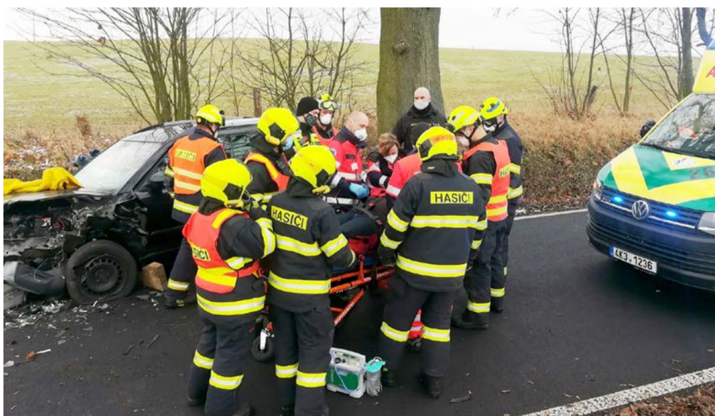
MicroRescue Informační systém pomáhá složkám Integrovaného záchranného systému s řešením mimořádných událostí s velkým počtem raněných.

Informační systém MicroRescue provozuje Hasičský záchranný sbor Karlovarského kraje, který je odpovědným orgánem za ochranu obyvatelstva. Systém v současnosti využívají kromě hasičů také krajské policisté, záchranáři, jsou do něj zapojeny regionální nemocnice a Krajská hygienická stanice Karlovarského kraje. Finanční provozu informačního systému zajišťuje Karlovarský kraj jako subjekt zastřešující Integrovaný záchranný systém. (KÚ)