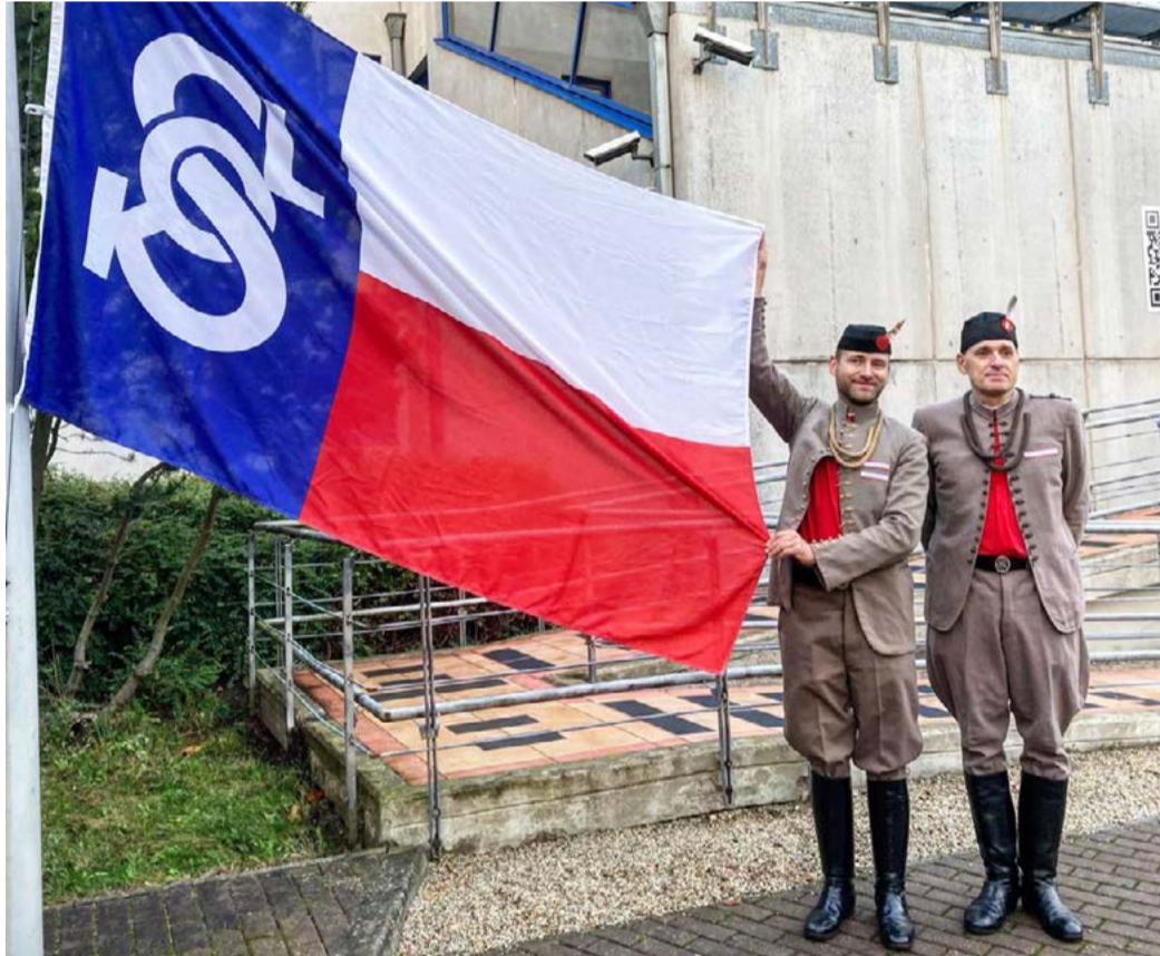
Památný den sokolstva Vyvěšení vlajky zástupci Sokolské župy Karlovarské.

Slavnostního vyvěšení vlajky se zúčastnili zástupci Sokolské župy Karlovarské spolu se zástupci místní tělocvičné jednoty. Vlajka České obce sokolské byla před budovou krajského úřadu vyvěšena po celý den a připomněla tak osudy sokolských žen a mužů, kteří položili své životy v protinacistickém odboji. (KÚ)