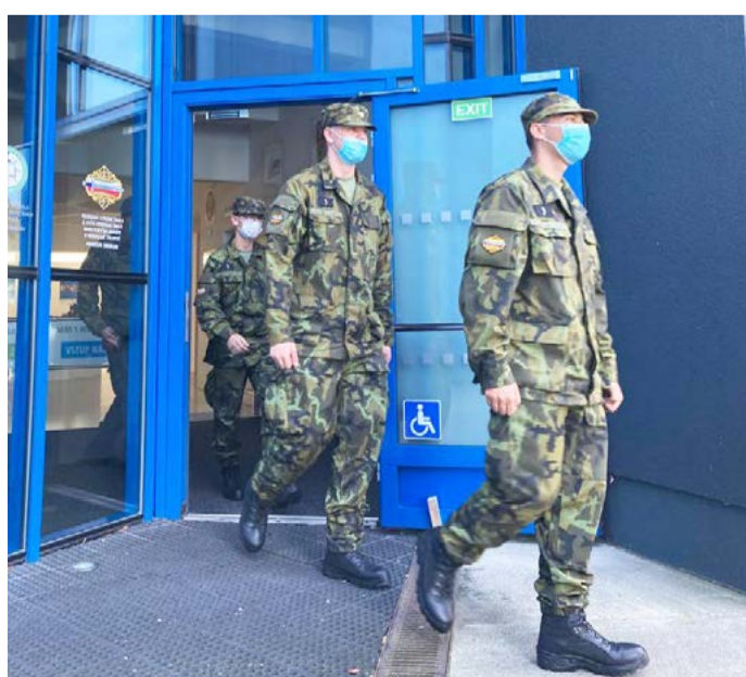
První studenti Do prvního ročníku střední vojenské školy v Moravské Třebové nastoupilo v Sokolově 27 žáků, z toho dvě dívky.

Podle ředitele vojenské školy v Moravské Třebové plukovníka Zdeněka Macháčka nebudou mít studenti vojenské školy po složení maturitní zkoušky problém najít pracovní uplatnění. Žáci jsou ubytováni na internátu v budově Sokolovské uhelné, kde bydlí i studenti místní policejní školy, vyučování vedou dva učitelé z Moravské Třebové a 16 učitelů z ISŠTE. „Základ