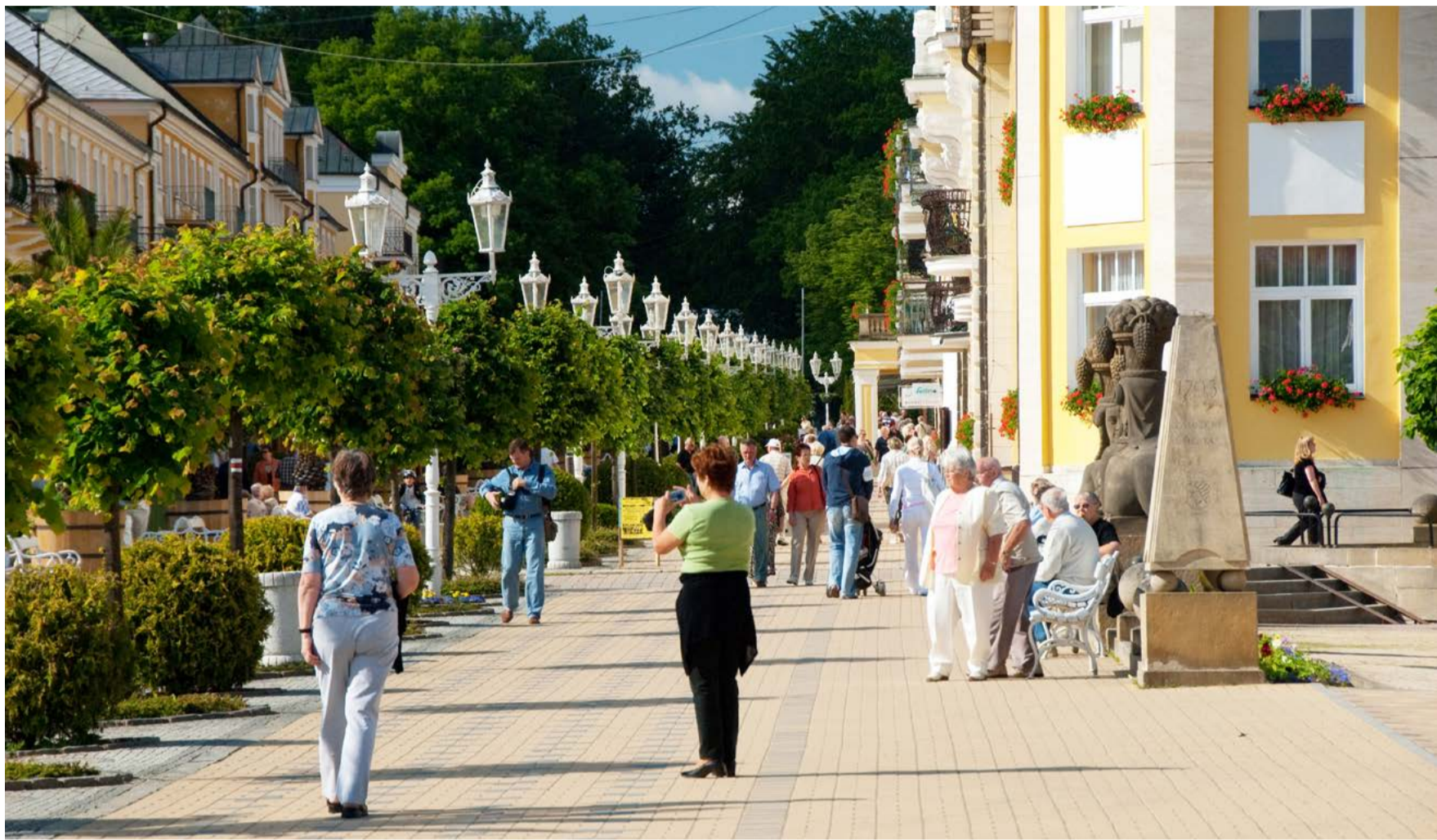
Na pomoc lázním Karlovarský kraj poskytne dar na podporu ubytování až do konce roku.