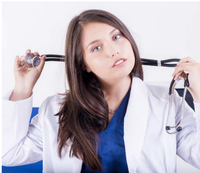
Program ke zlepšení vzdělanostní struktury Karlovarský kraj zvýšil stipendia pro studenty vybraných programů pedagogických a lékařských fakult.

doti o udělení stipendia nesmí být žadatel starší 26 let. Studenti, kterým bude stipendium vyplaceno, se zavazují k vykonávání své pracovní činnosti na území Karlovarského kraje po úspěšném dokončení studia, a to na dobu, po jakou pobírali stipendium. Navíc pro absolventy pedagogických a lékařských fakult platí zprísňené pravidlo, že po návratu do kraje musí pracovat ve vystudovaných oborech,“ doplnil radní Jaroslav Bradáč. (KÚ)