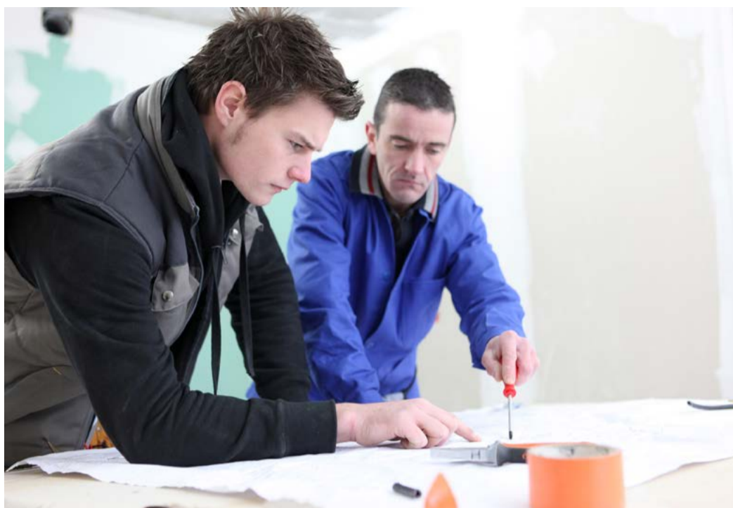
Duální systém vzdělávání Projektu se v prvních třech letech zúčastní 60 studentů odborných středních škol.

Projekt, kterého se v prvních třech letech zúčastní 60 studen-