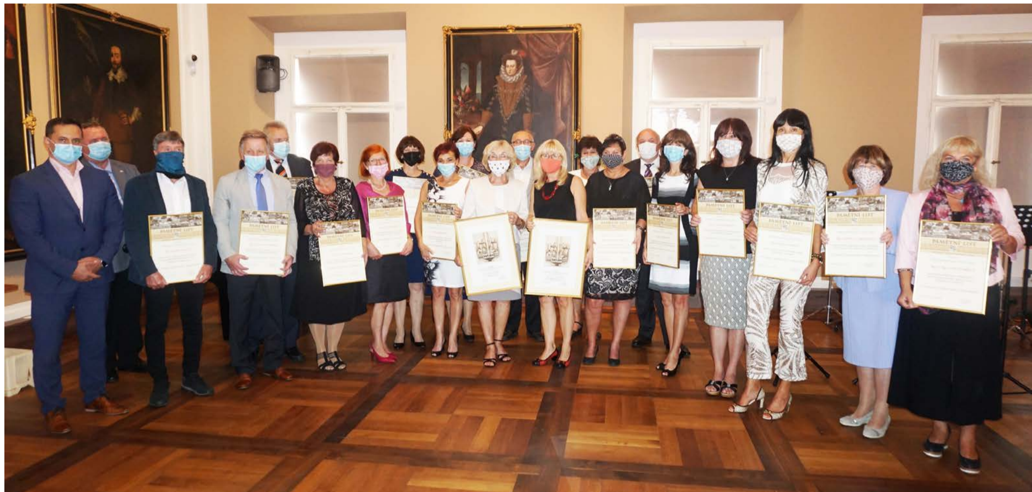
Slavnostní předání cen pedagogům a dalším pracovníkům škol a školských zařízení v regionu u příležitosti Dne učitelů proběhlo v náhradním termínu v Muzeu Cheb.