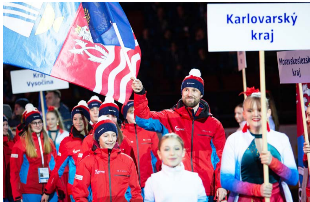
Hry IX. zimní olympiády dětí a mládeže Jedné z nejprestižnějších sportovních událostí v historii Karlovarského kraje se účastnilo 14 výprav z jednotlivých krajů a hlavního města Prahy, které vyslaly celkem 1340 sportovců.