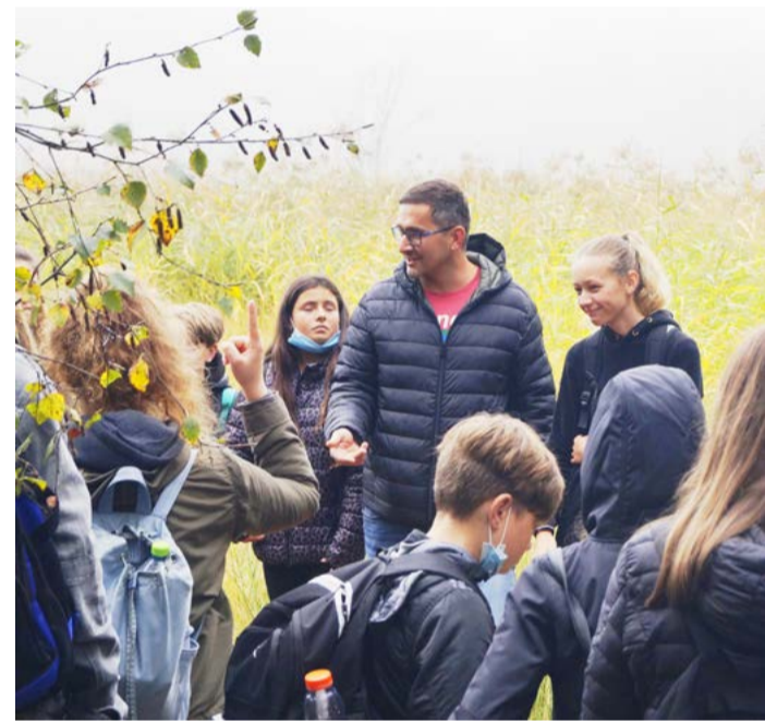
Žáci sledují výklad u Cisařského pramene v rezervaci SOOS.