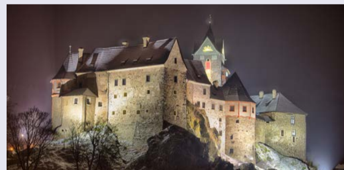
Hrad Loket v noci.