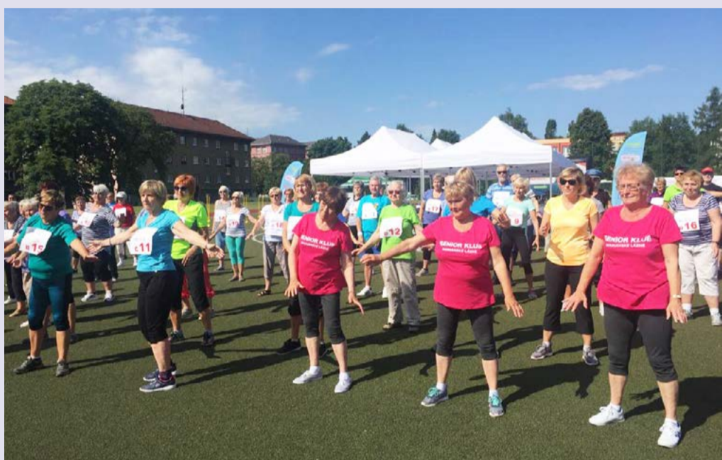
V Karlovarském kraji se poprvé konaly Sportovní hry seniorů. V Sokolově téměř 130 sportovců změřilo síly v nordic walking, biatlonu a dalších disciplínách. Blahopřejeme všem ke skvělým výkonům!