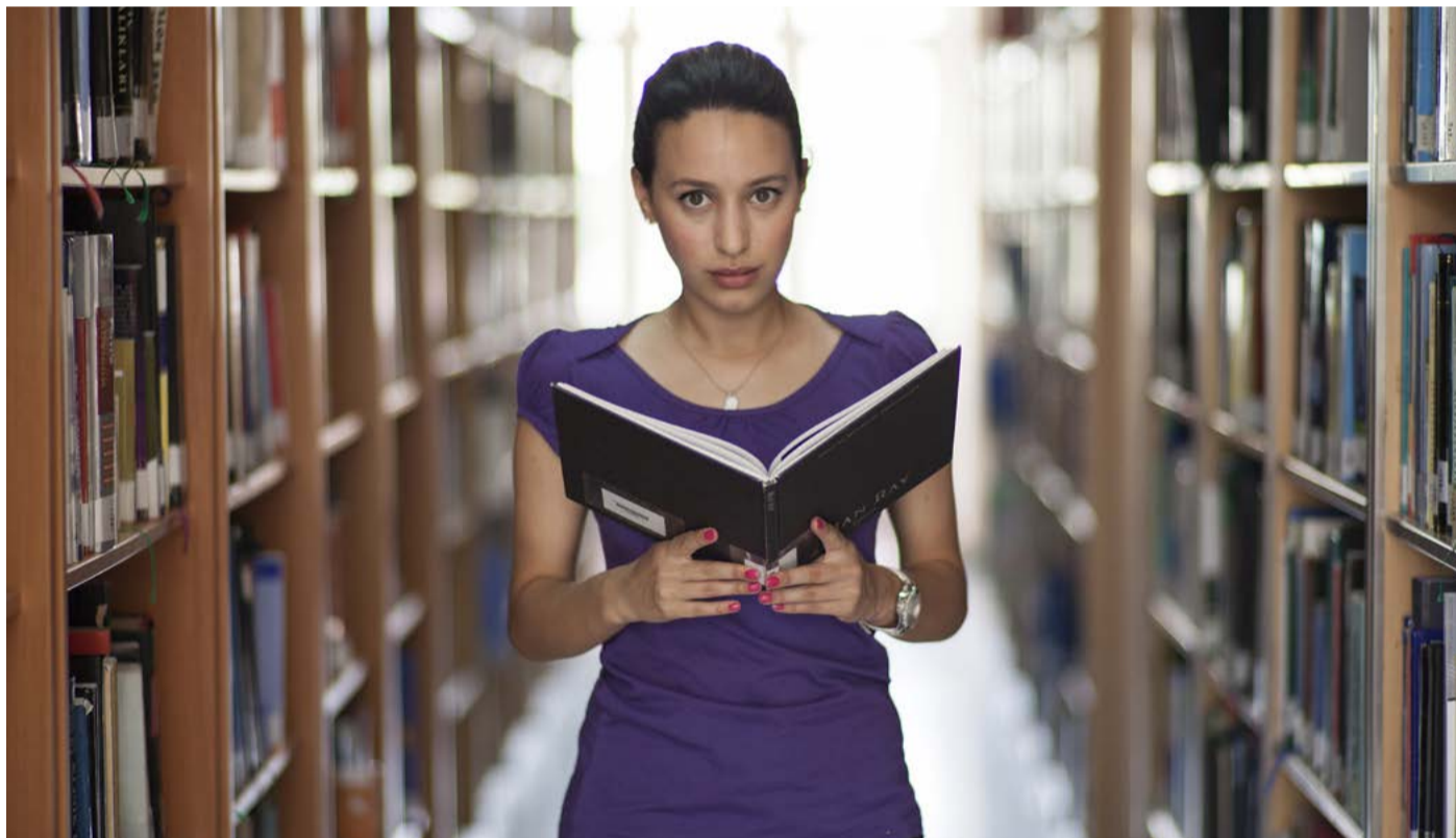
ZČU v Chebu Další vysokoškolské obory by mohla Západočeská univerzita Plzeň nabízet v Chebu od akademického roku 2020/2021.