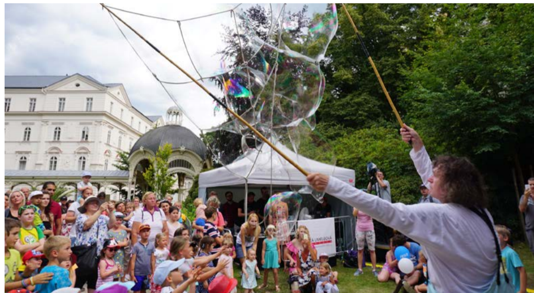
Roztančený festival s Karlovarským krajem nabídl už loni ve Dvořákových sadech skvělou muziku a spoustu zábavy pro malé i velké.