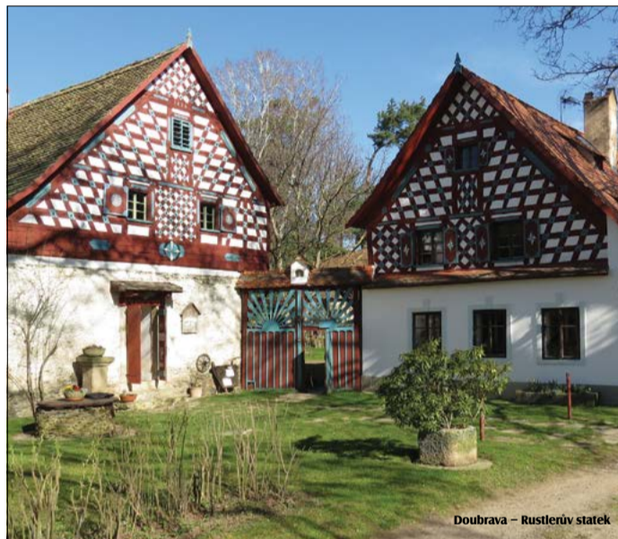
Doubrava – Rustlerův statek

Karlovarský kraj a Kotěrovo centrum architektury o.p.s. jménem pořadatelů a partnerů Dnů lidové architektury Karlovarského kraje 2019 si Vás dovoluují pozvat na