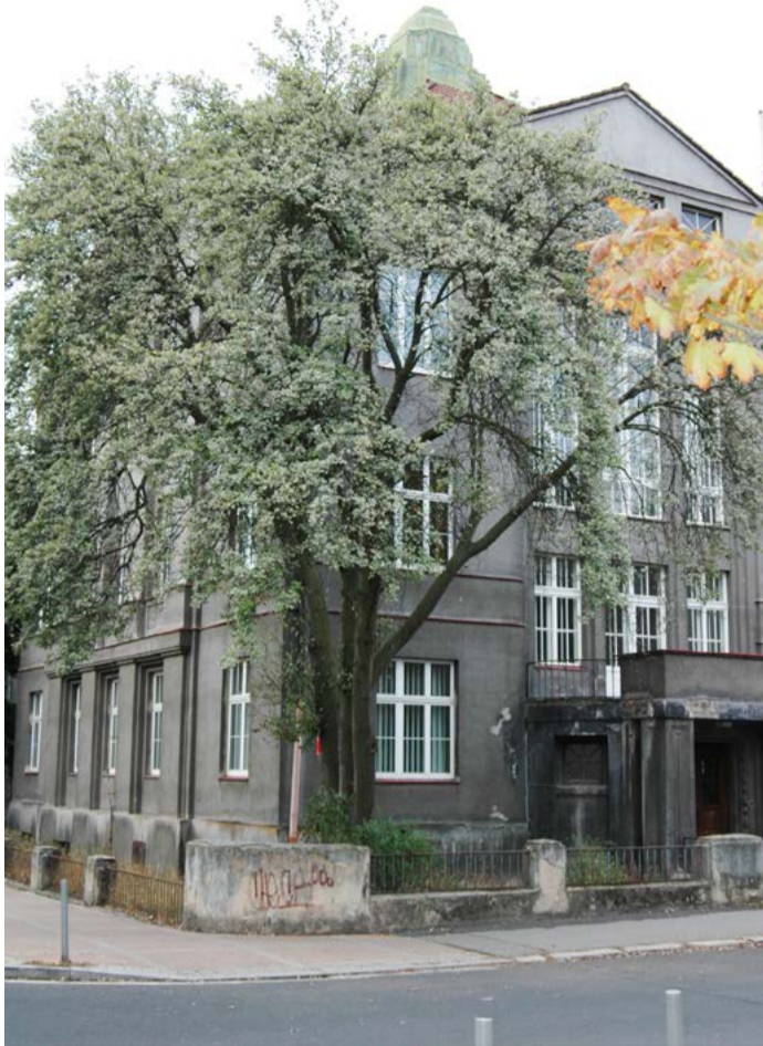
Střední uměleckoprůmyslová škola Karlovy Vary Původní budova takzvané „keramky“ je od března 2017 uzavřena, krajský zastupitelé zvažují možnosti pro urychlené řešení situace

vším vyslovili k tomu, že preferují zachování stávající budovy s nutností její rekonstrukce a architektonickou soutěž. „Je třeba ovšem kromě ekonomického hlediska brát v potaz i to, že nám jde o čas. Žákům i zaměstnancům školy