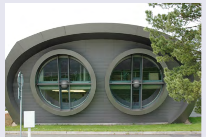
ČVUT v Karlovarském kraji. Letecká doprava, Profesionální pilot či Technologie údržby letadel. Nová pobočka nabídne atraktivní vzdělávací programy.

V rámci uzavřené smlouvy se obě strany zavázaly, že vyvinou potřebné úsilí k tomu, aby vybudovaly potřebnou infrastrukturu, zajistily ubytovací a stravovací kapacity a zařízení pro volnočasové a sportovní aktivity studentů. Do šesti měsíců od podpisu smlouvy by pak měla vzniknout pracovní skupina, která do konce ledna příštího roku zpracuje plán realizace projektu včetně finančních nákladů s výhledem do roku 2023. Ty si ponese každá strana podle toho, jaký úkol bude zrovna zajišťovat. (KÚ)