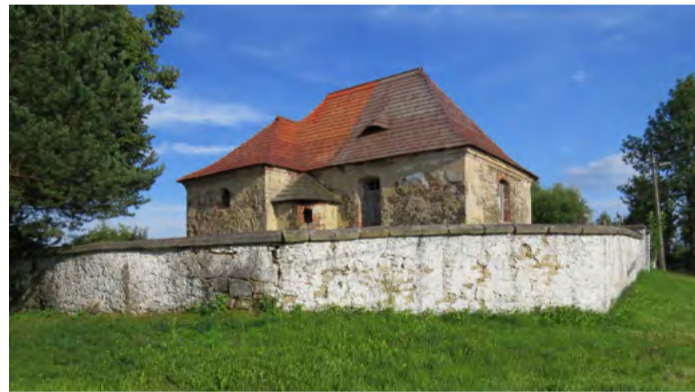
Přílezy Románský kostel sv. Bartoloměje.