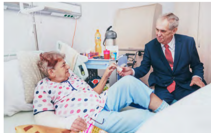
V nejdeckém REHOSu Miloš Zeman si našel čas také na setkání s klienty prvního kamenného hospice v regionu.