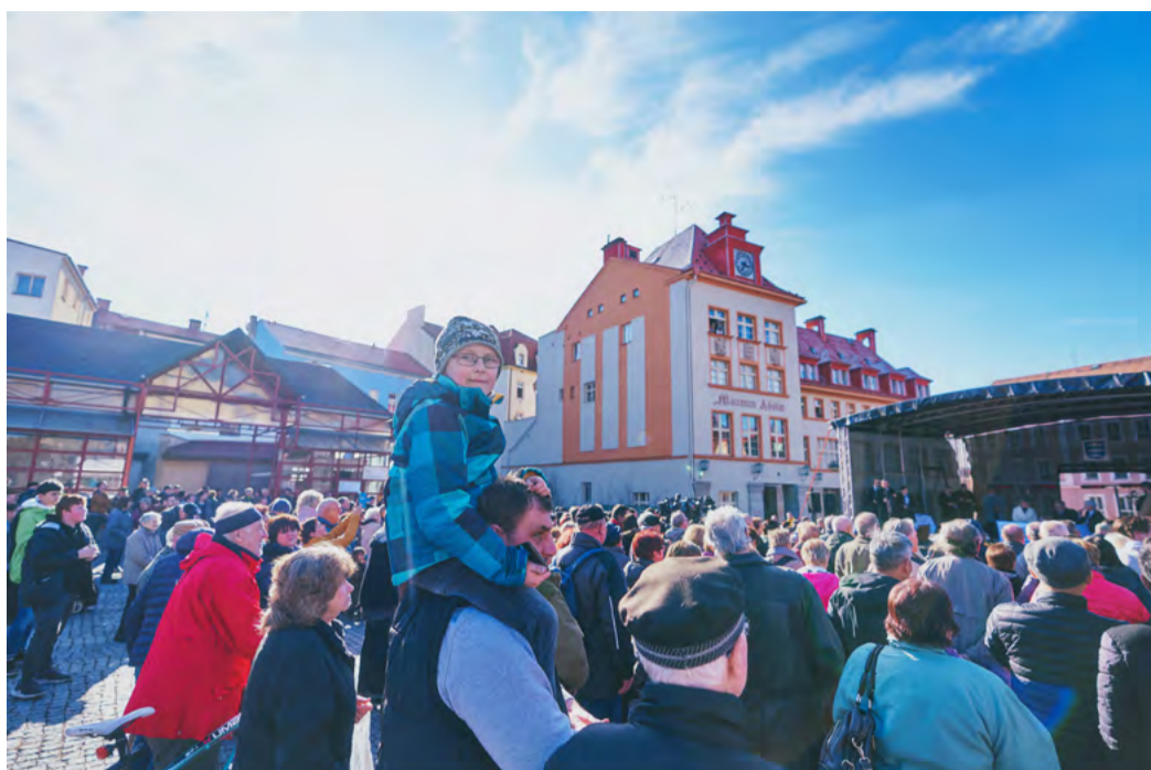
Na Poštovním náměstí V závěru druhého dne návštěvy zamířila hlava státu do Aše, do města s více než třinácti tisíci obyvateli zavítal Miloš Zeman podruhé.

Prezident v diskuzi s krajskými zastupiteli a starosty měst a obcí připomněl odchody obyvatel z regionu a nízkou životní úroveň, stačil také odpovědět na otázky týkající se zadržování části korunovačních klenotů Rakouskem, útlumu těžby či spalovny odpadu v Chebu. Vedení kraje pak pochválil za vybudování zařízení následné rehabilitační a hospicové péče v Nejdku a opravu karlovarských Císařských lázní, s níž by se po dlouhých letech neúspěšných pokusů mělo začít ještě letos v létě. Karlovarský kraj byl donedávna jedním z posledních dvou regionů, ve kterých chýběl kamenný hospic. Záštitu nad jeho vybudováním převzal Miloš Zeman v roce 2015 a stavba za 78,5 milionů korun byla dokončena vloni na