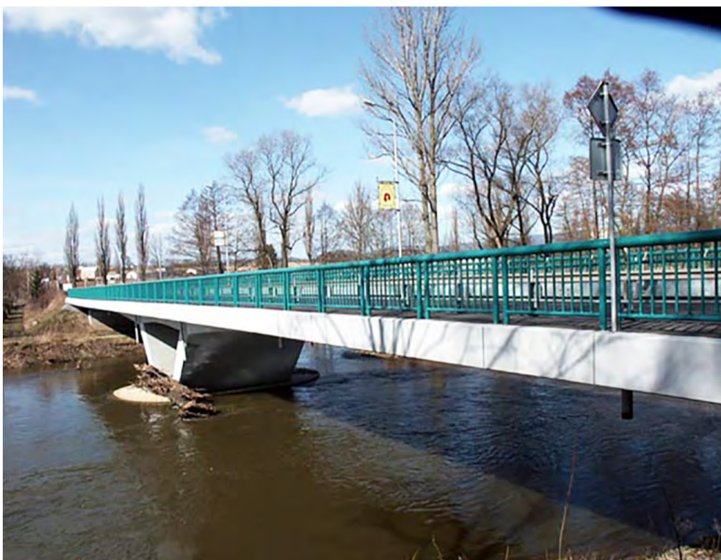
Most v Doubí V místě oprav bude úplně uzavřen úsek silnice I/20.

KARLOVY VARY Od 1. dubna 2018 do 30. října 2018 bude úplně uzavřen úsek silnice I/20 v místě opravy mostu v Karlových Varech - Doubí. Na základě diagnostického průzkumu z listopadu 2015 provede zhotovitel Eurovia CS během sedmi měsíců sanace nosné konstrukce a další potřebné opravy. Objízdné trasy budou pro osobní a nákladní automobily vedeny směrem od Plzně po ulicích Studentská, Plzeňská, Západní a Plynárenská, směrem od Prahy pak po silnici I/6 a ulicích Dolní Kamenná, Plynárenská, Západní, Plzeňská a Studentská. Trasa pro vozidla, která nesjedou směrem „Tuhnice, Dvory“ bude objízdná trasa pro vozy do 3,5 tuny vedena ulicemi Chebská, Kpt. Jaroše, Plzeňská a Studentská, pro vozy nad 3,5 tuny po silnici I/6 a ulicemi Plynárenská, Západní, Plzeňská a Studentská. Ve směru od Chebu bude objízdná trasa pro vozy do 3,5 tuny vedena ulicemi Chebská, Kpt. Jaroše, Plzeňská a Studentská, pro vozy nad 3,5 tuny pak po silnici I/6 a ulicemi Plynárenská, Západní, Plzeňská a Studentská. (KÚ)