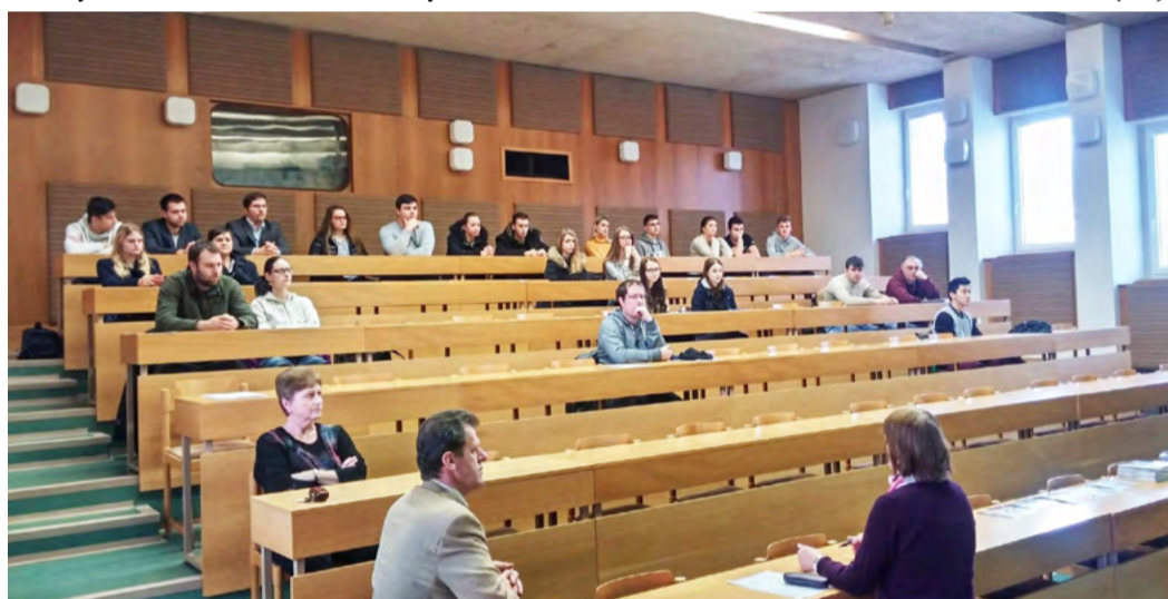
Ekonomická fakulta v Chebu Den otevřených dveří představil zájemcům studijní obory.