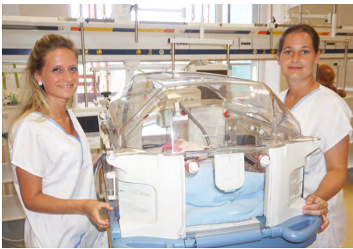
Práce pro celou rodinu Projekt cílí na Česko a Slovensko, časem se rozšíří také na další země.

Na webových stránkách nemocnice najdou zdravotníci pod záložkou Kariéra jednoduchý formulář a po jeho odeslání se jim zobrazí podobný pro rodinné příslušníky. Jejich data se pak dostanou k zaměstnavatelům, kteří se na systému podílejí. „O tom, zda sestřičky