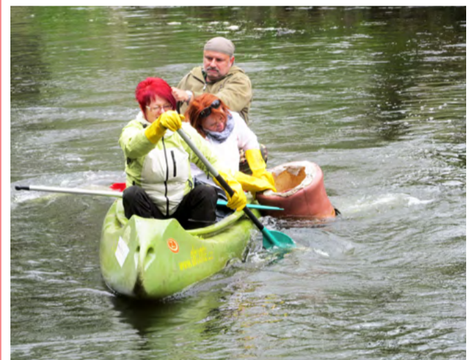
Odpadky patří do koše. Čistit se letos nebude pouze řeka Ohře, ale ruku k dílu přiloží dobrovolníci také na řece Teplé – v okolí Teplé a Bečova nad Teplou, od bečovských sádek až po Krásný jez.

Více informací naleznete na webu ksmas-karlovarsko.cz v sekci projekty, kde naleznete také kontakty na organizátory čištění jednotlivých úseků z řad Místních akčních skupin našeho kraje. (KÚ)