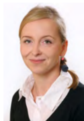
Karla Maříková poslankyně a krajská zastupitelka za SPD

Jedním z neduhů společnosti je lhostejnost lidí k politickému dění v zemi, jelikož lidé jsou otráveni politickou situací a politiky, kteří jim vždy před volbami naslibují hory doly, aby byli zvoleni a potom celé volební období vysvětlují, jaké že to byly objektivní příčiny, které nedovolily splnit předvolební sliby.