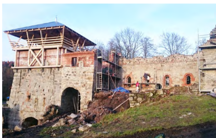
Huť v Šindelově. Záchraně stavební práce začaly v roce 2016.

doslova měnit před očima. „V této souvislosti bych chtěl Karlovarskému kraji vyjádřit poděkování za finanční podporu, které se našemu spolku za uplynulé dva roky dostalo. Musím se přiznat, že zejména bez této pomoci, pomoci Minister-