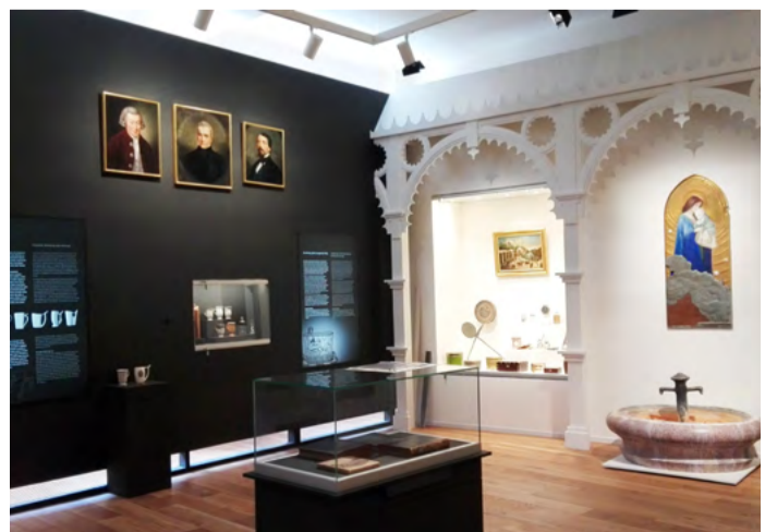
Nová stálá expozice Ložské stopadesáté výročí Muzea Karlovy Vary bylo již v roce 2012 impulsem k myšlence vytvořit novou stálou expozici, která by odpovídala 21. století.

Novou expozici otevřelo Muzeum Karlovy Vary v přestavěných prostorách loni v dubnu. Expozice obsahuje předměty, jež ještě nikdy nebyly veřejnosti prezentovány. Nechybí ani dotykové exponáty, které mají vzbudit emoce, představu a zamyšlení nad daným tématem, a dotykové monitory. S využitím moderních audiovizuálních prvků tak doslova útočí na divákovy smysly. Muzeum je pro návštěvníky otevřeno každý týden od středy do neděle, a to od 10 do 17 hodin (KÚ)