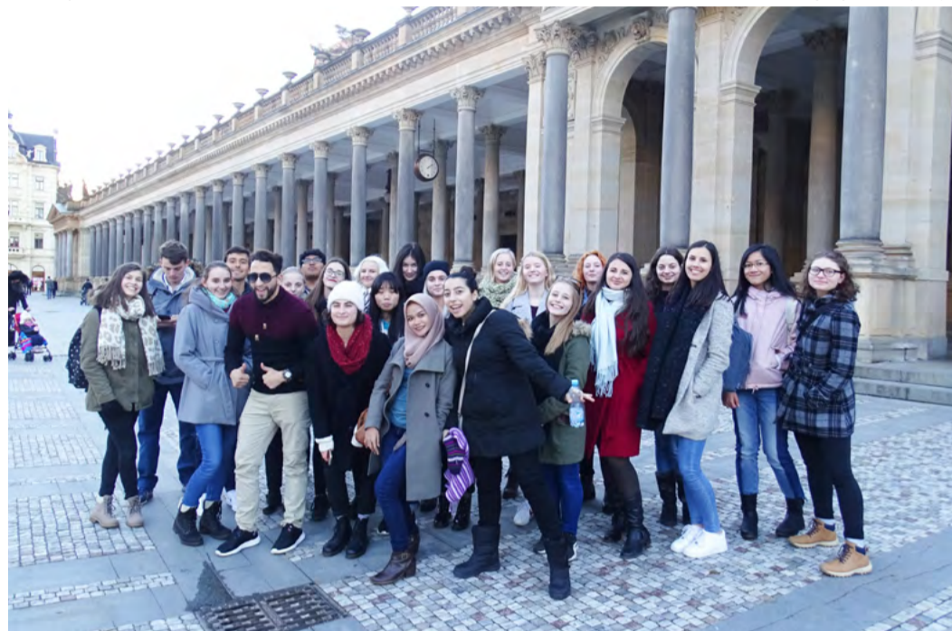
Stážísté na kolonádě Vysokoškolské studenty z Taiwanu, Indonésie, Ázerbajdžánu, Gruzie a Ukrajiny, ale také z Peru, Kostariky a Maroka hostila v rámci projektu Edison už podruhé Střední pedagogická škola, gymnázium a vyšší odborná škola Karlovy Vary.

Přestože šlo o krátkodobý pobyt stážístů, jak oni, tak studenti školy měli možnost poznat, co je spojuje a v čem jsou odlišní. Pro mnohé to navíc byl impuls k dalšímu zdokonalování se v cizím jazyce. (KÚ)