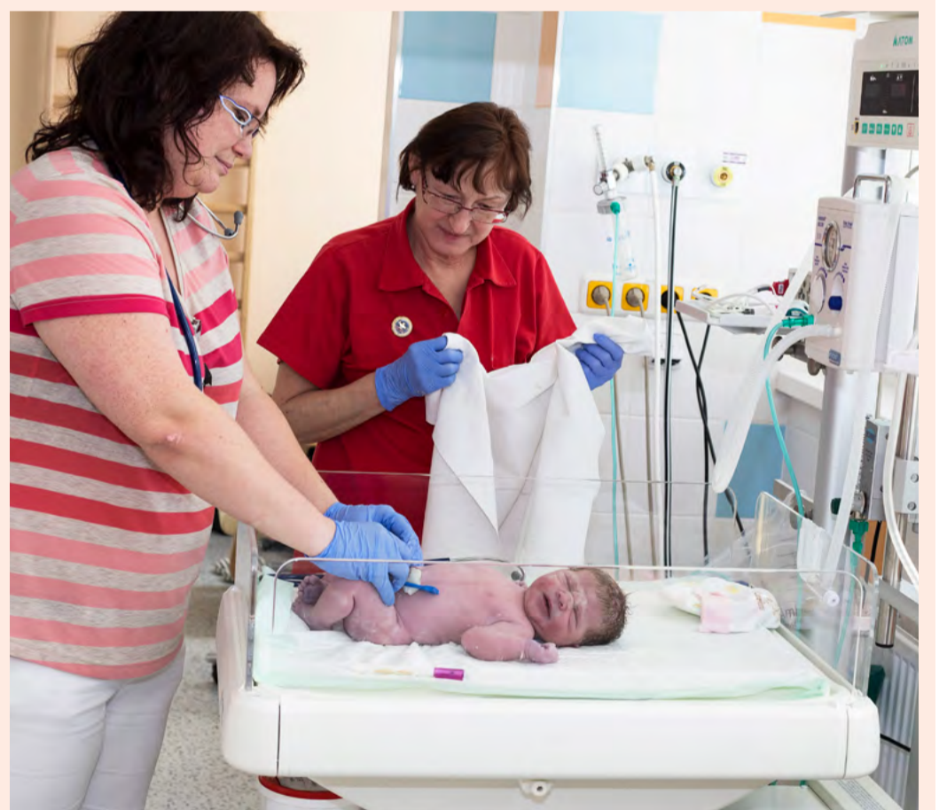
Vyučovací předměty V zimním semestru se bude vyučovat anatomie, biofyzika, ošetřovatelství, první pomoc nebo třeba specifika komunikace s nemocným