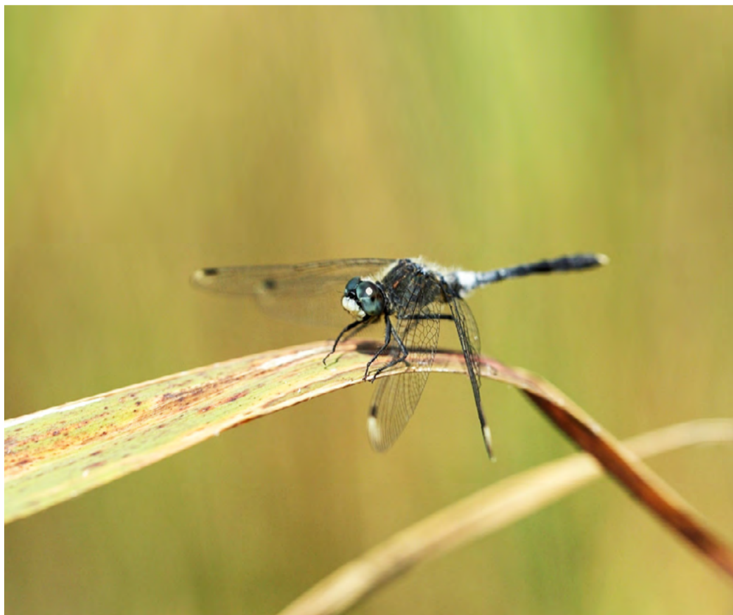
Na Vážkách Nejvýznamnějším druhem na novém chráněném území je vážka běloušá