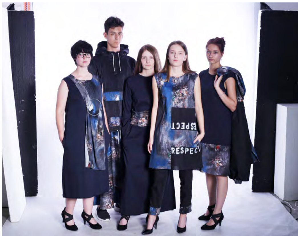
Oděv a Textil, Liberec Studenti oděvního designu ze Střední uměleckoprůmyslové školy Karlovy Vary navrhli a zhotovili pod odborným vedením svých pedagogů čtyři soutěžní kolekce.

KARLOVY VARY Koncem září se konal již čtvrtý ročník celorepublikové soutěže s mezinárodní účastí s názvem „Oděv a Textil, Liberec“. Do návrhářského klání bylo přihlášeno na 78 kolekcí. Studenti ze Střední uměleckoprůmyslové školy Karlovy Vary se v soutěži rozhodně neztratili a obsadili skvělá přední místa.