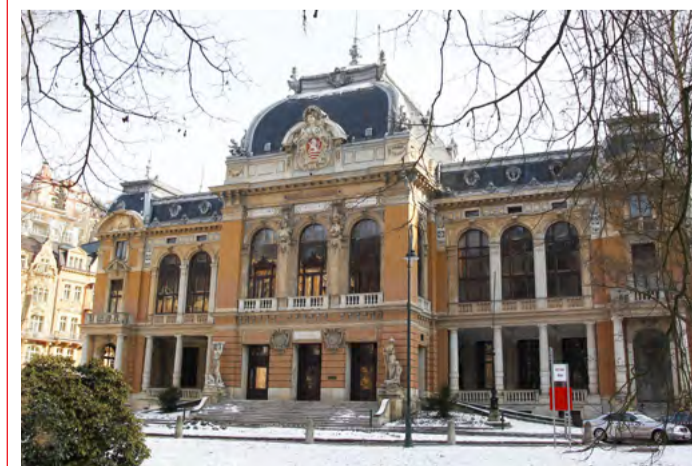
Císařské lázně Národní kulturní památka z konce 19. století i přes investice do opravy střechy stále chátrá.

Mezi vedením kraje, který je vlastníkem památky, a městem Karlovy Vary probíhá diskuse o dalším postupu v obnově Císařských lázní a o nalezení nejvhodnějšího využití objektu. Hejtmanka se dokonce sešla s památkáři, aby spolu prodiskutovali možnost vytvoření koncertního sálu pro symfonický orchestr. Tento záměr u nich ale narazil, protože by dle jejich slov došlo k narušení obvodového zdva. Památkáři upřednostňují, aby budova i v budoucnu sloužila alespoň zčásti původním lázeňským účelům. (KÚ)