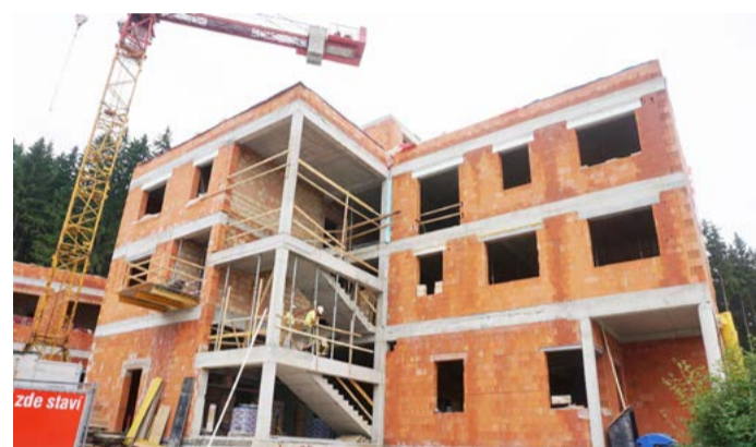
Budova hospicové péče, kterou kraj nechává vystavět v Nejdku, bude dokončena v únoru 2018.

Kromě výstavby kamenného hospice podporuje Karlovarský kraj také mobilní hospicové služby napříč