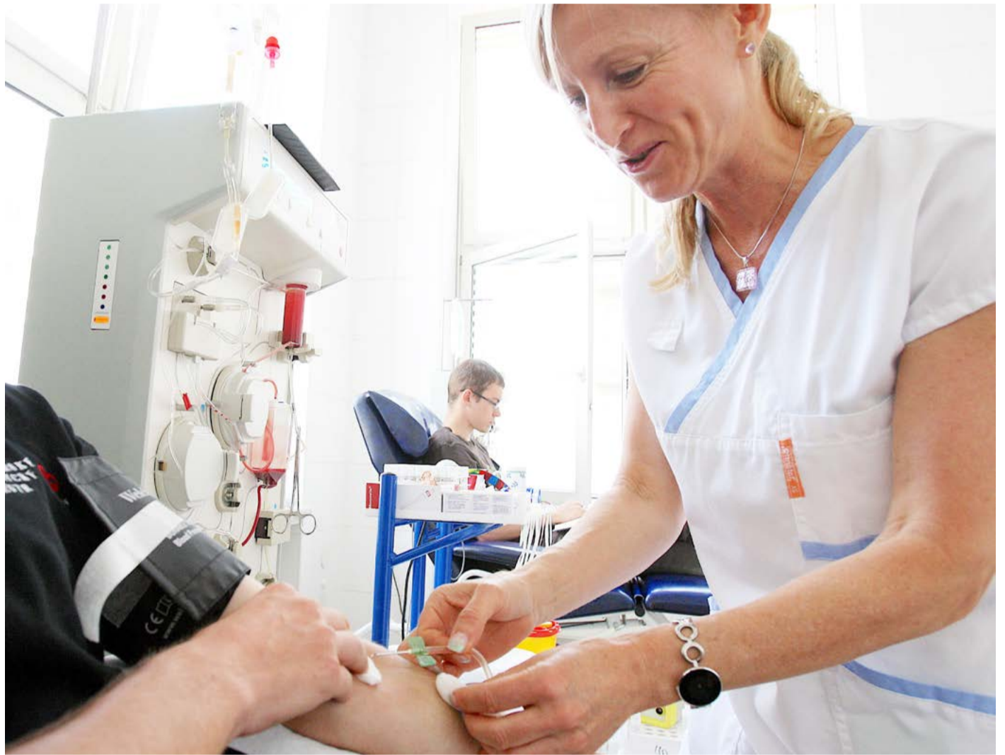
Dárcovství krve pomáhá zachraňovat zdraví a životy lidí