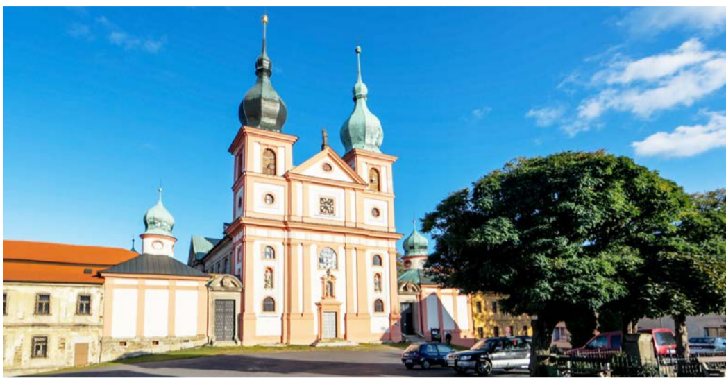
Barokní památky Areal probošství Chlum Svaté Maří