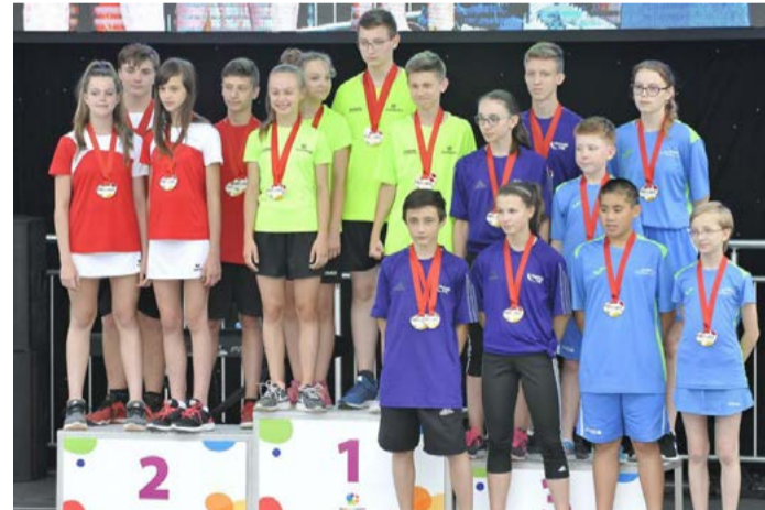
Karate kumite team starší žáci a žákyně