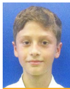
Chod Daniel Karate klub Chodov

1. místo karate kumite jednotlivci, starší žáci -50kg