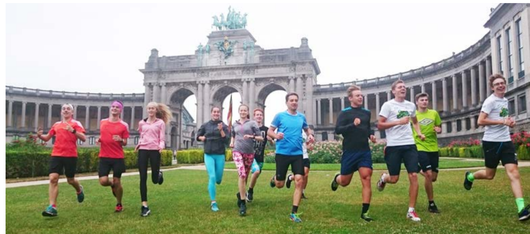
Chebští gymnazisté v pohybu u vítězného oblouku (Parc du Cinquantenaire)

V Radě EU jsme při simulovaném zasedání seděli na místech, která jinak patří ministrům členských zemí. Zajímavý pocit – a pro někoho možná další překvapení. Brusel nám nic nenařizuje, jak často zaznívá nad českými pivními půllitry, ale s předloženými návrhy musí souhlasit i vrcholní představitelé unijních států.