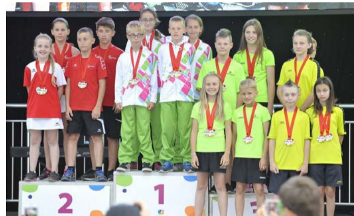
Karate kumite team mladší žáci a žákyně