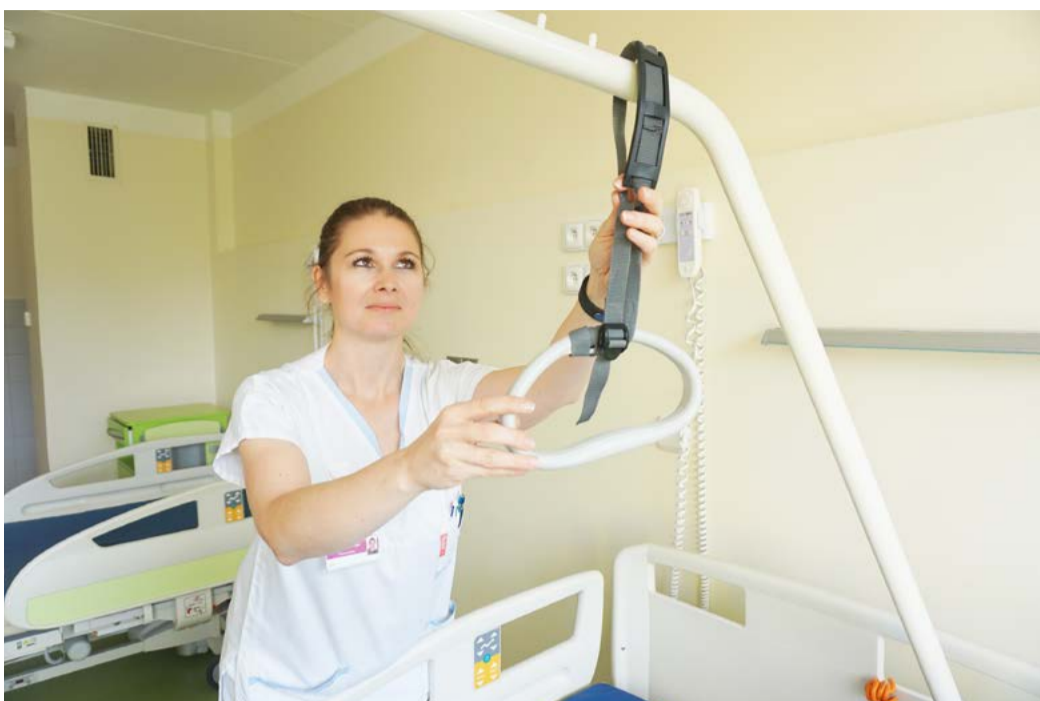
VŠ vzdělávání zdravotních sester Zájemci o vysokoškolské studium oboru Všeobecná sestra mohou studovat přímo v našem regionu.

Zázemí pro konzultační místa vznikne ve spolupráci s Fakultou ekonomickou ZČU v Chebu a v prostorách karlovarské vyšší odborné školy zdravotnické, kde se budou vyučovat některé praktické předměty. Výuka bude probíhat v pátek a o víkendech a zajistí ji špičkoví odborníci fakulty z Plzně. „Zájem je velký už teď, infor-