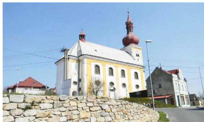
Skalná na Chebsku se pyšní titulem Vesnice roku Karlovarského kraje 2017

SKALNÁ Obce z celé České republiky mohly již po triadvacáté soutěžit o prestižní titul Vesnice roku. Z našeho regionu se do oblíbené soutěže přihlásilo celkem osmnáct obcí. Vítězem krajského kola a držitelem Zlaté stuhu se nakonec stala Skalná z Chebska.