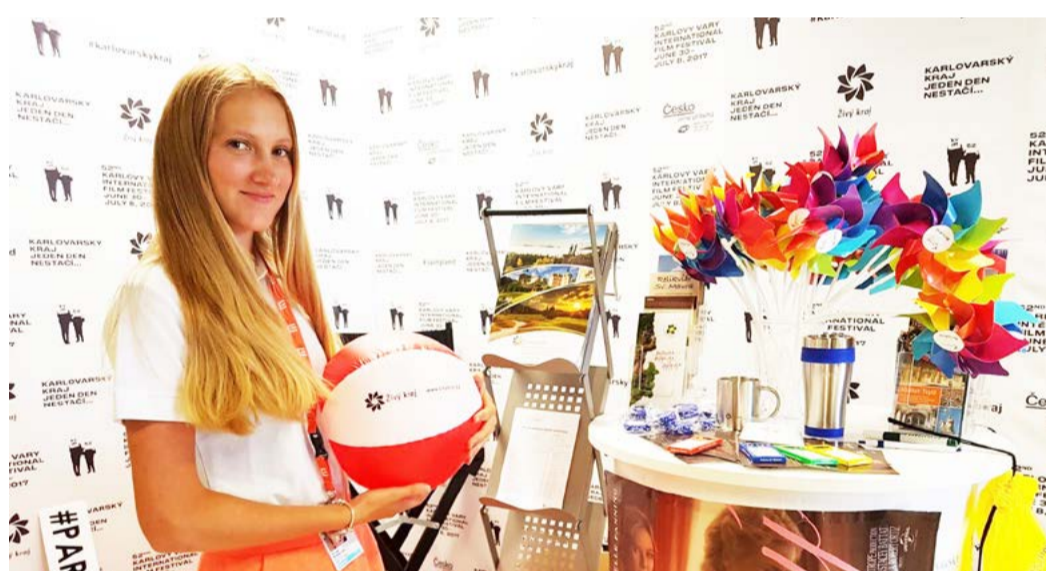
MF 2017 Karlovarský kraj měl poprvé v historii svůj festivalový stánek v hotelu Thermal. Stánek si okamžitě získal velkou popularitu návštěvníků, líbily se nejen soutěžní slamačky, větrníky nebo festivalové brýle s logem Živého kraje, ale také fotostěna, u které se mohli návštěvníci vyfotit s rekvizitami jako pravé filmové hvězdy.

KARLOVY VARY Mezinárodní filmový festival Karlovy Vary, který patří mezi nejprestižnější akce svého druhu ve střední a východní Evropě, je úspěšně za námi. O slavné filmové tvůrce a herce nebyla opět nouze. Mezi hlavní hvězdy festivalu patřil herec, scenárista, režisér, producent a letošní držitel Oscara a Zlatého glóbu Casey Affleck, herečka a producentka Uma Thurman či herec a hudebník Jeremy Renner. Po červeném koberci se prošel i hudební skladatel James Newton Howard, který obdržel