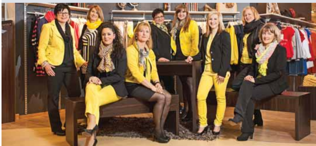
Přátelští spolupracovníci ve všech odděleních jsou vždy připraveni pomoci radou i skutkem!

Nadchněte se i vy pestrou nabídkou módy a jedinečným zážitkem při nákupu v obchodním domu Frey v Marktredwitz! Vyplatí se to!