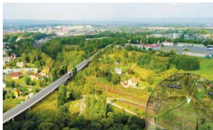
Jedna z plánovaných akcí. Výstavba jihovýchodního obchvatu Chebu by měla začít v roce 2014.

Nové učebny pak plánuje pro karlovarské gymnázium, pokračovat budou i práce na rekonstrukci prostor pro oční oddělení nemocnice v Sokolově. (red)