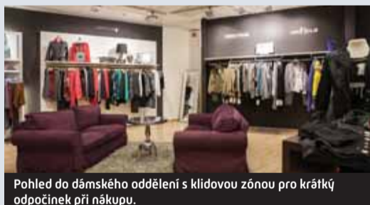
Pohled do dámského oddělení s klidovou zónou pro krátký odpočinek při nákupu.