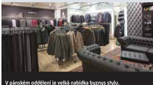
V pánském oddělení je velká nabídka byznys stylu.