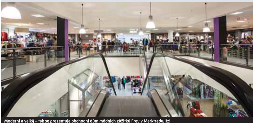
Moderní a velký – tak se prezentuje obchodní dům módních zážitků Frey v Marktredwitz!