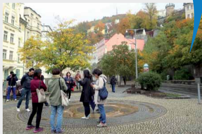
Korea objevila Karlovarský kraj, který teď korejské cestovní kanceláře začnou nabízet jako žhavou novinku. Korejšti touroperátoři (na snímku vlevo dole) odtud odletěli více než spokojeni.