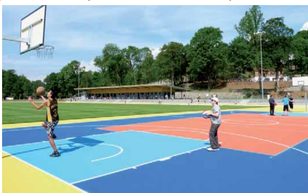
Projekt turistického využití levého břehu Ohře rozšířil sportovní aktivity v kraji.

Proplacení dotací, které ROP Severozápad dlužil příjemcům, bylo v rámci obnovení činnosti operačního progra-