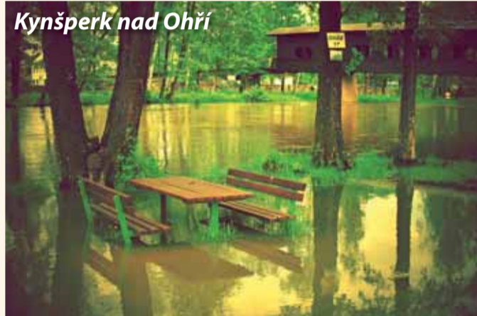
Kynšperk nad Ohří