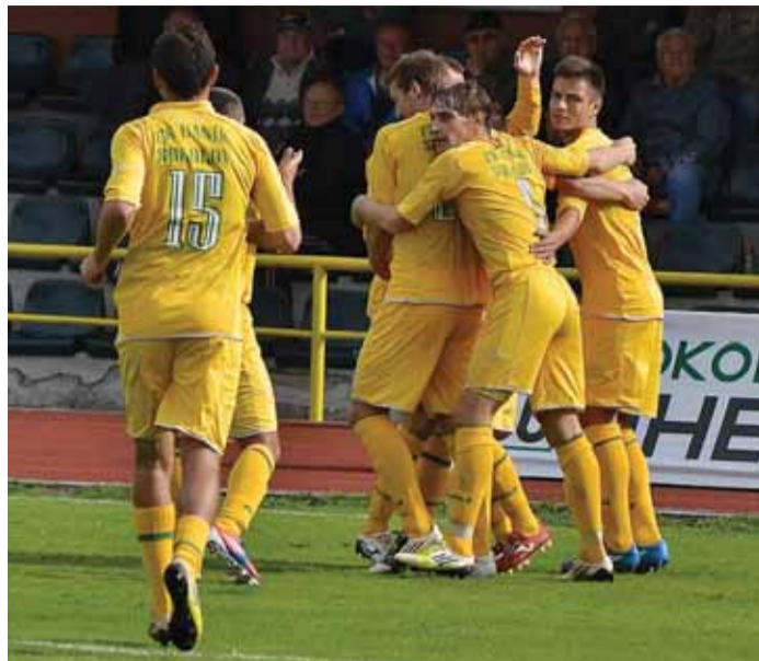
Takhle chutná radost Baníku.

Až do úplného konce Fotbalové národní ligy bojovali sokolovští fotbalisté o celkové 3. místo. Vynikající umístění z loňské sezóny nakonec nezopakovali, když je pouze díky lepším vzájemným zápasům předběhli hráči 1. HFK Olomouc.