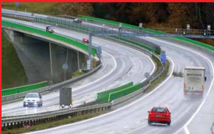
Budeme si pro R6 mezi Chebem a Karlovými Vary kupovat jen krajskou dálniční známku za 300 korun? Petici za její zavedení už na internetu podepsaly stovky lidí.

„Jde mi především o to, aby řidiči každého kraje měli možnost využít na určitých úsecích dálnic levnější variantu roční dálniční známky platnou pro daný region. Například v Karlovarském kraji musí řidiči platit 1500 korun za dálniční známku, ačkoli kraje vede jen přibližně čtyřicetkilometrový úsek rychlostní silnice R6 z Chebu do Karlových Varů, který většina řidičů využívá k přepravě převážně do práce. Pokud někdo například jezdí jen v Karlovarském a Plzeňském kraji a chce využívat kousek dálnice i v Plzeňském kraji, mohl by si koupit