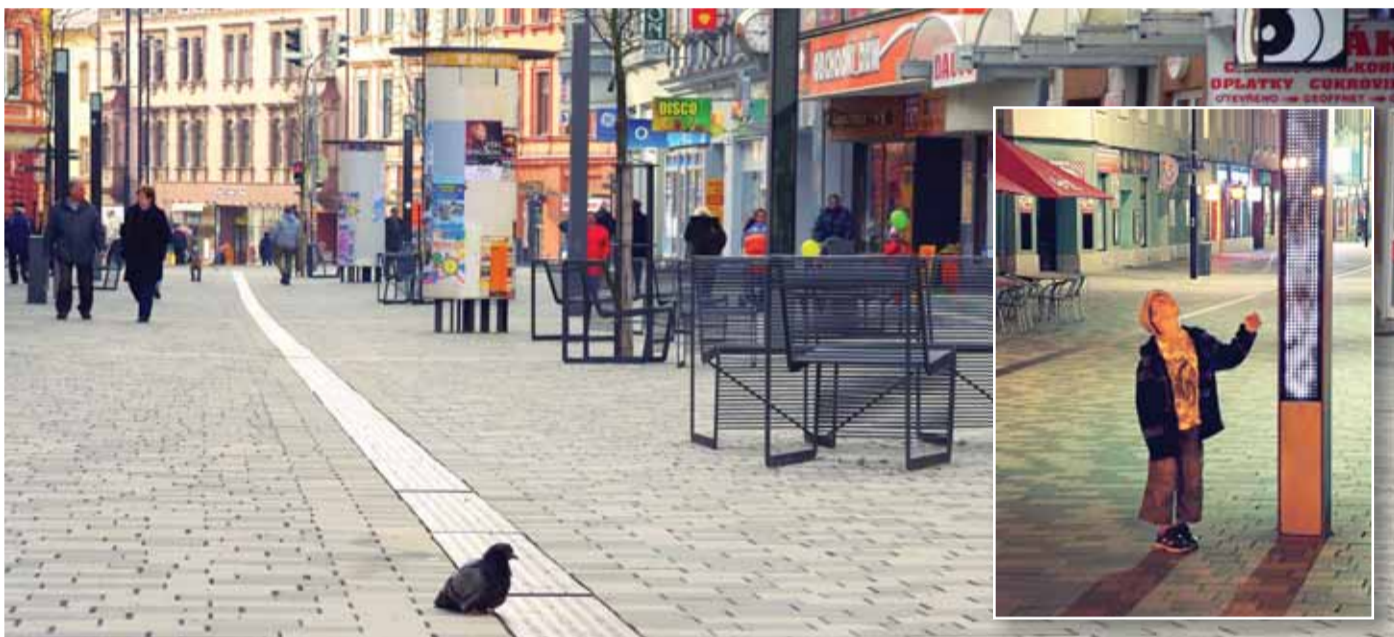
Jedním z úspěšných projektů, realizovaných s pomocí evropské dotace prostřednictvím ROP Severozápad, byla v Karlovarském kraji také rekonstrukce pěší zóny v Chebu.

Karlovarský kraj je pouze jedním ze žadatelů o dotace v rámci Regionálního operačního programu Severozápad, žadatelé jsou také měs-