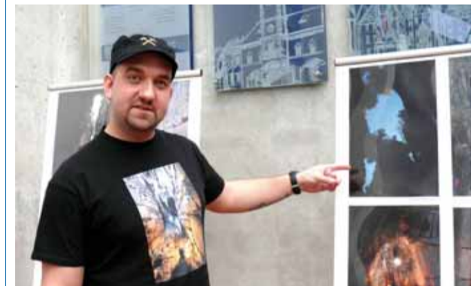
Autor fotografií Jan Albrecht.

Až do konce dubna mohou návštěvníci krajského úřadu zhlédnout výstavu fotografií Jana Albrechta s názvem „Hlubiny a vrcholů Krušných hor“, která je doplněna předměty dokladujícími historii dolování rud v Krušných horách. Výstavu ve vestibulu úřadu pořádá Karlovarský kraj ve spolupráci se Spolkem přátel dolu sv. Mauritius. Výstava je jednou z aktivit, kterými chce Karlovarský kraj přispět k informovanosti o projek-