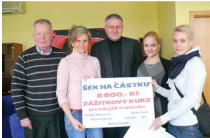
ZŠ Truhlářská převzala od pěti krajských zastupitelů šek na částku, která dětem zaplatí cestu za zážitkovým kurzem.

Celkem dvaadvacet žáků ZŠ Truhlářská Karlovy Vary pojedou na pětidenní zážitkový kurz v rámci vzdělávacího projektu občanského sdružení Prázdninová škola Lipnice.