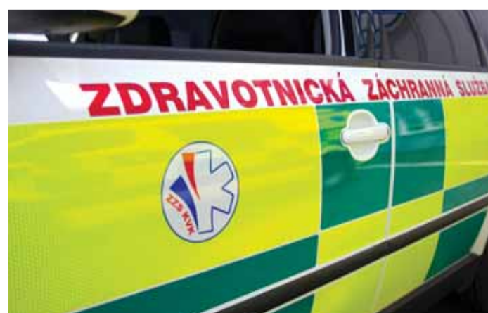
Díky nové mezistátní smlouvě by záchranářům z Karlovarského kraje, Bavorska a Sasko neměly už žádné překážky bránit v záchraně životů na území sousedského státu.