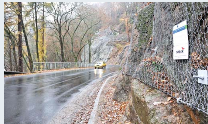
Sanované skalní masívy u silnice mezi Loktem a Horním Slavkovem. Úlomky hornin už tady nebudou padat na vozovku.

Cesta autem z Lokte do Horního Slavkova je od října bezpečnější, protože na silnici už nepadají kameny z přilehlých zvětralých skal. Karlovarský kraj nechal skalní masívy sanovat, jejich zabezpečení trvalo čtyři měsíce.