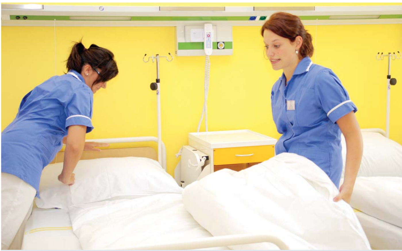
Dobrá zpráva pro pacienty v Karlovarském kraji. Zdejší nemocnice nečeká v příštích letech razantní úbytek lůžek.

Podle dohody s pojišťovnami nemocnic v Karlových Varech, Sokolově a v Chebu zůstane zachován asi devadesátiprocentní objem poskytované zdravotní péče, nebude se tedy zásadně měnit ani počet