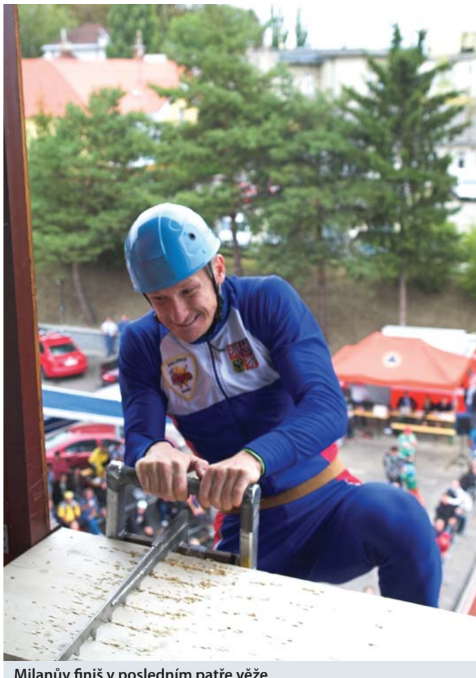
Milanův finiš v posledním patře věže

Před nedávnem se v Uherském Hradišti uskutečnilo Mistrovství České republiky v požárním sportu. Karlovarský kraj reprezentovalo v kategorii mužů družstvo SDH z Otročina a výběr Hasičského záchranného sboru Karlovarského kraje. Mezi ženami pak družstvo z Jáchymova.