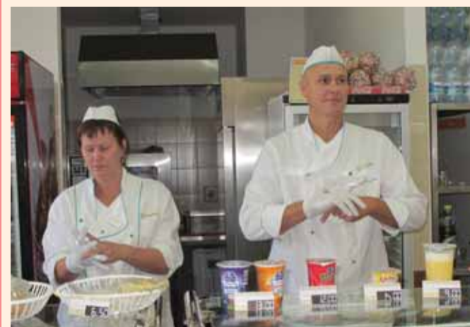
Nová výdejna jídel na Gymnáziu Sokolov.

Žáci a zaměstnanci sokolovského gymnázia už nemusejí na oběd chodit přes celé město.