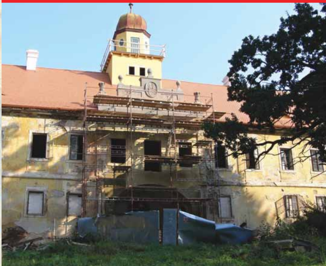
Modernizace mostu ve Žluticích - 6,8 milionu korun; oprava krovu a střešní krytiny plus oplechování věže kostela v Močidlcích - 520 tisíc korun; podpora využití obnovitelných zdrojů energie společnosti Žlutická teplárenská - 300 tisíc korun; rekonstrukce zámku Štědrá - 296 000 korun; záchrana sousoší Piety ve Žluticích - 40 tisíc korun