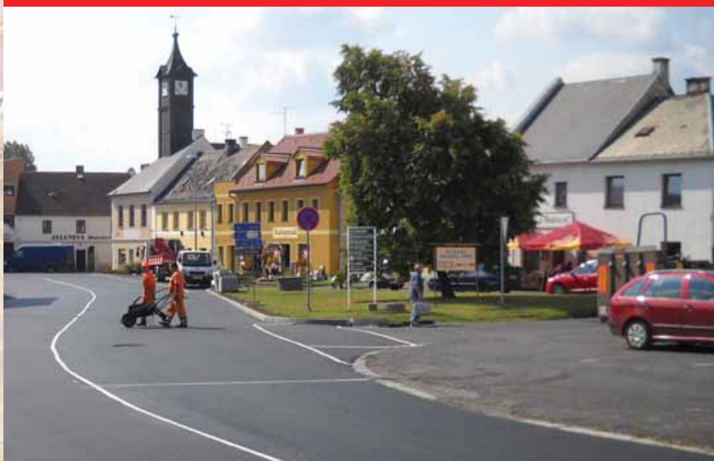
Oprava povrchu průtahu Toužimí - 2,4 miliony korun; oprava povrchu silnice Kozlov - Kojšovice - cca 3 miliony korun; oprava, adaptace a revitalizace objektu zámku v Toužimi - 400 tisíc korun (příspěvek KK); obnova krajinných struktur u Blažejského rybníka - 40 tisíc (příspěvek KK); oprava krovu a střešní konstrukce a dokončení střešního pláště hlavní lodi kostela sv. Michaela Archanděla v Toužim-Brložec - 200 tisíc korun (příspěvek KK)