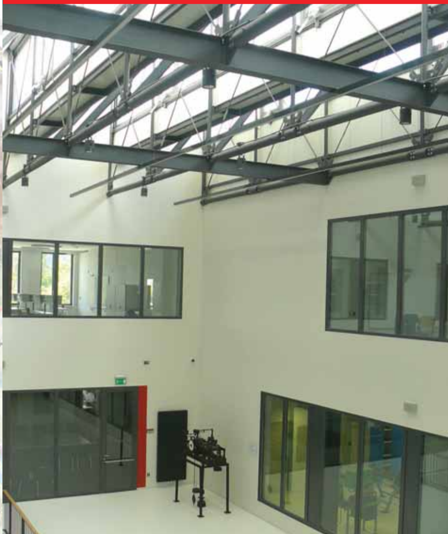
Centrum technického vzdělávání Ostrov - 470 milionů korun (stavba získala ocenění Nejlepší investice soutěže TOP INVEST 2011); modernizace části silnice II/221 Merklín - Pstruží - cca 73,6 milionu korun; rekonstrukce opěrné zdi mincovny v Jáchymově - 5 milionů korun; dodatečné zateplení Gymnázia Ostrov - 8 milionů korun; záchrana raně gotických omítek, fasáda, záchrana barokních podhledů a restaurování kostela sv. Máří Magdalény v Boru u Ostrova - 50 tisíc korun (příspěvek kraje); odchytová služba volně žijících živočichů - Ostrovský Macík - 50 tisíc korun (příspěvek kraje);