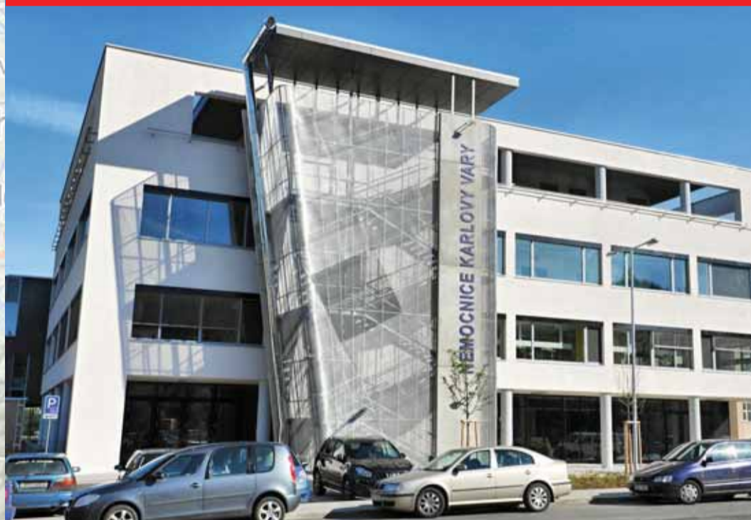
Pavilon akutní medicíny v Karlových Varech - 597 milionů korun; rekonstrukce Bechery vily - 87 milionů korun; modernizace silnice III/21047 Nejdek - cca 28 milionů korun; obnova střešní konstrukce objektu Císařských lázní - zhruba 3 miliony korun; modernizace koupelen a hygienických vybavení domu s pečovatelskou službou v Perninku - cca 4,5 milionu korun; oprava střešní konstrukce a pláště LDN Nejdek - 6,6 milionu korun; výměna oken v Domově mládeže a ŠJ v Karlových Varech - 800 tisíc korun; rekonstrukce budovy Obchodní akademie a VOŠ cestovního ruchu v Karlových Varech - 19 milionů korun; oprava objektu Teplička - I. etapa - 1 milion korun; rekonstrukce střešní konstrukce Krajského dětského domova pro děti do 3let v Karlových Varech - 23 miliony korun

ionů korun; Do- protipovodňová vilonu A a elek- onu korun; pře- n ve 4. NP Gym- y živnostenské okolov - 1,1 mi-