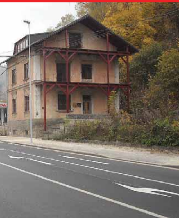
Rekonstrukce mostu v Rotavě - cca 18 milionů korun; oprava střešní konstrukce a střešní krytiny kostela Božího Těla v Kraslicích - 50 tisíc