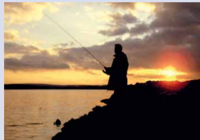
Po myslivcích a chovatelích teď Karlovarský kraj navázal partnerství s rybáři.