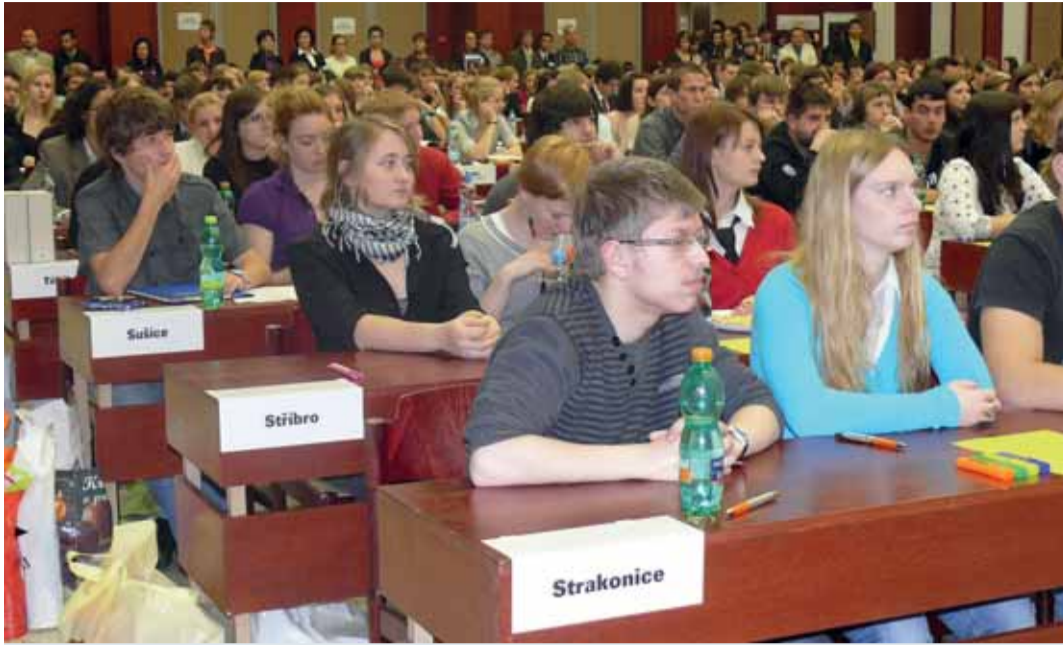
V prostorách EF ZČU Plzeň v Chebu právě začíná 20. ročník Dějepisné soutěže studentů gymnázií.

Ve čtvrtek 24. listopadu se v prostorách Ekonomické fakulty Západočeské univerzity uskutečnil jubilejní XX. ročník mezinárodní Dějepisné soutěže studentů gymnázií.