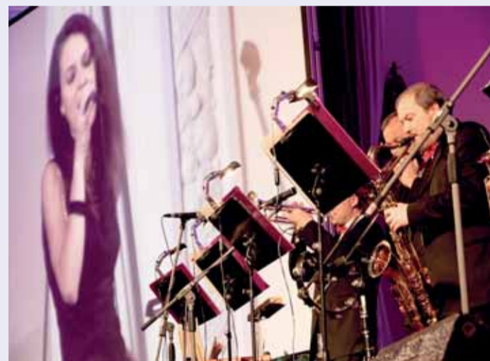
Předávání cen se konalo v karlovarském Grandhotelu Pupp. Mluvené slovo moderátorů pravidelně střídal živý zpěv. A také zvuk saxofonů.