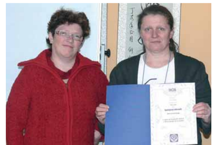
Zástupci Centra sociálních služeb v Mariánských Lázních s oceněním „Spokojený zákazník“.

Podnikatelé získávají ocenění spotřebitelů na dva roky, využít ho mohou například v marketingu. Cena není spojena s finanční odměnou.